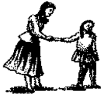
لا يواجه بالنظر