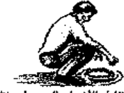
يتناول الأشياء باليد من دون يلتفتها