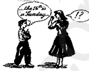
إعجاب الجانب في التفاعل مع الآخرين