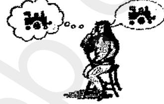
يكرر الحديث المتواصل حول موضوع واحد