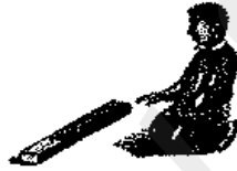
يلعب علويا من دون تصنع