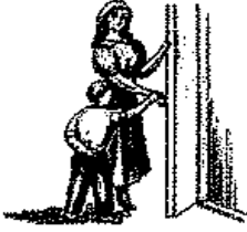
يشير إلى احتياجاته باستخدام يد أحد الكبار