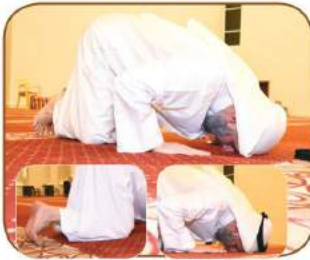
الوجه والكفان الركبتان والقدمان

4 - «ويستقبل بصدور قدميه القبلة» (البخاري) بأطراف أصابعهما