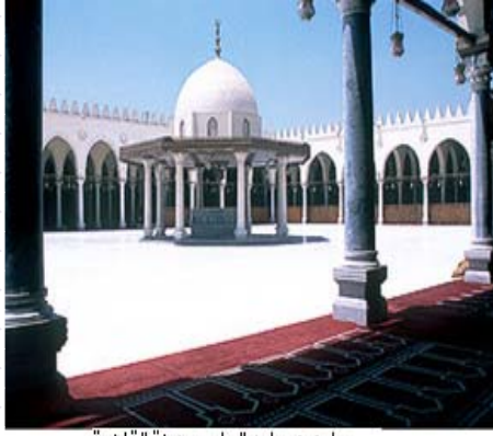
جامع عمر ابن العاص بمدينة القاهرة

النوعت بعمرو أن ندعوه بـ محرر مصر . فالإسلام لم يكن يفتح البلاد بالمفهوم الحديث للفتح، إنما كان يحررها من تسلط إمبراطوريتين سامتا