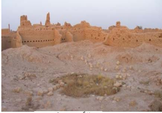
منطقة الاخدود في نجران

"رقمات" أو مدينة الأخدود الأثرية والتي تقع على مساحة 5 كيلو مترات مربعة على الحزام الجنوبي من وادي منطقة نجران (جنوب