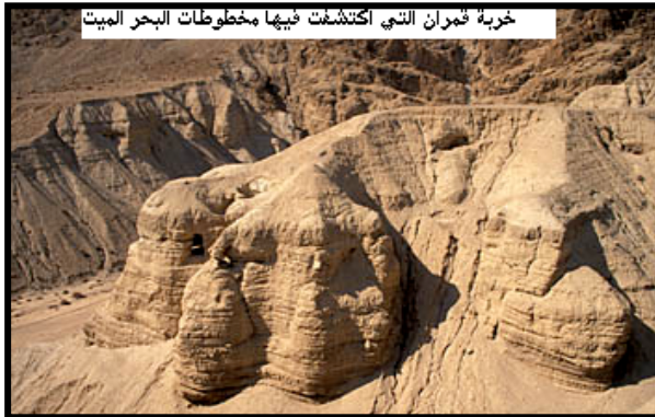
خربة قمران التي إكتشفت فيها مخطوطات البحر الميت