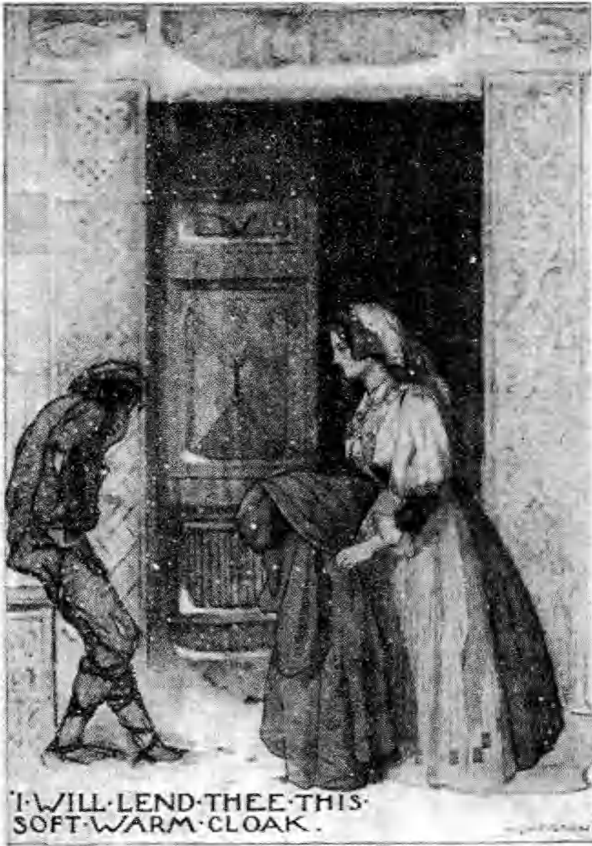
قديسة لوكا العذراء تعير الشحاذ المعطف الوثير