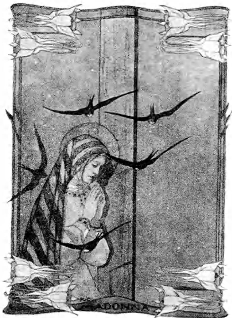
الغذراء مريم كما تصورتها الرسامة كاترين كامبيرون حين وقفت باكية تحت الصليب