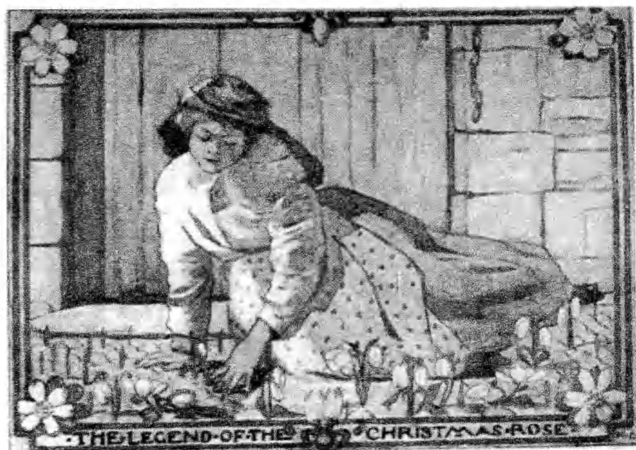
عذراء أسطورة عيد الميلاد