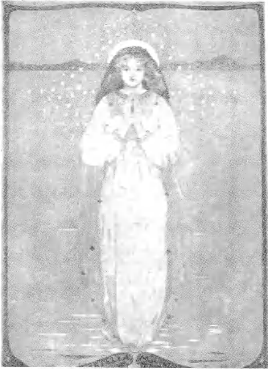
السيدة العذراء تبدو للصيادين - كما تروى الأسطورة