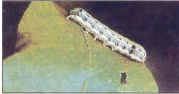
دودة ورق القطن