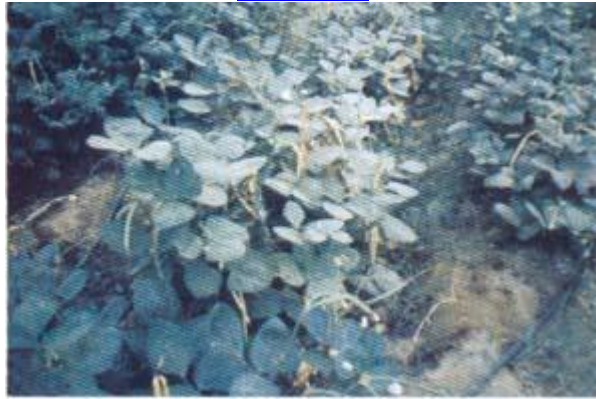
صورة دقى ٣٣١