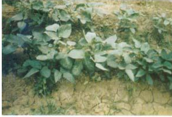
أهمية الكثافة النباتية ( عدد النباتات لكل فدان )