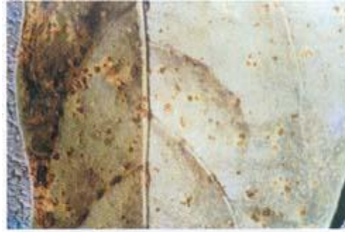
أعراض الصدأ على اللوبيا