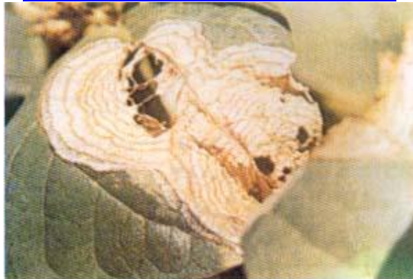
مرض الأسكوكيتا على اللوبيا