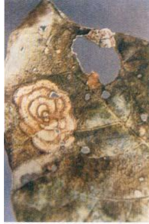
تبقعات الأوراق على اللوبيا