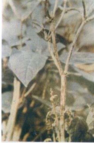
مرض الأنثراكنوز على اللوبيا