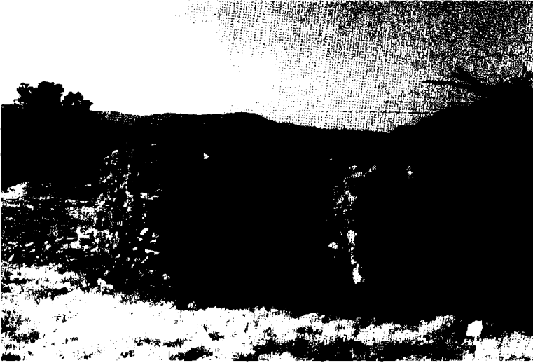
خرائب قديمة في جباب الحمر (سهل البقاع) (الشكل 3)

ببعض الممتلكات في المنطقة في القرن التاسع عشر (1) . على أنّ أكثر العشائر الشيعية، بمن فيهم آل حمادة أنفسهم، وجدوا ملجأ لهم على المنحدرات القاحلة في البقاع الشمالي وفي الهرمل أو بعلبك بعد هزيمتهم سنة 1771. كما إنّ قبيلة ناصر الدين، التي ترجع أصولها إلى «بزيون» في الفتوح، تمارس حتى اليوم طقوساً رعوية في «جباب الحمر» على الخاصرة الشرقية لجبل لبنان (انظر: الشكل 3)؛ وبمعنى ما يشكلون آخر البقايا الحية من اتحاد الحقبة العثمانية (2) .