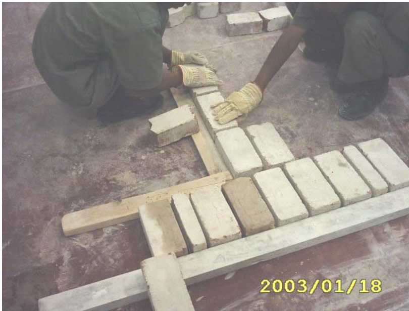
كيفية بناء المدماك الأول