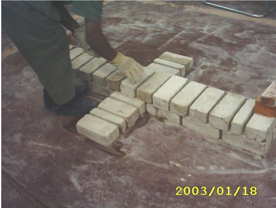
كيفية بناء المدماك الثاني