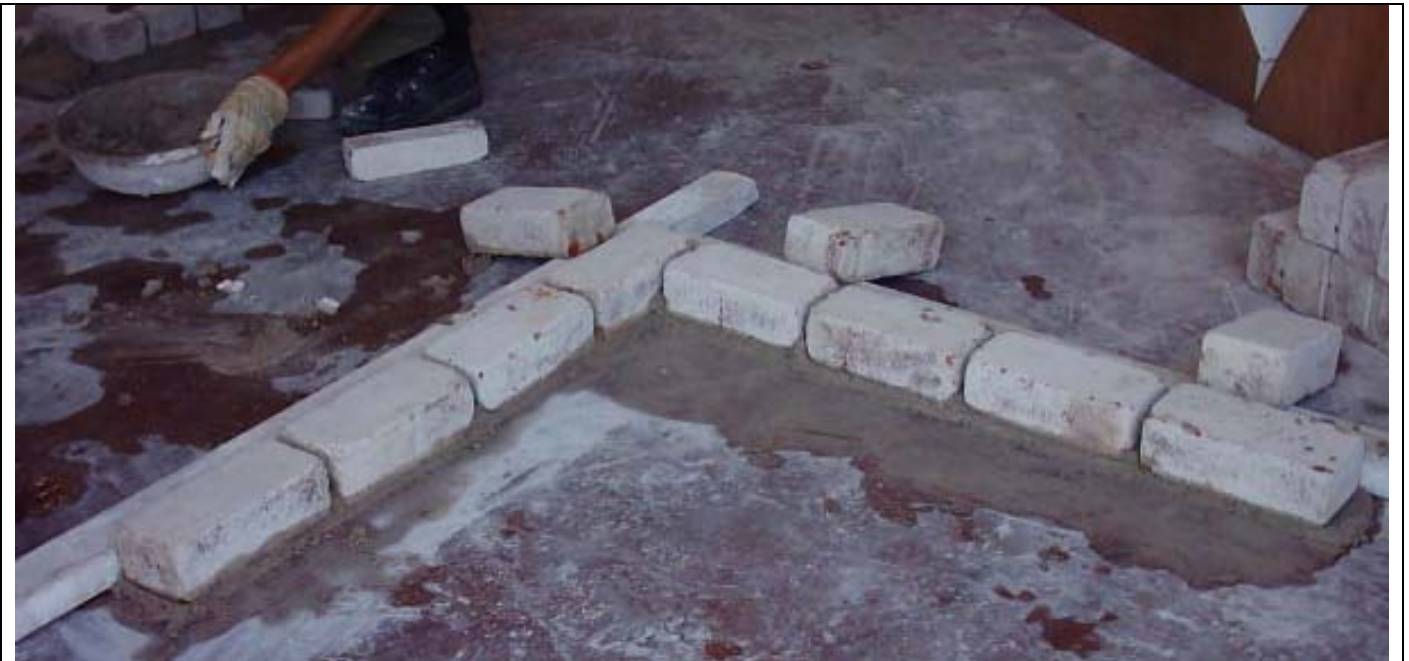
نهاية المدماك الأول