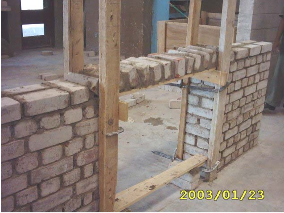
بناء المدماك الأول في العقد المستقيم