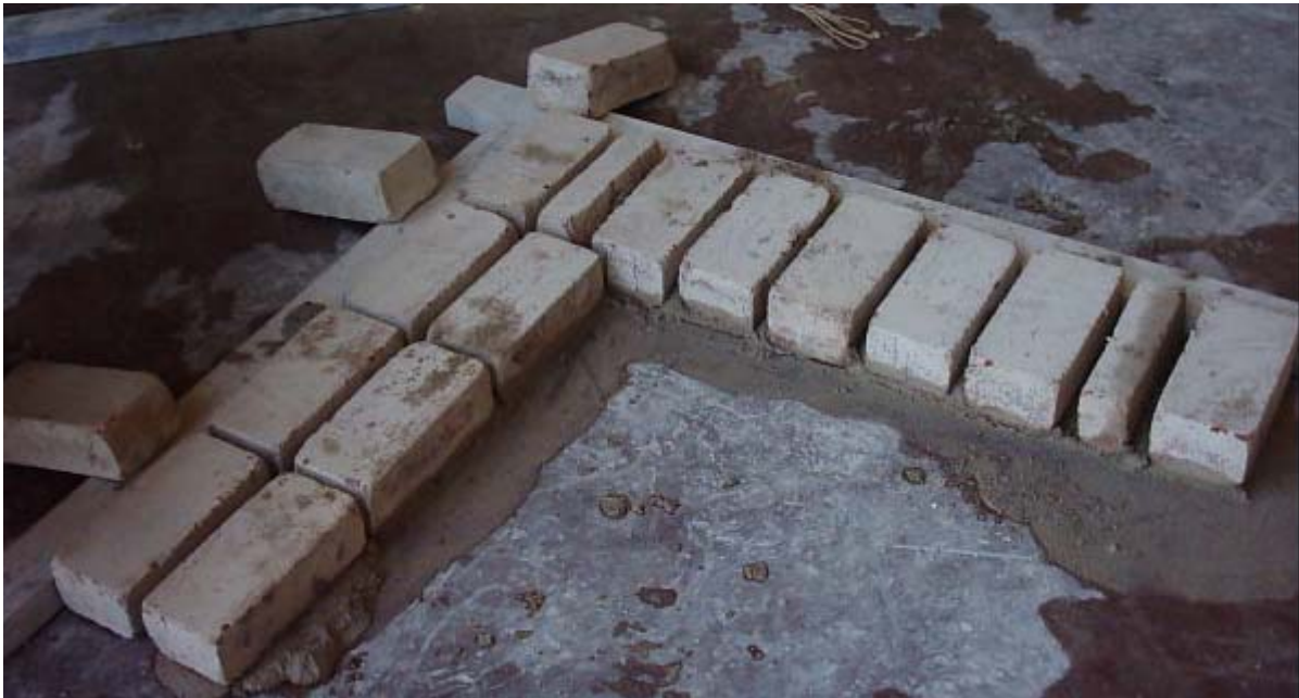
نهاية المدماك الأول