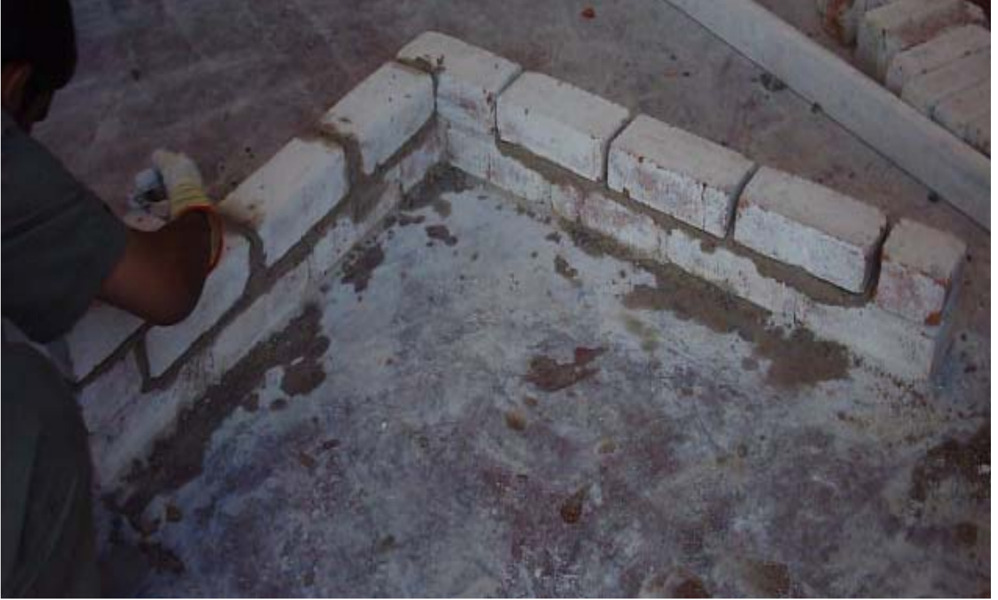
بناء المدماك الثاني

(3) يتم بناء المدماك الثاني بعمل الترويسة لكل ضلع فتوضع ترويسة المدماك الثاني الرئيس (أساسي) ثم توضع ترويسة المدماك الفرعي وتكون ترويسة الزاوية مشتركة بين الأساسي والفرعي ثم يشد الخيط كل ضلع على حدة كما في الشكل