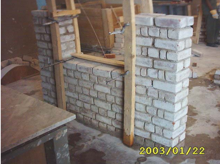
بناء الأكتاف الخاصة بالعقد الموتور

(1) يتم بناء الأكتاف الخاصة بالفتحات سواء كانت فتحات أبواب أو شبابيك كما في الشكل