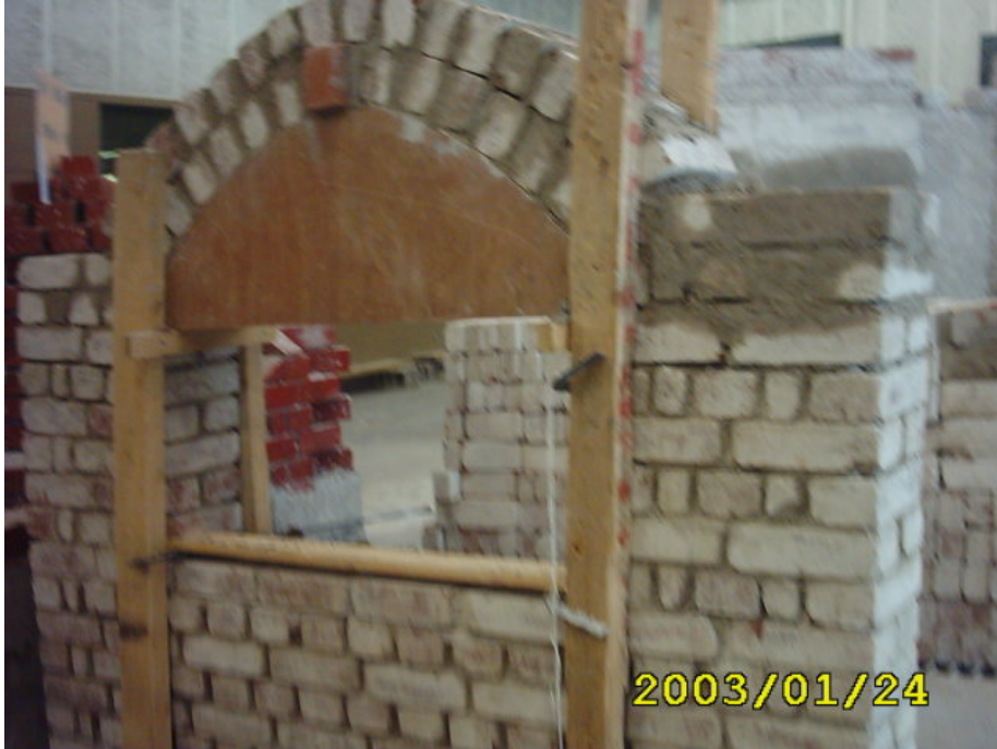
بناء المدماك الثاني

(3) بناء المدماك الثاني على المدماك الأول بنفس الطريقة السابقة في بناء المدماك الأول كما في الشكل