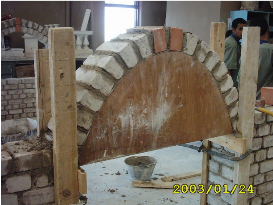
بناء المدماك الأول

العقد) باستخدام الخيط الناوي كما في الشكل