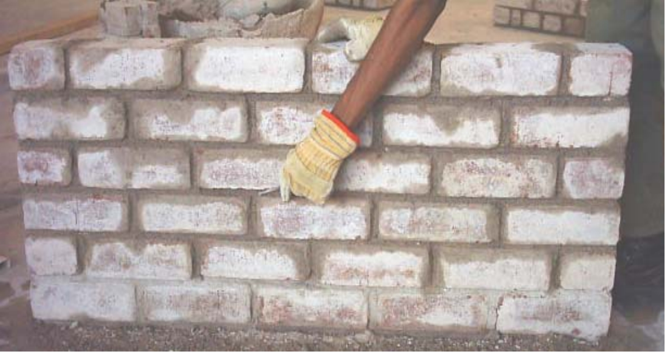
طريقة تفريغ اللحامات

4) يتم بناء المدماك الثالث والرابع وتكون هذه المداميك بنفس خطوات بناء المدماك الثاني مع عمل الترويستين مع وزن كل ترويسة بميزان الماء طولياً وعرضياً مع شد الخيط بينهما مع تفريغ اللحامات كما في الشكل