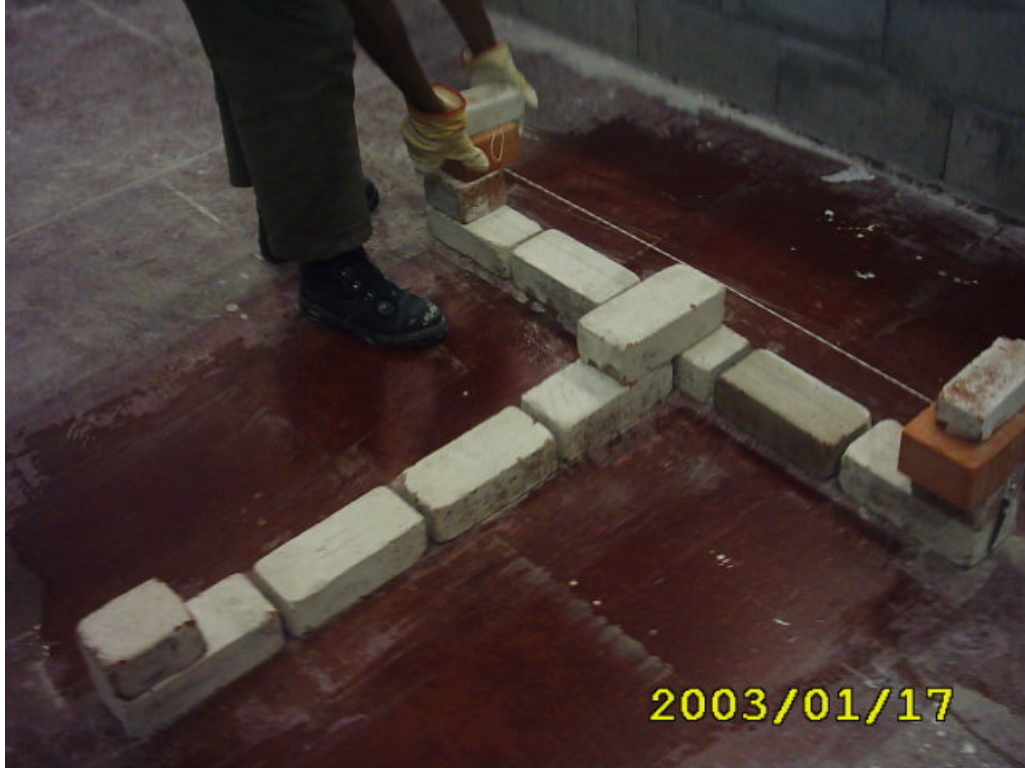
كيفية عمل التروسية وشد الخيوط مع بناء المدماك الثاني

(5) يتم بناء المدماك الثاني بعمل الترويسة للضلع الرئيس مع شد الخيوط ثم تكمل البناء ثم وضع الترويسة للحائط الفرعي مع شد الخيوط ثم تكملة باقي المدماك كما في الشكل