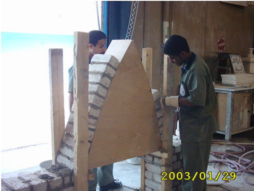
بداية بناء المدماك