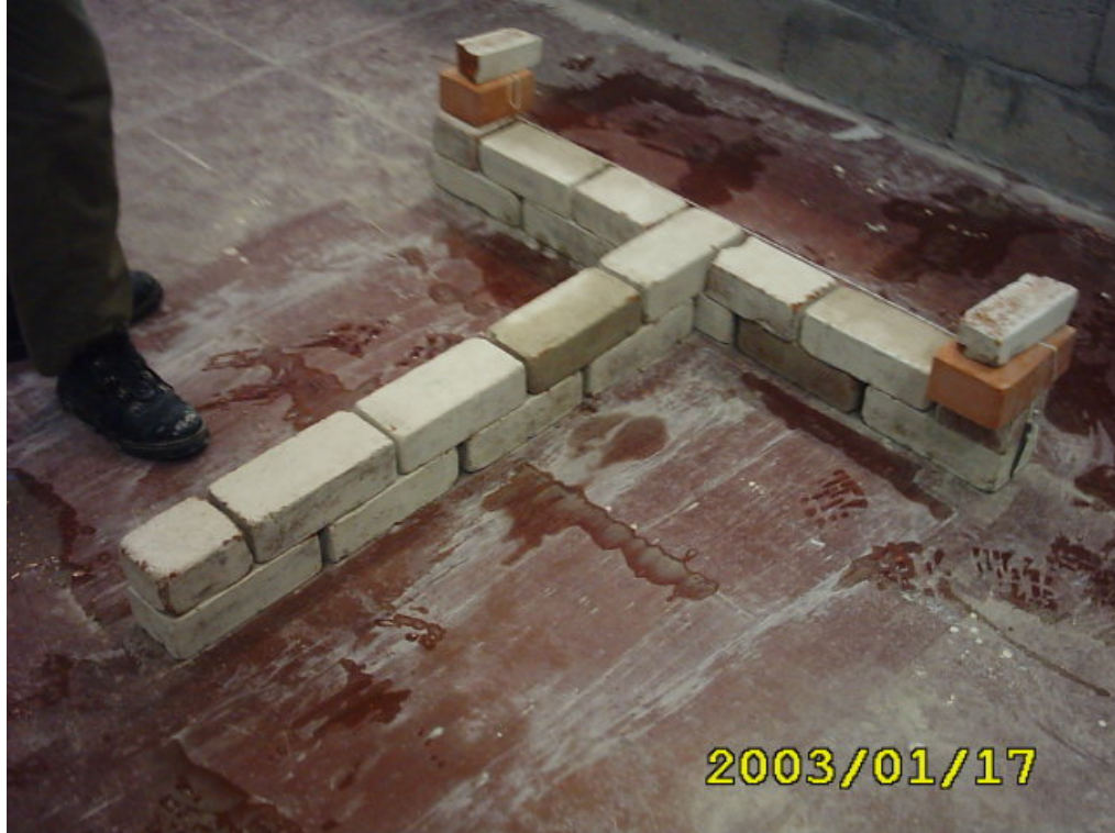
بناء المدماك الثاني