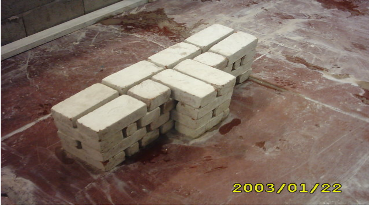
الواجهة النهائية للتمرين