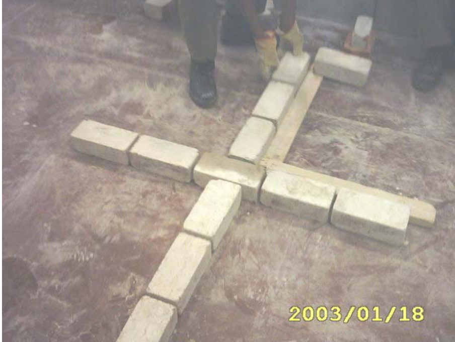
بناء المدماك الأول باستخدام القدة الزاوية الخشبية

(3) البدء في عمل المدماك الأول من محاذاة القدة (الأساسي) والمقاطع معه بمساعدة الزاوية الخشبية القائمة كما في الشكل