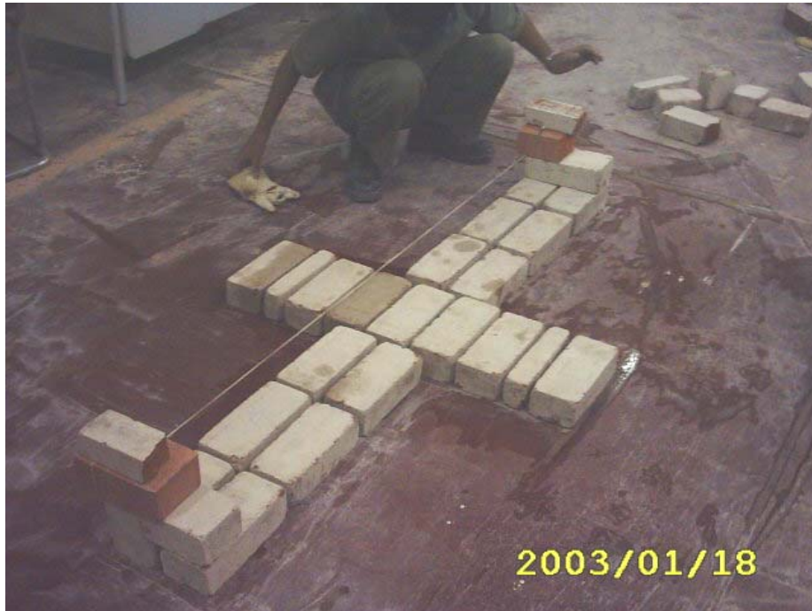
كيفية شد الخيط للمدماك الثاني بوضع الترويسة

3) تم بناء المدماك الثاني بعمل الترويسة لكل ضلع فتوضع ترويسة المدماك الثاني الرئيس (أساسي) ثم توضع ترويسة المدماك الفرعي في بداية ونهاية كل ضلع مع شد الخيط وكل مدماك على حدة كما في الشكل