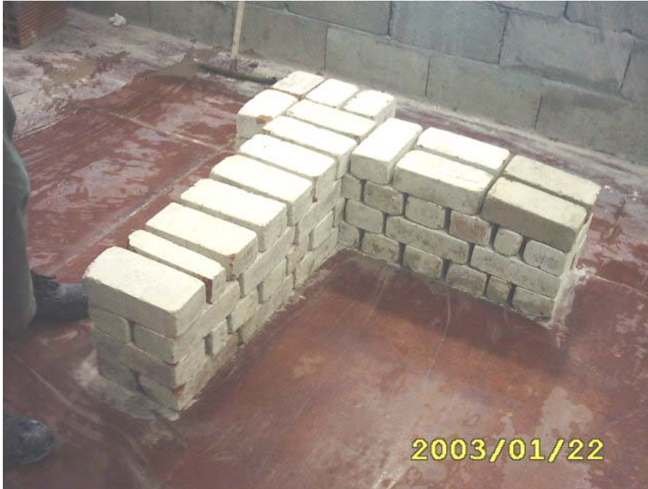
الواجهة النهائية للتمرين