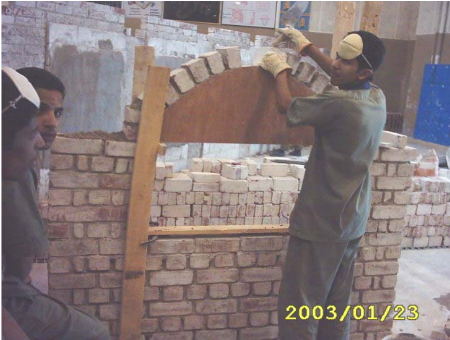
بناء المدماك الأول