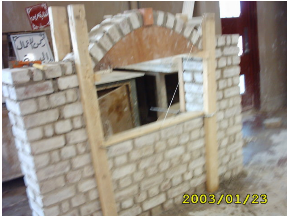
نهاية المدماك الأول

(3) بناء المدماك الثاني بنفس الطريقة الأولى ثم تكمل البناء للكنتين مع العقد كما في الشكل