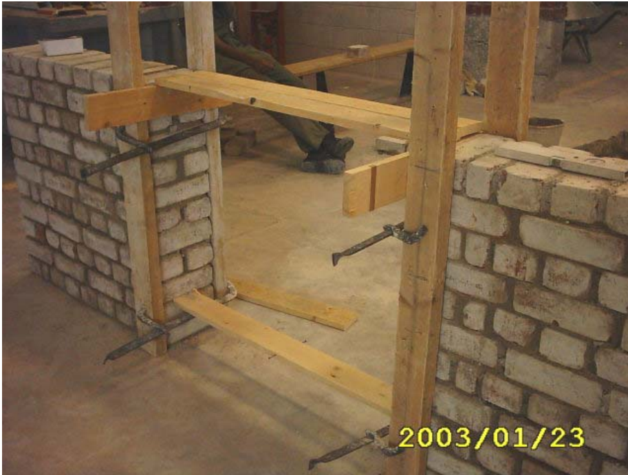
تثبيت العبوه للعقد المستقيم

(2) يتم تثبيت العبوة على الفتحة مع وزنها أفقيا ورأسيا مع وضع خيط بناوي في منتصف بحر العبوة كما في الشكل