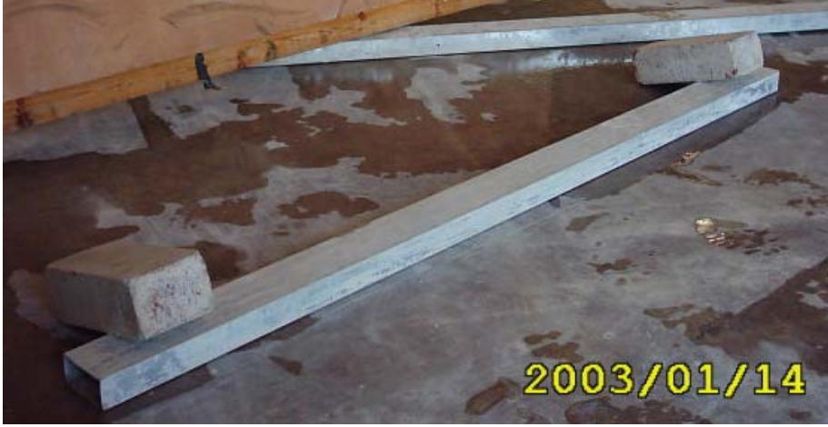
كيفية تثبيت القدة

(1) تثبيت القدة في موقع البناء كما في الشكل