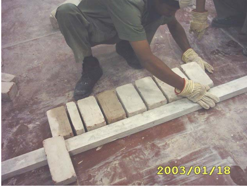
تثبيت القدة والزاوية الخشبية