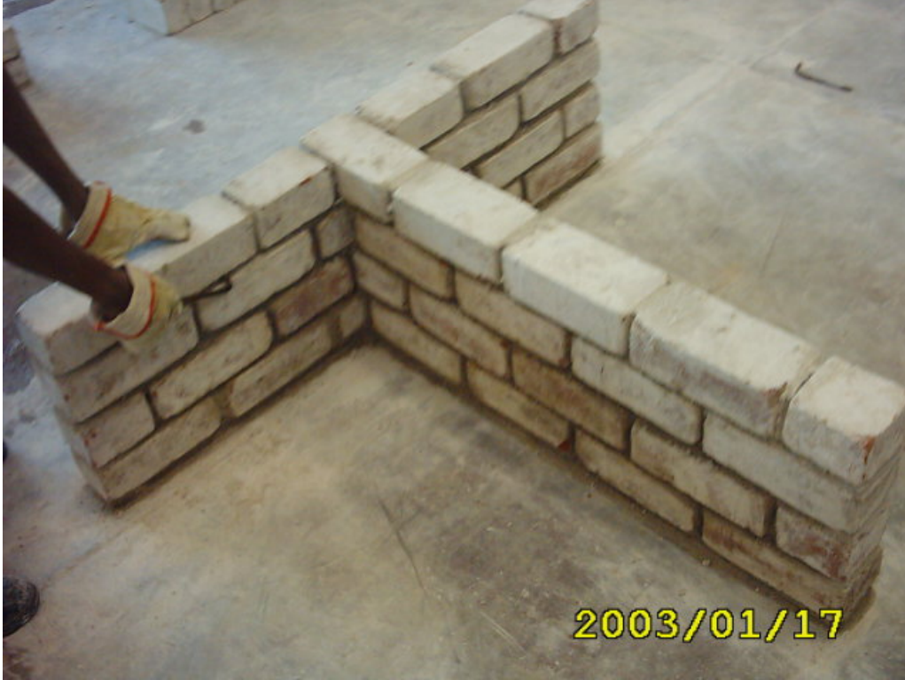
كيفية تفريغ اللحمت

4) يتم بناء المدماك الثالث والرابع وتكون هذا المداميك بنفس خطوات المدماك الثاني وكيفية تفريغ اللحمت كما في الشكل