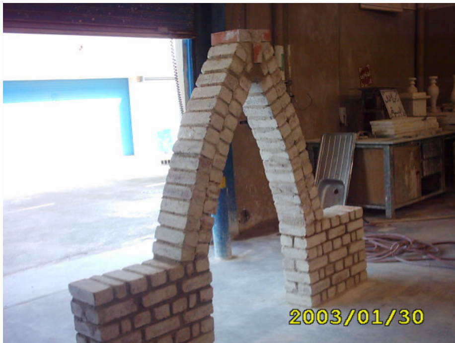
الواجهة النهائية للعقد