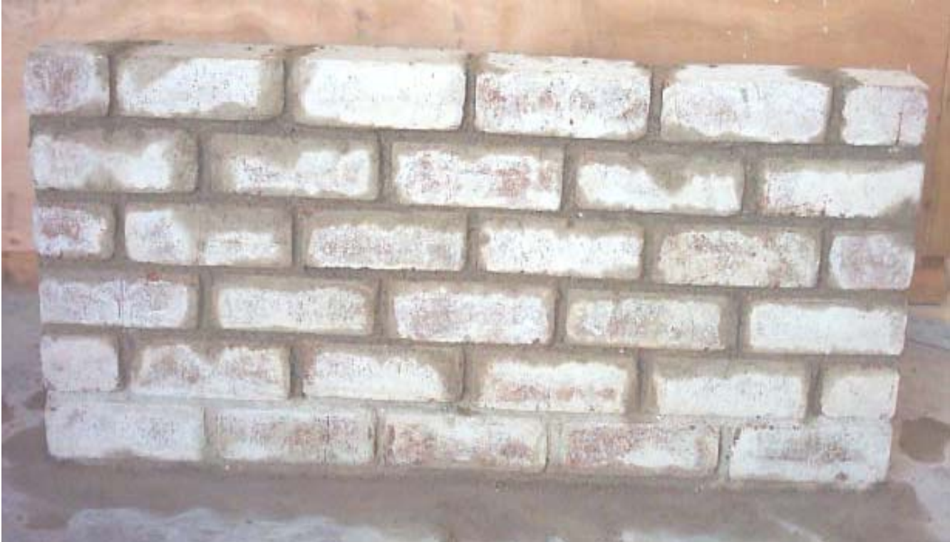
الواجهة لحائط مستقيماً نصف قالب