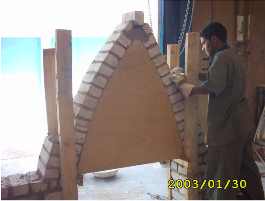
بناء المدماك الأول

(3) بناء المدماك الثاني على المدماك الأول بنفس الطريقة السابقة في بناء المدماك الأول كما في الشكل