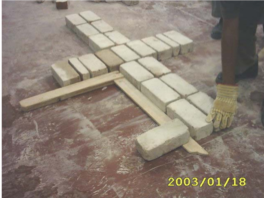
بناء المدماك الأول

3) تم بناء المدماك الثاني بعمل الترويسة لكل ضلع فتوضع ترويسة المدماك الثاني الرئيس (أساسي) ثم توضع ترويسة المدماك الفرعي في بداية ونهاية كل ضلع مع شد الخيط وكل مدماك على حدة كما في الشكل