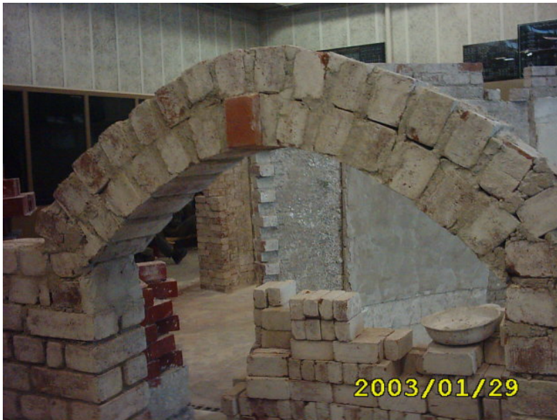
الواجهة النهائية للعقد