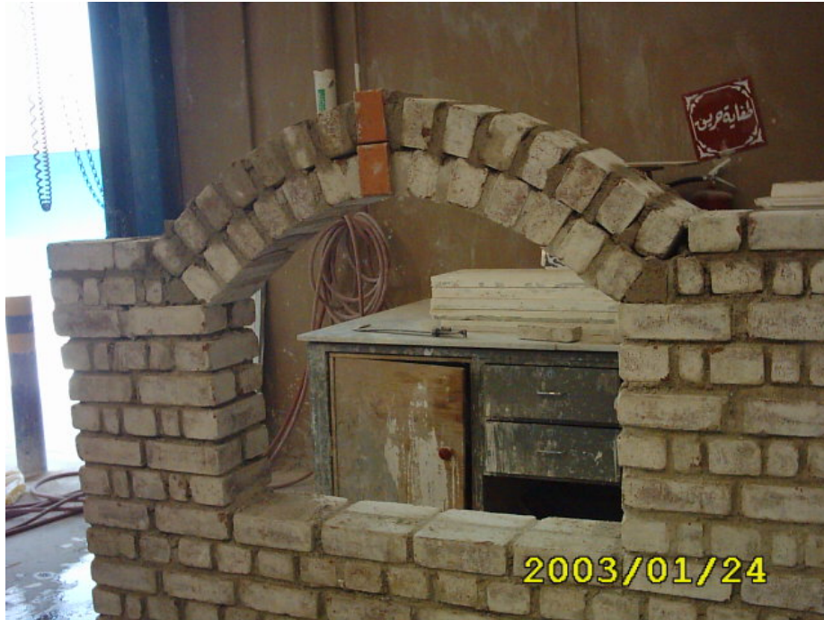
الصورة النهائية للعقد

(4) فك العبوة مع نظافة الموقع بعد تفريغ اللحامات مع نظافة العدد وحرص الخامات في مواقعها