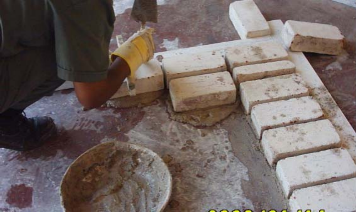
بناء المدماك الأول

(2) البدء في عمل المدماك الأول من جهة واحدة كما في الشكل