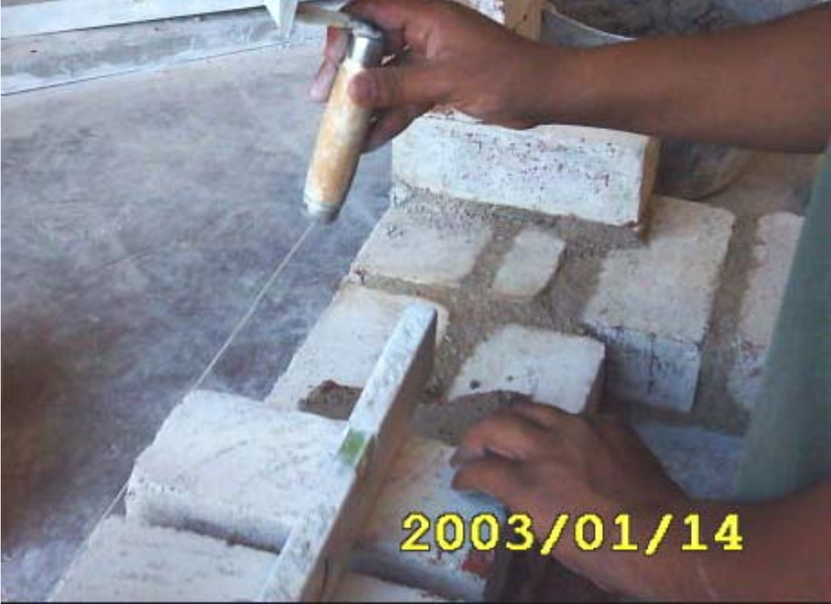
بداية بناء المدماك الثاني

(3) يتم بناء المدماك الثاني بعمل الترويسة لكل ضلع فتوضع ترويسة المدماك الثاني الرئيس (أساسي) ثم توضع ترويسة المدماك الفرعي وتكون ترويسة الزاوية مشتركة بين الأساسي والفرعي ثم يشد الخيط كل ضلع على حدة كما في الشكل