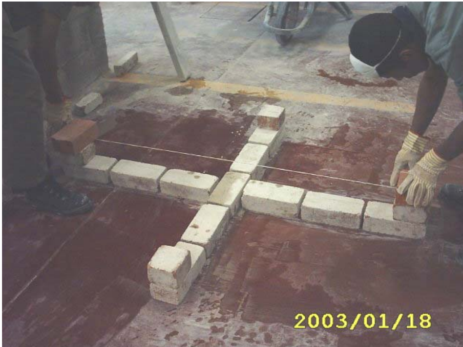
كيفية شد الخيط في المدماك الثاني

(4) يتم بناء المدماك الثاني بعمل الترويسة لكل ضلع فتوضع ترويسة المدماك الثاني الرئيس (أساسي) ثم توضع ترويسة المدماك الفرعي في بداية ونهاية كل ضلع مع شد الخيط وكل مدماك على حدة كما في الشكل