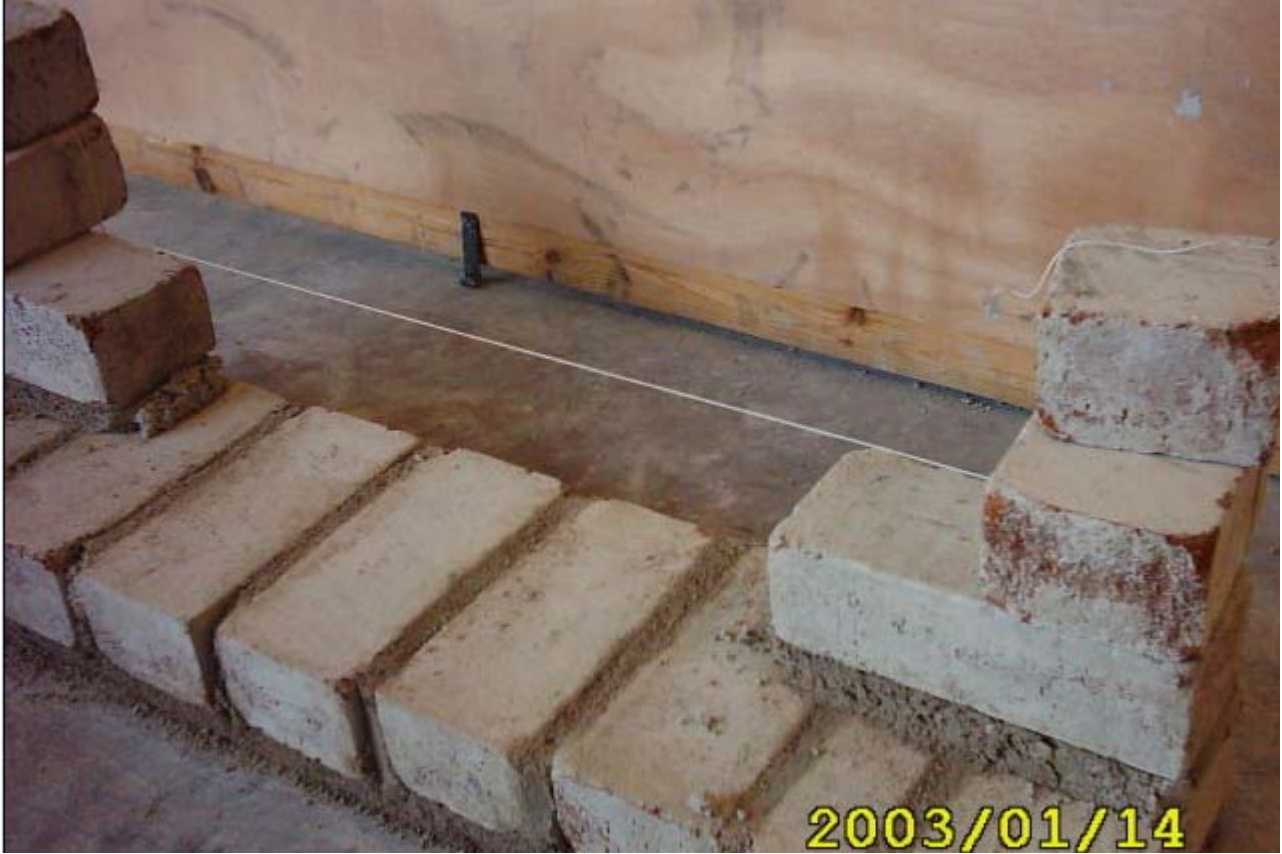
ترويسة المدماك الثاني

(3) يتم بناء المدماك الثاني بعمل الترويسة في بداية المدماك الثاني ثم نضع الخيط البناوي بين الترويستين كما في الشكل