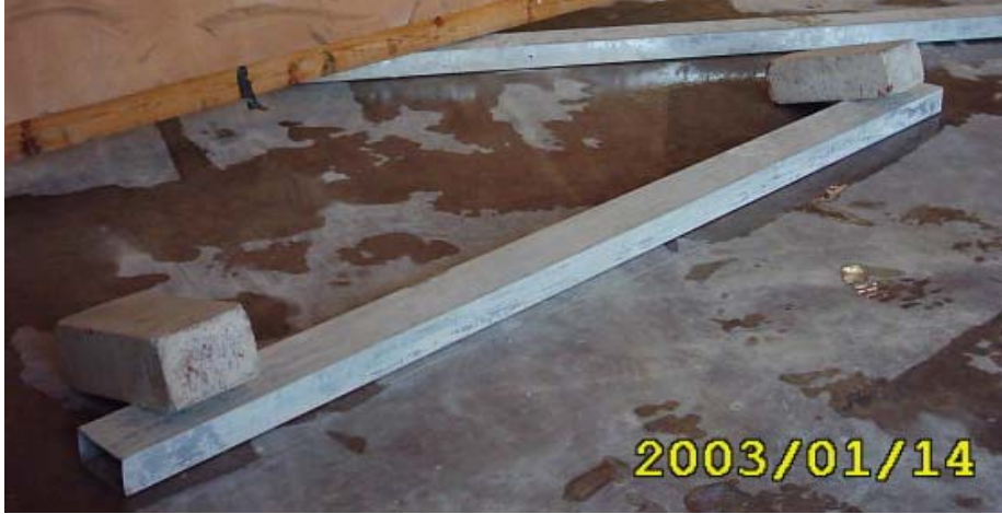
طريقة تثبيت القدة

(1) تثبيت القدة في موقع البناء كما في الشكل