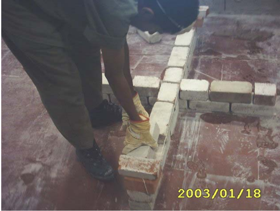
تكملة بناء المدماك الثاني