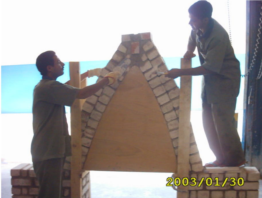
بناء المدماك الثاني

(3) بناء المدماك الثاني على المدماك الأول بنفس الطريقة السابقة في بناء المدماك الأول كما في الشكل