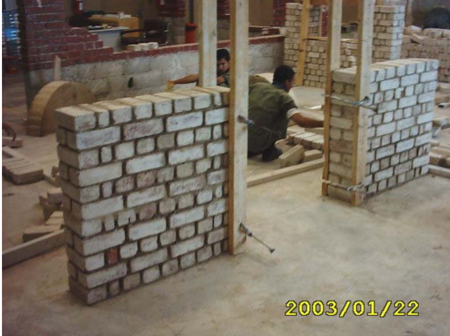
بناء الأكتاف الخاصه بالعقد

(1) يتم بناء الأكتاف الخاصة بالعقود سواء كانت فتحات أبواب أو شبايك كما في الشكل