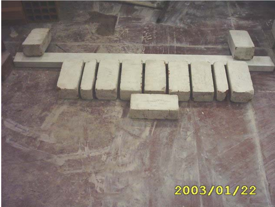
بناء المدماك الأول

(2) بناء المدماك الأول وضبطة أفقيا بالقدة مع ضبط الفص كما في الشكل