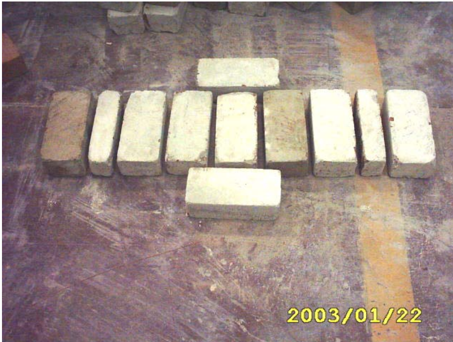
بناء المدماك الأول

(2) بناء المدماك الأول وضبطة أفقيا بالقدة مع ضبط الفص كما في الشكل