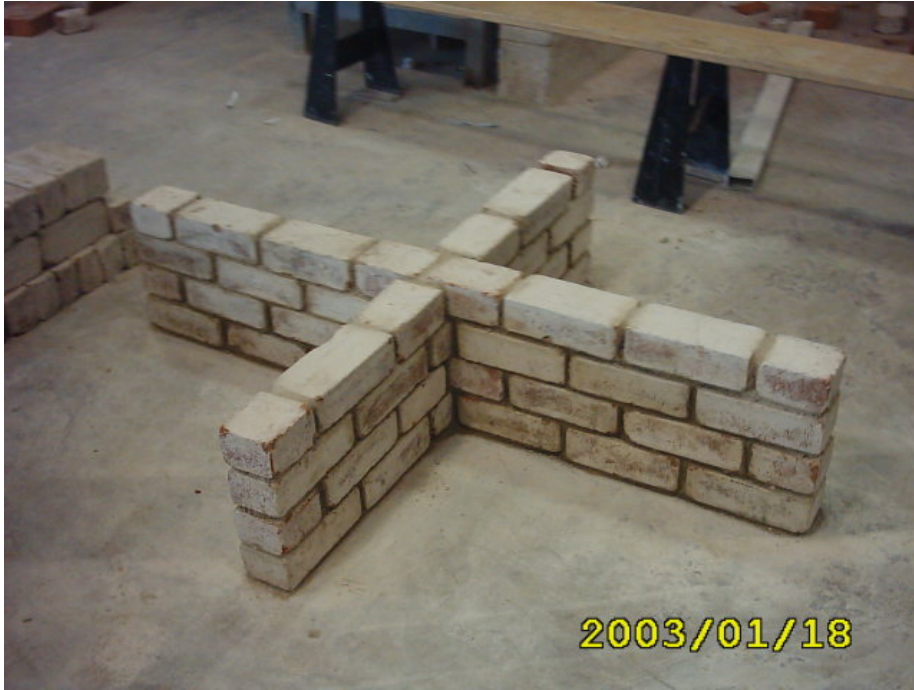
الواجهة النهائية للتمرين