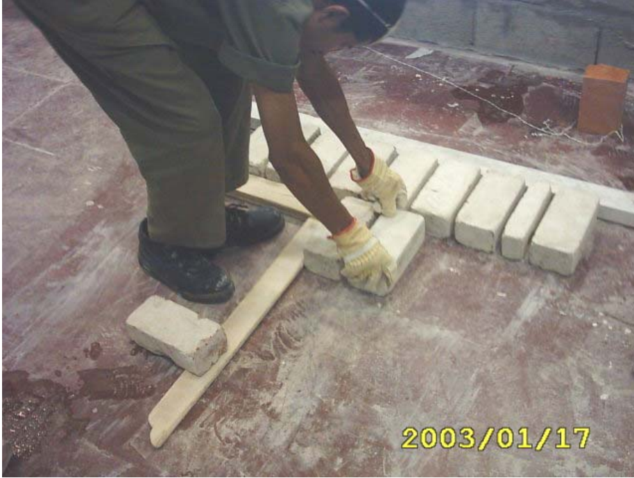
كيفية بناء المدماك الأول

خطوات تنفيذ هذا التمرين (بناء حائط متعامد على هيئة حرف (T) سمك قالب) وضع القدة مع الزاوية القائمة لتحديد الضلع الفرعي أو وضع خيط على الأرض مع تثبيت الزاوية مع المدماك الأول كما في الشكل