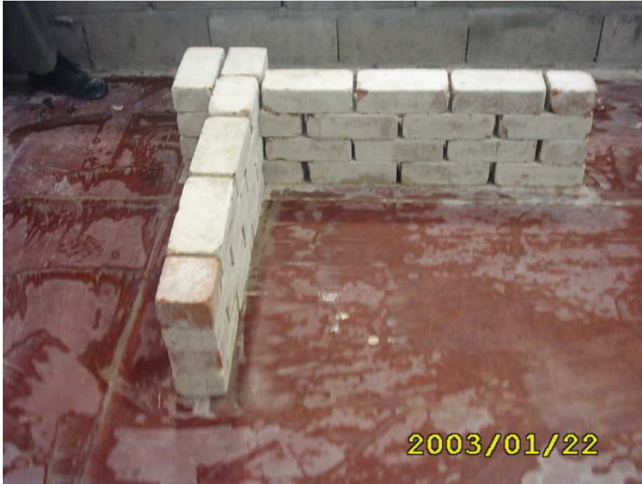
الواجهة النهائية للتمرين