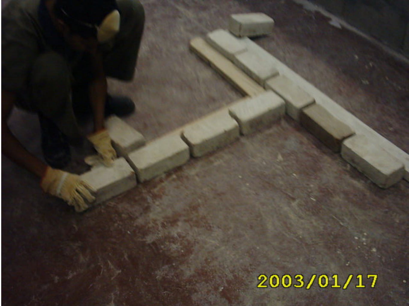
بناء المدماك الأول

(4) البدء في عمل المدماك الأول من جهة واحدة كما في الشكل