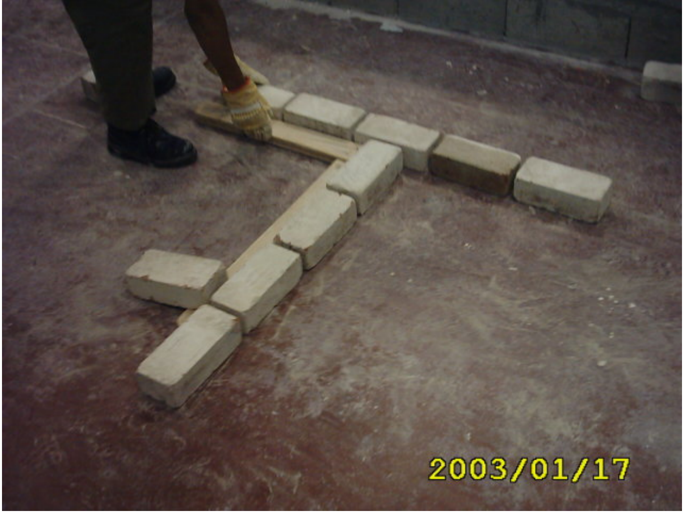
إنهاء المدماك الأول