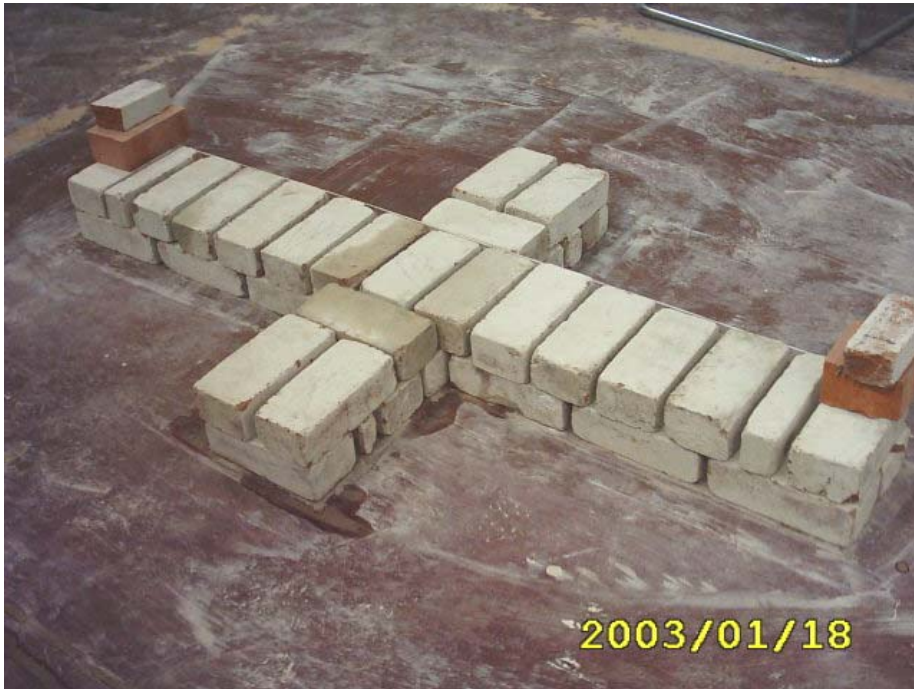
تكملة بناء المدماك الثاني