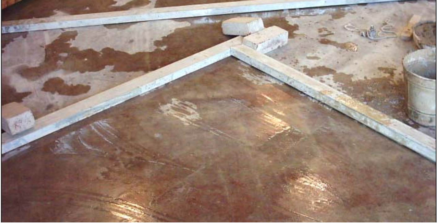
طريقة وضع القده