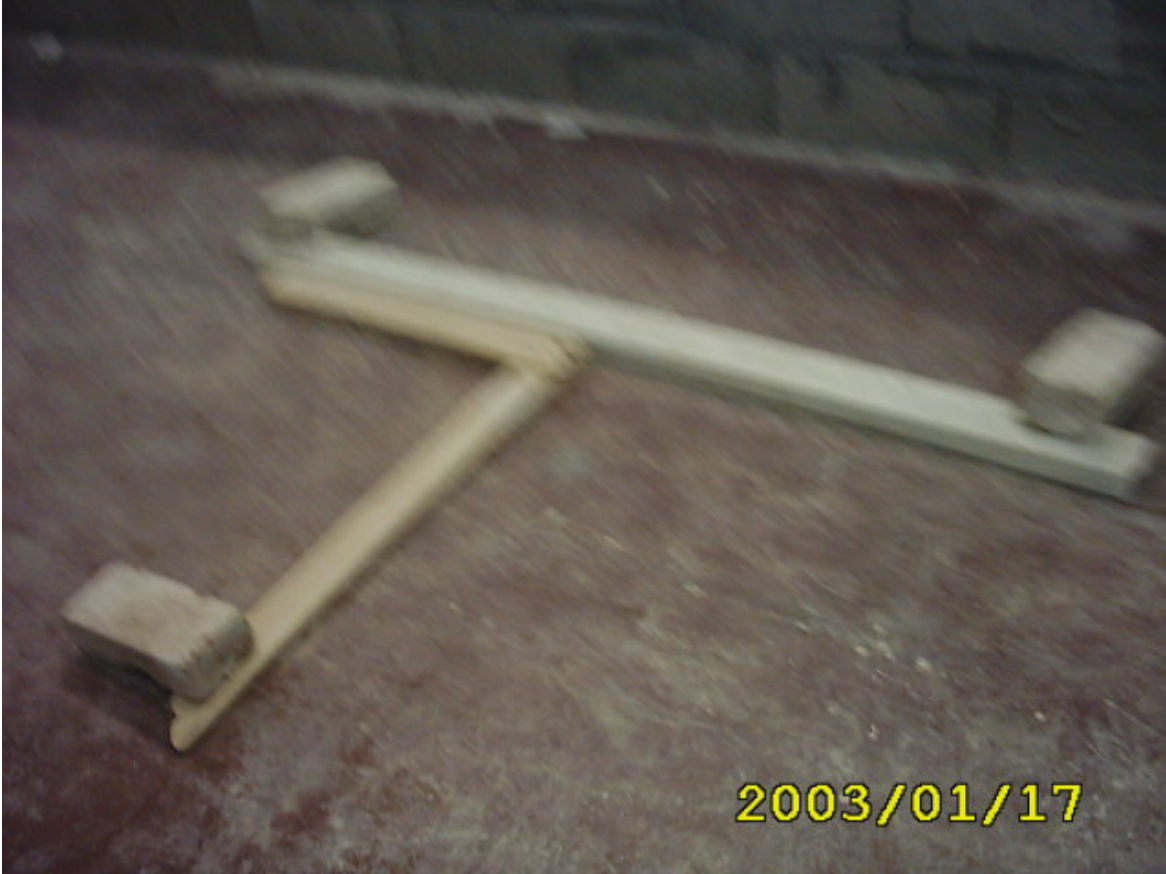
كيفية وضع القدة

وضع القدة في موقع العمل مع التشبيث ووضع خط مستقيماً أو خيط (ضبط الشد) في موقع ثم وضع الزاوية القائمة بموقع الحائط الفرعي كما في الشكل