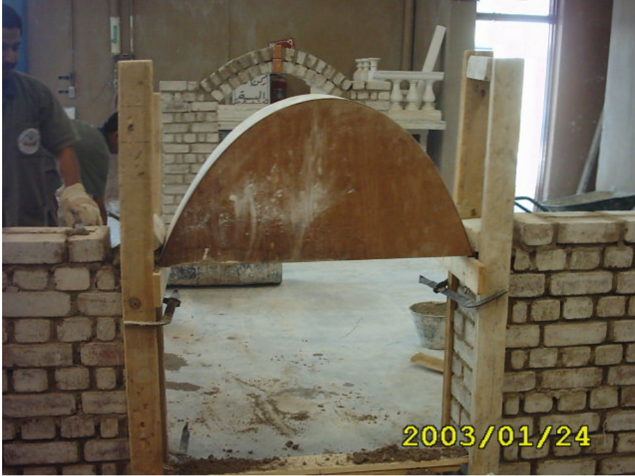
تثبيت العبوة على الأكتاف

(1) تجهيز العبوة وتركيبها في المكان المطلوب على الأكتاف الخاصة بالعقد كما في الشكل