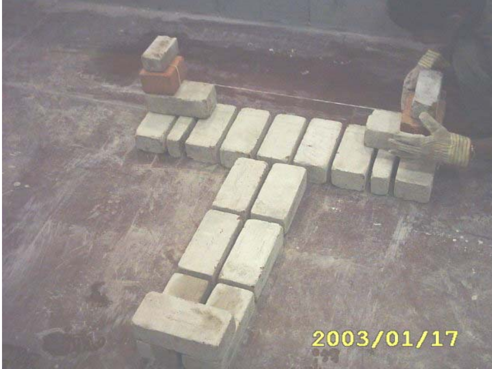
كيفية عمل الترويسة

2) يتم بناء المدماك الثاني بعمل الترويسة في الضلع الأساسي والضلع الفرعي مع شد الخيط بينهما كما في الشكل