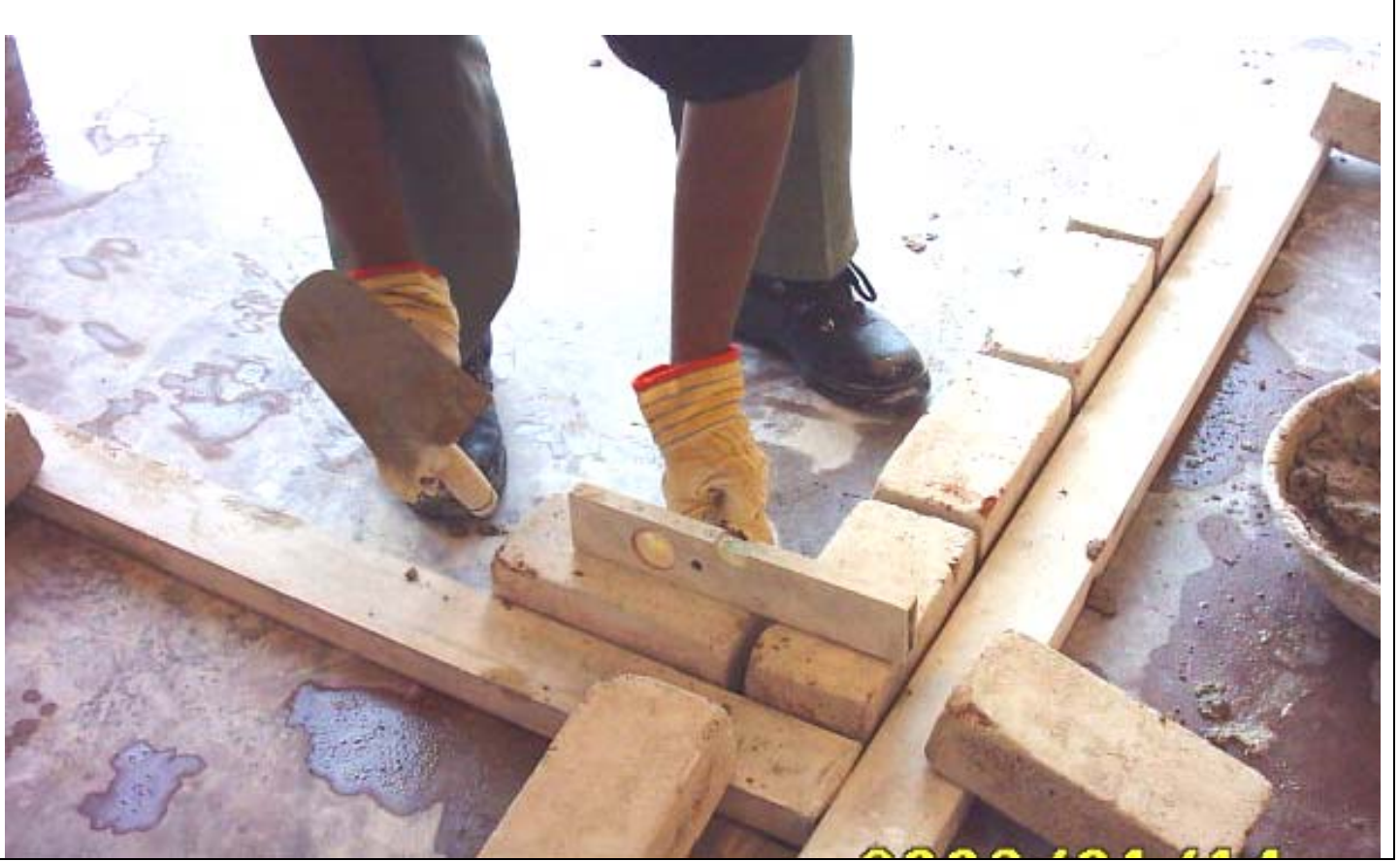
بناء المدماك الأول

(2) البدء في عمل المدماك الأول من جهة واحدة كما في الشكل