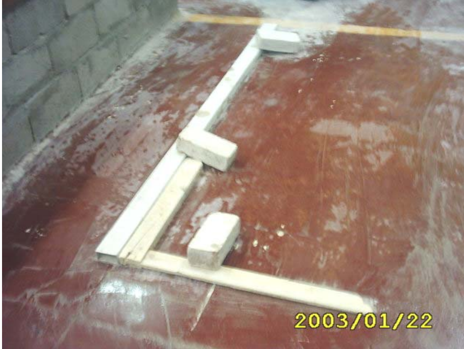
كيفية تثبيت القدة

1 - تثبيت القدة مع الزاوية القائمة في موقع البناء كما في الشكل