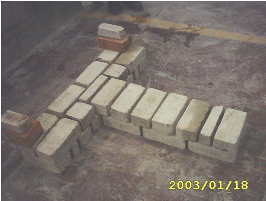
بناء المدماك الثاني