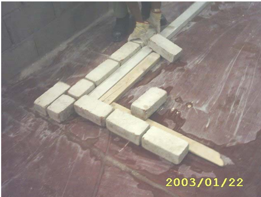
بداية المدماك الأول