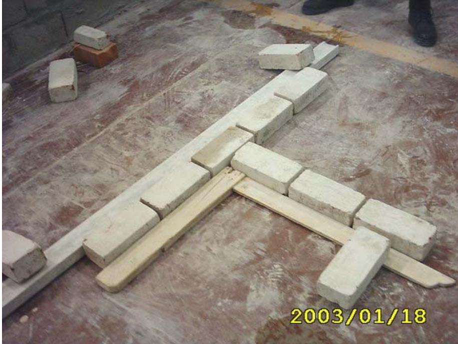
كيفية تثبيت القدة مع الزاوية