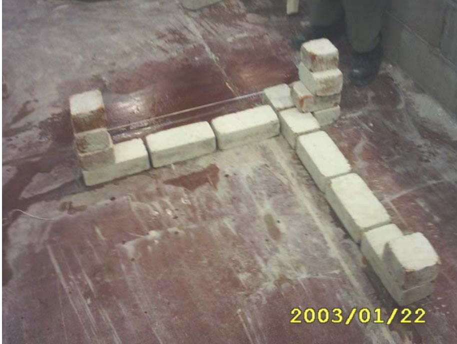
كيفية عمل الترويسة