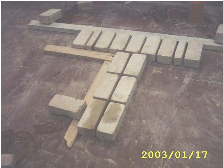
بناء المدماك الأول