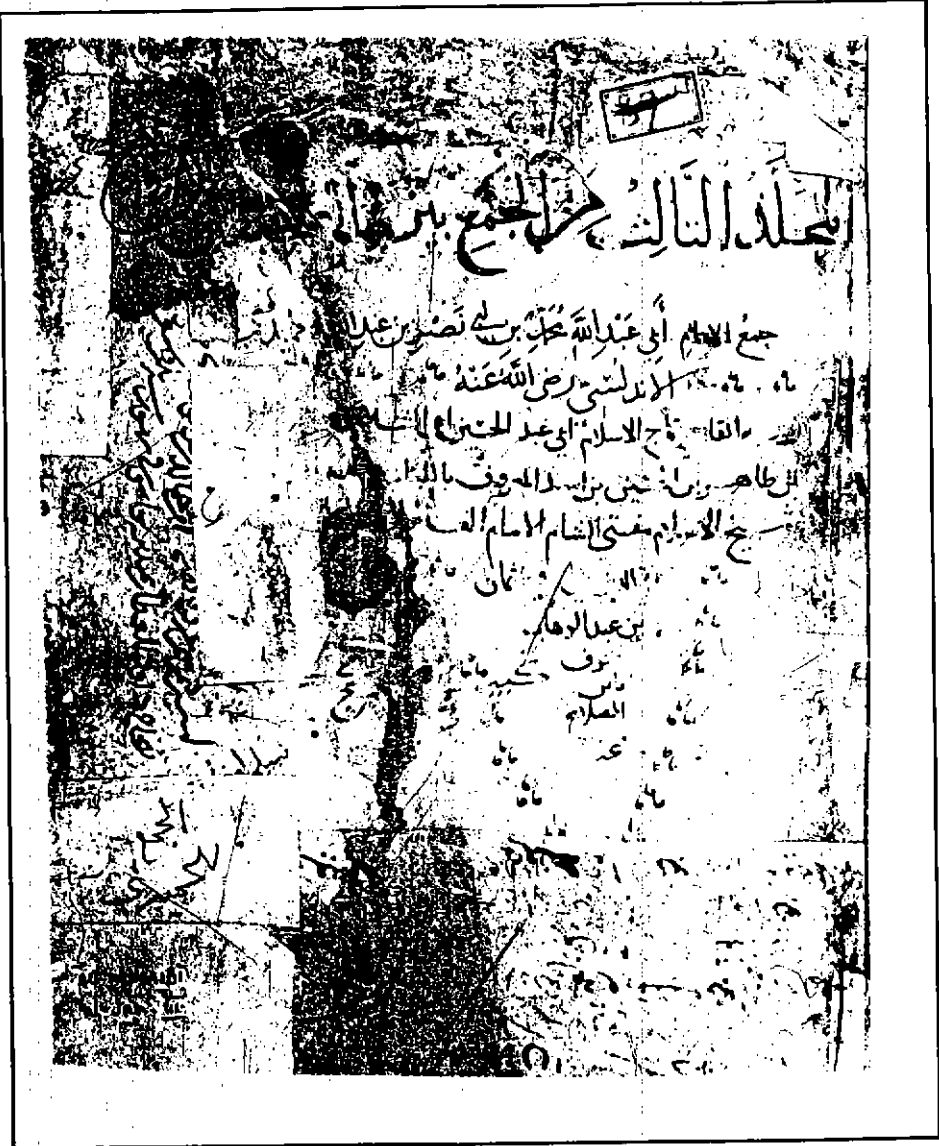
عنوان الكتاب النسخة (ي)