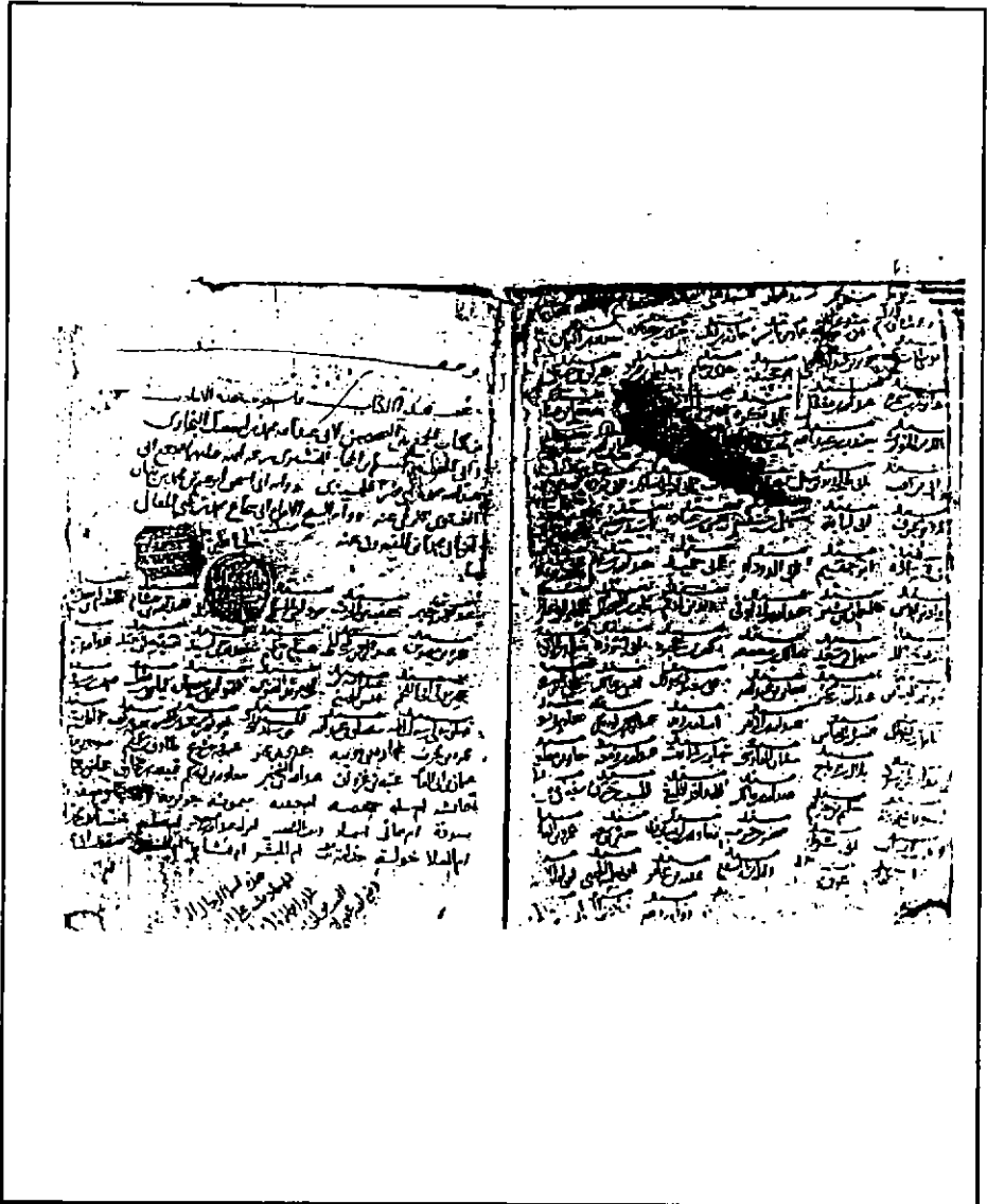
العنوان والكشاف (ر)