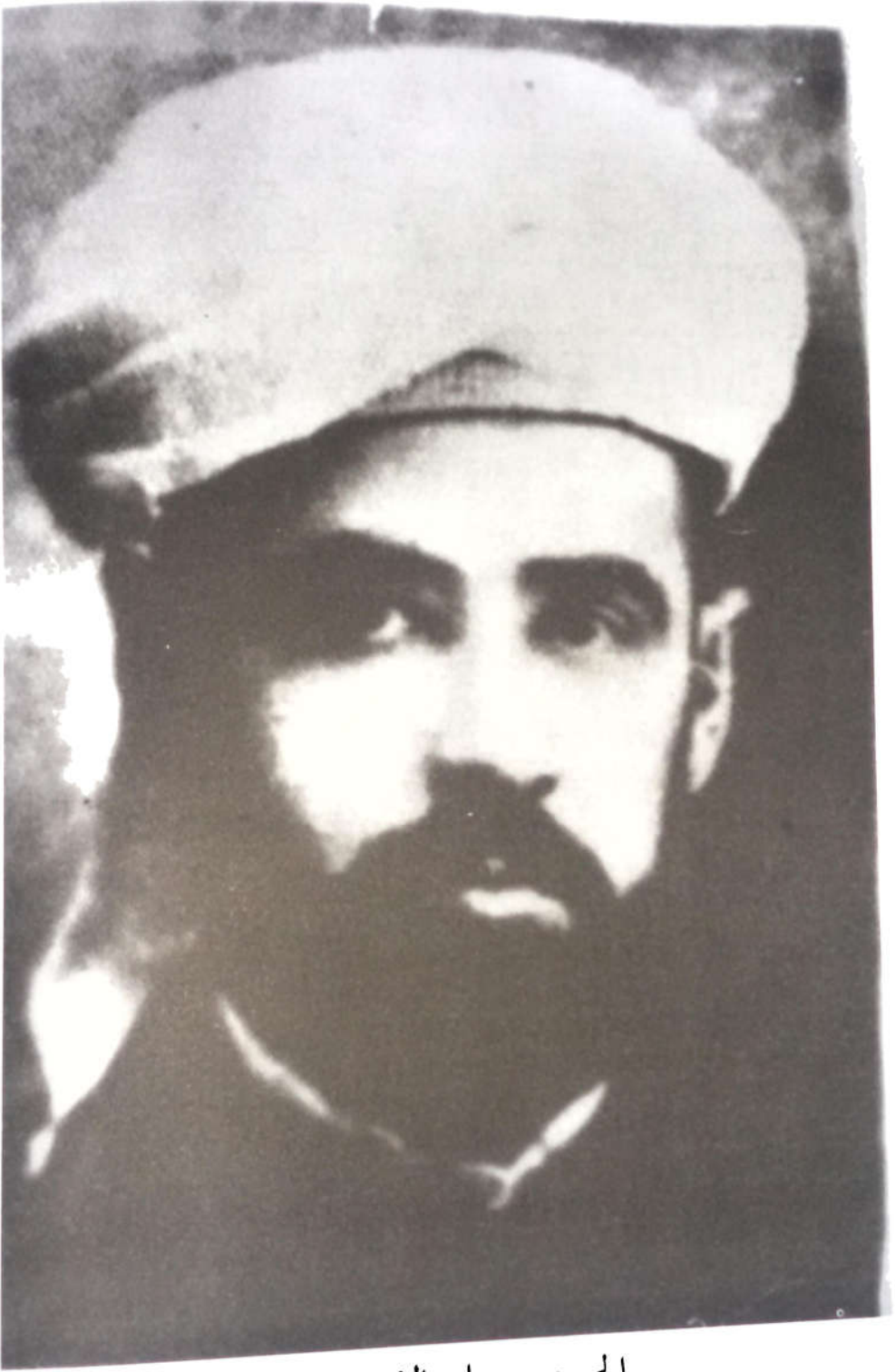
الحسن بن علي الإدريسي