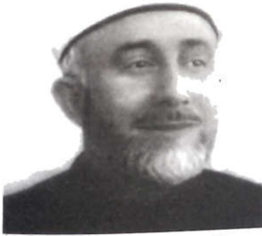
أحمد أمين الحسيني

الأمير بالصالحية وبقي سبعة أيام، ثم أرسل إلى القنصل الإنكليزي وطلب منه الفسح لزيارة القدس الشريف فأجاب طلبه، وخرج السيّد من دمشق متوجّهاً إلى بيروت قياماً بوعده الذي أعطاه لأهلها بالقدوم إليها، فلما وصل إلى بيروت وجد في استقباله أمة عظيمة، وأسرع الناس من كلّ جهة للسلام عليه وأقفلوا مخازنهم، ونزل عند الشيخ الهبري وبقي أربعة أيام، ثمّ توجه قاصداً فلسطين بالسيّارات، فكان أهل القرى التي يمرّ بها يجتمعون محتفلين بقدومه، وما زال هكذا حتّى وصل إلى عكّة وقت المغرب، فوجد عددًا لا يحصى من الأهالي في انتظاره، وبات تلك الليلة في عكّة، وفي الصباح خرج متوجّهاً إلى القدس. وكان الحاج أمين الحسيني، مفتي القدس، ورئيس المجلس الإسلامي الأعلى وعدد كبير من وجوه القدس قد خرجوا لاستقباله وتلاقوا معه في الطريق، ولما وصل إلى القدس نزل في بيت الحاج أمين الحسيني وبات تلك الليلة، وفي الصباح زار المسجد الأقصى والصخرة الشريفة وأغلب مقامات الأنبياء عليهم السلام، كما أنه زار بعض المدارس والتكايا وبعض الكنائس، ثمّ توجه لزيارة الخليل، على نبينا وعليه أفضل