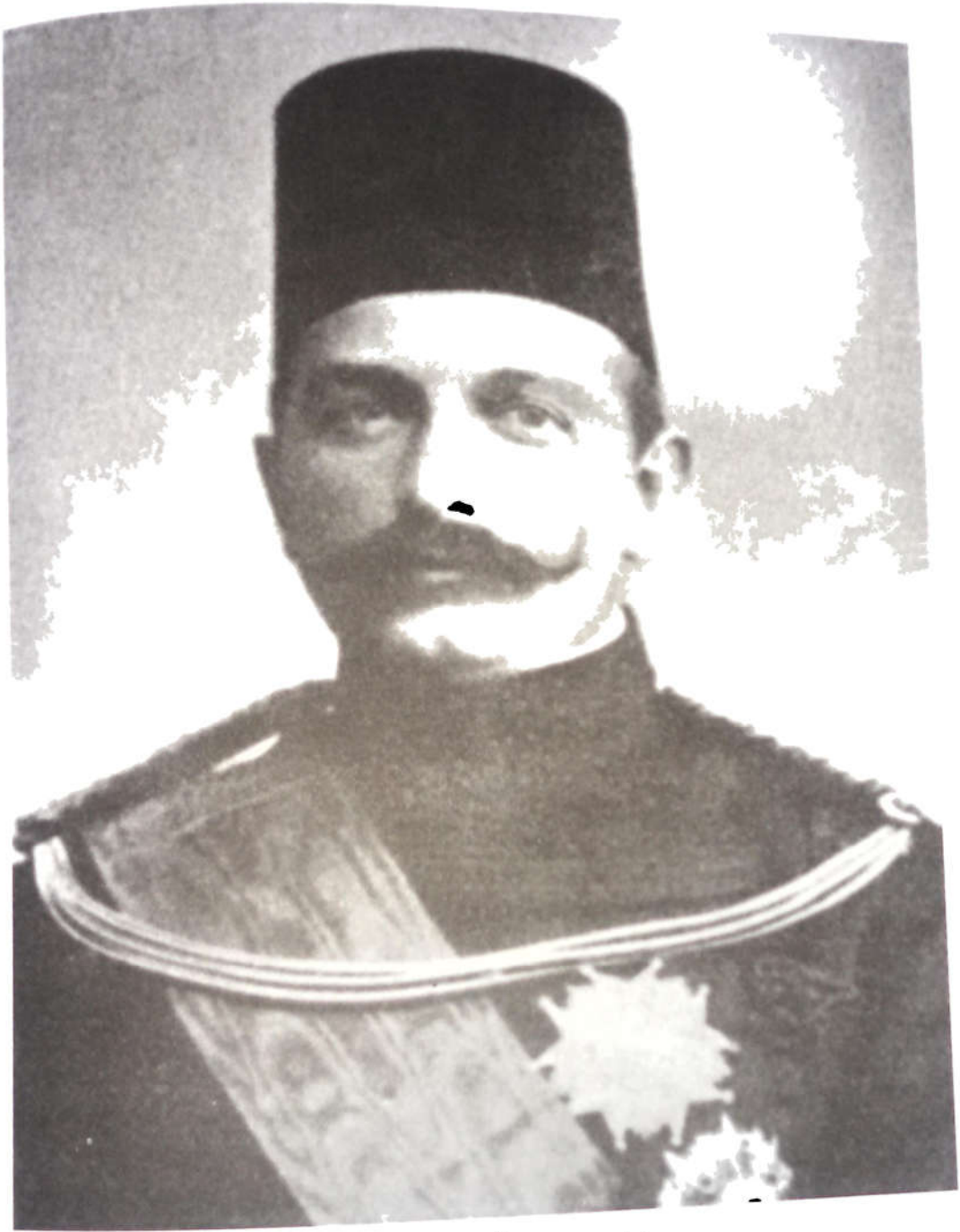
الخديوي عباس حلمي