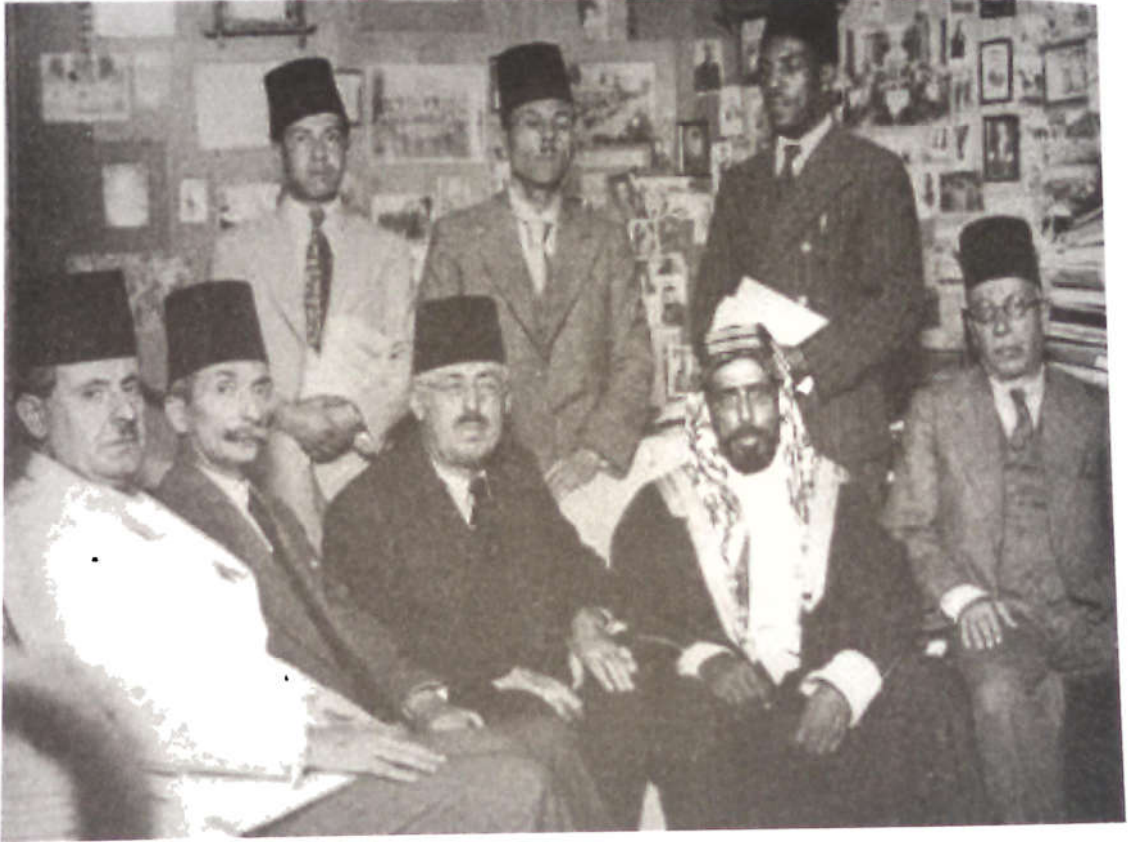
الأمير شكيب أرسلان والملك عبد العزيز