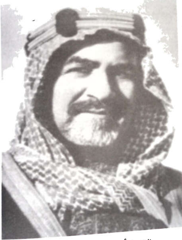
الشيخ أحمد الجابر الصباح

ثمّ بعد هذه المدّة، استأذن السيّد في الرجوع إلى مكّة فأذن له الملك، ونزل هذه المرّة في بيت من بيوت الشريف علي باشا أمير مكّة سابقًا، وبقي إلى أن آن وقت الحجّ، فأدى الفريضة. وبعد الحجّ أقام بمكّة بقيّة ذي الحجّة وشهر محرّم فاتح سنة ١٣٤٤.