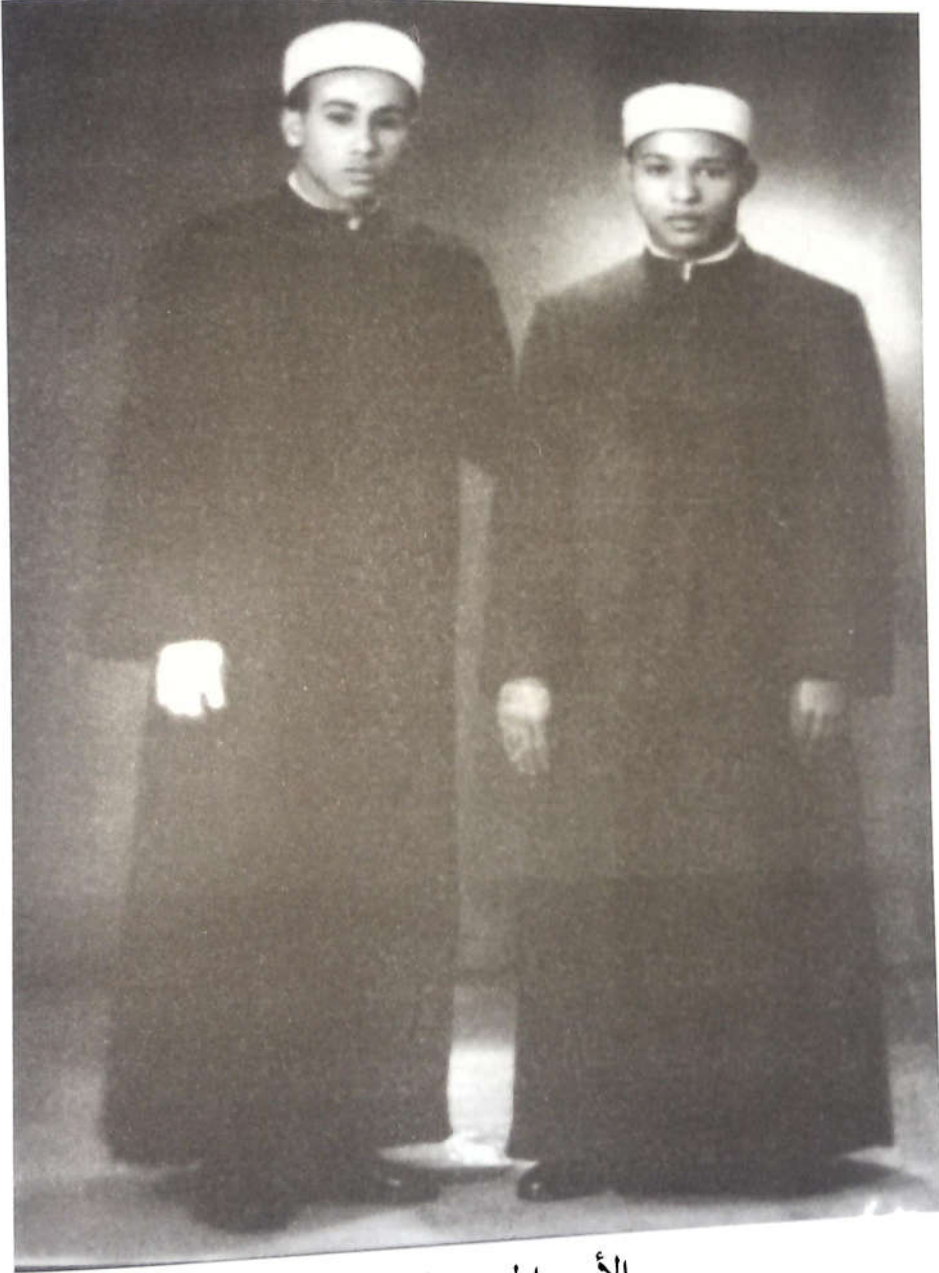
الأمير الحسن الرضا

المنفيين، ويسكن الأمور وما قصر في الجهد، إلا أن القبائل أفرطت في التعصب وصار يناظر بعضها بعضاً، وكل فريق يتعصب إلى جهة، فاضطرّ أخيراً إلى طلب الدخول في طاعة جلالة الملك عبد العزيز، وهكذا استراح هو واستراحت معه البلاد ولزمت القبائل السكون.