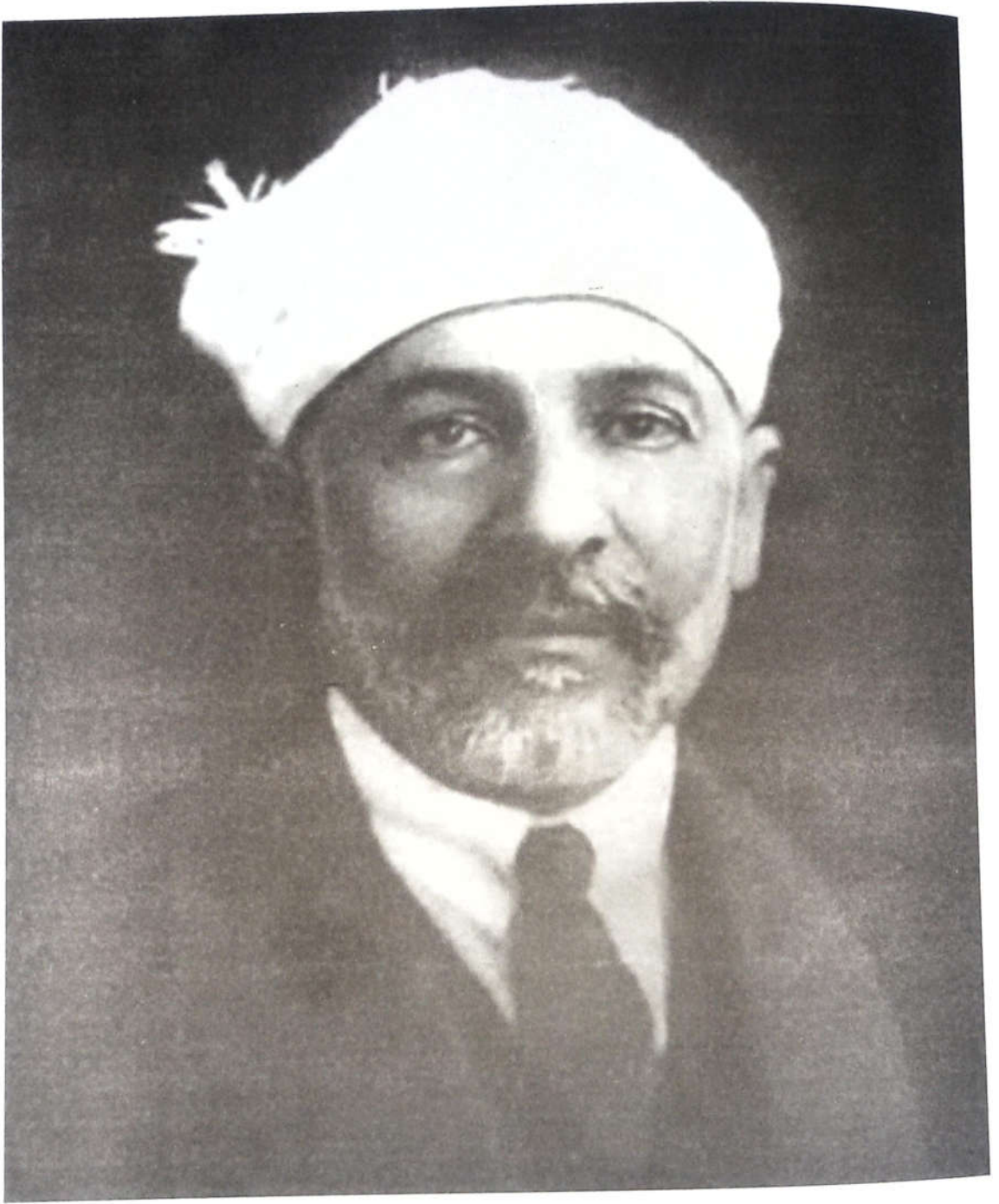
الشيخ عبد العزيز جاویش