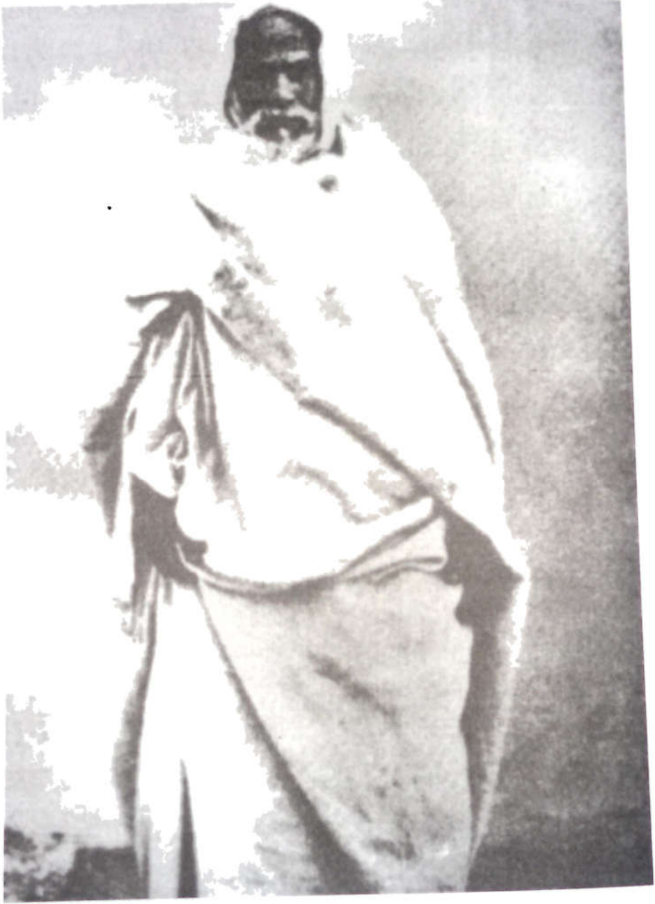
شيخ الثائرين عمر المختار

الكيلاني بن حدوت، شيخ مشايخ قبيلة البراعصة المشهورة، وصالح بن الشيخ محمد العبيدي، من قبيلة العبيد التي كانت اليد اليمنى للمجاهد الكبير الشهير سيدي عمر المختار وخادمه الأمين اسحق بن إدريس.