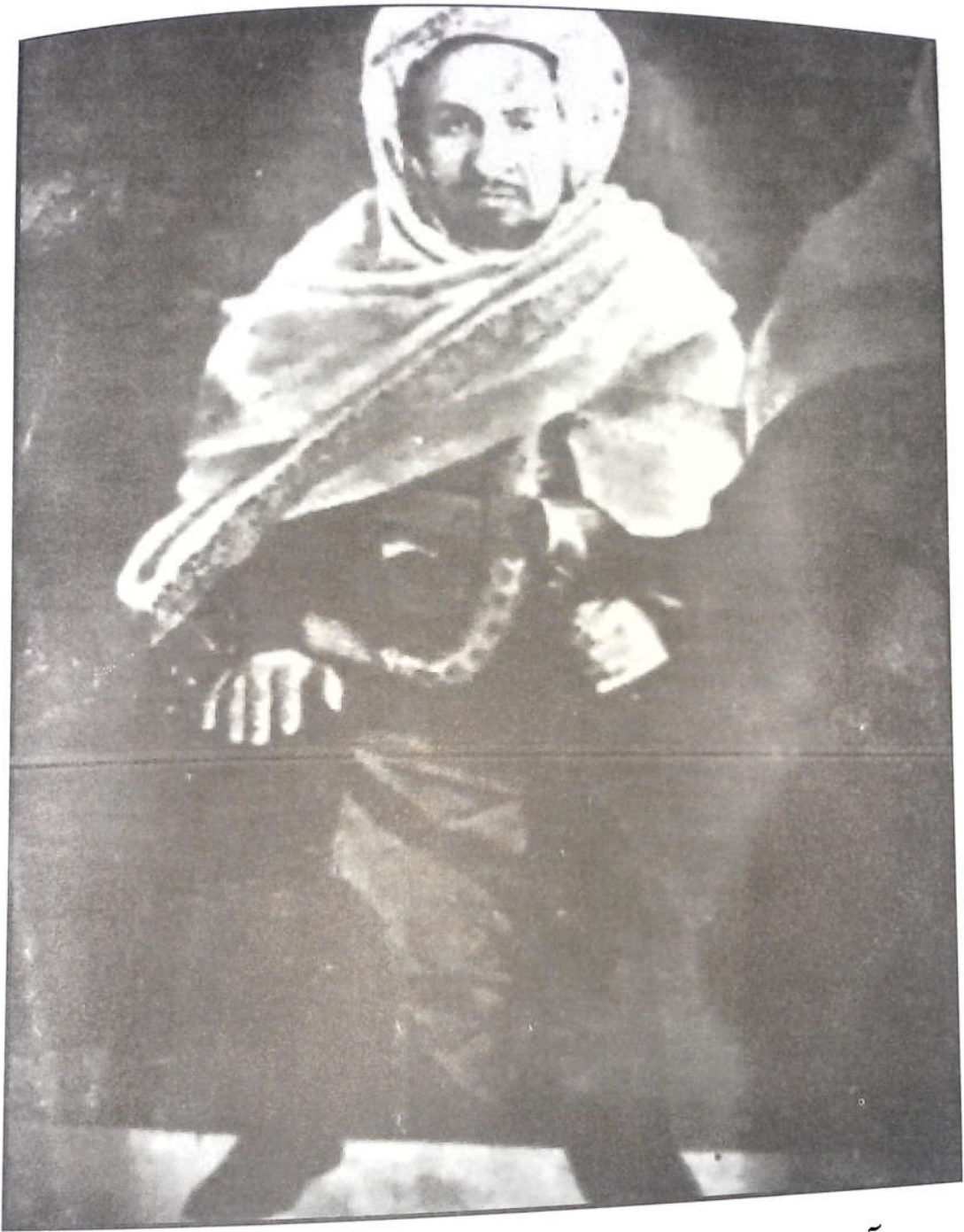
آخر صورة التقطت للسيد أحمد الشريف السنوسي