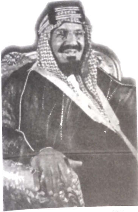
الملك عبد العزيز آل سعود

ثمّ بعد خمسة عشر يوماً رجع النجّاب يحمل كتاباً من الأمير عبد العزيز بن مساعد أمير حائل، وأحد أفراد العائلة السعودية، وهو يرحّب بكتابه بسيادة السيّد ويأذن له في القدوم إليه، ويأمر برجوع الخبّاء والسيّارات إلى دمشق، فرجعت السيّارات بعد اثنين وعشرين يوماً.