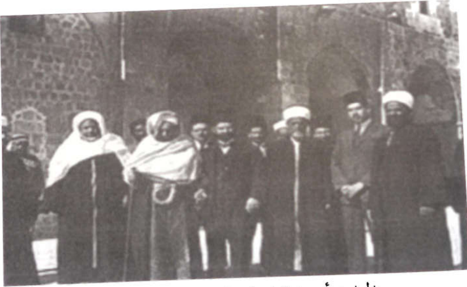
المجاهد أحمد الشريف السنوسي في القدس

وظلّ السيد أحمد الشريف طوال فترة إقامته في الحجاز متفرّغاً لدعم المجاهدين في الداخل، وكان يتّخذ من مواسم الحجّ والعمرة وسيلة للاتّصال بالليبيين، ويستقبل الرسل الوافدة إلى مكّة من قادة الجهاد، يزوّدهم بالتوجيهات والتعليمات، وكذلك بالإمدادات، كما جعل من مواسم الحجّ منبراً إعلامياً يحثّ المسلمين منه على دعم القضية الليبية ويجمع التبرّعات منهم.