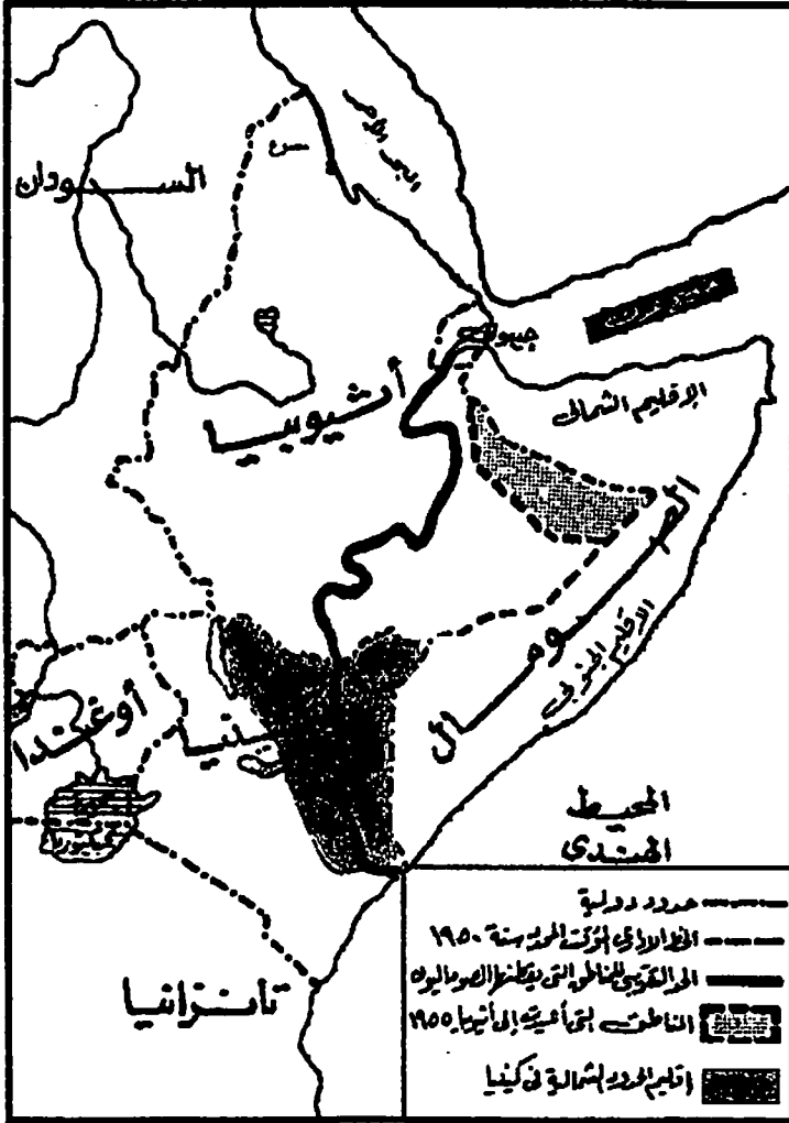
خريطة توضح المناطق التي يسكنها الصوماليون والمناطق التي استولت عليها أثيوبيا عام ١٩٥٥، وكذا المناطق التي ضمتها بريطانيا لكينيا في عام ١٩٦٣