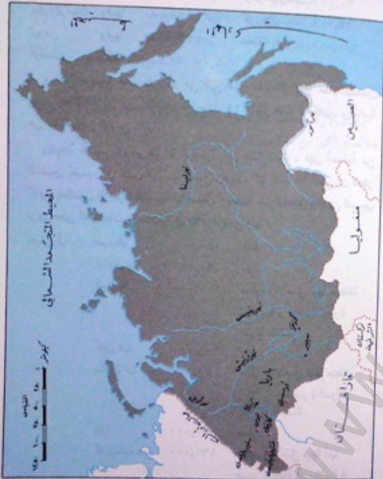
المخطط التجمعات الشمالي

وإذا كانت أكثر التجمعات الإسلامية تتجمع وترتكز في الجنوب الغربي من سيبيريا إلا أنه لا تخلو منها مدينة ولا تفتقدها تلك المجاهل، بل إن المجاهل قد تكون مقتصرة على المسلمين الذين يقضون عقوبات فرضها عليهم الروس، وهناك يعيشون في شبه خلوة بعيدين عن أعين السلطة الشيوعية المستعمرة فيؤدون عبادتهم ويعودون - إن قدر الله لهم العودة - إلى أماكنهم وقد ازدادوا حاسة لدينهم ورغبة في الدعوة إليه بعد أن استهانوا النفي وعاشوا في المجاهل يقومون بالأشغال الشاقة.