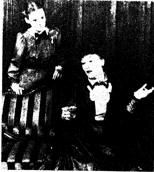
شكل رقم ١

الطابع الإسقاطي. افترض موراي أن المفحوص لا يكون عادة واعياً بحاجاته، وأن أية أداة تكشف عن فكره اللاشعوري سوف تمدنا بفهم أفضل من الاختبارات التي تعتمد على ما يورده الفرد عن نفسه. وشعر موراي أن الخيال يمدنا بهذه الوسيلة للحصول على الدوافع اللاشعورية، ووضع مجموعة من الأساليب التي يذكر فيها المريض خيالاته عندما يستمع إلى الموسيقى، أو يستكمل قصصاً ناقصة، أو عندما يذكر قصصاً عن بعض الصور. وهذه الأداة الأخيرة التي يذكر فيها المفحوص قصة عن صور أصبحت أكثر الأدوات استخداماً. وتوجد لدينا الآن مجموعة من الصور المقنعة للأغراض الإكلينيكية، وكذلك مجموعات خاصة من الصور لقياس متغيرات معينة للأغراض الإكلينيكية والتجريبية. وفي الشكلين ١، ٢ صورتان من النوع الذي يستخدم في مثل هذه الاختبارات، ولكنها ليستا من بين الصور الموجودة في أي مجموعة مقننة. وفيما يلي نص القصتين اللتين ذكرتهما امرأتان في مقتبل العمر، وهما تصوران مدى ما يكون عليه الاختلاف بين هذه القصص. ويستطيع القارئ أن يستنتج لنفسه ما يتعلق بهاتين امرأتين.