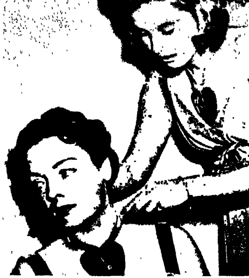
شكل رقم ٢