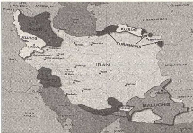
الشكل (1): خارطة إيران وتوزيع الأقاليم المذكورة في الدراسة.

بالنسبة لأهل السنة في المناطق الجنوبية على الساحل الشمالي والشرقي للخليج العربي، وفي جزره المهولة، فإن السائد في تلك المناطق المنهج السلفي وجماعة الدعوة والتبليغ. ويجري العمل الدعوي فيها بواسطة الدعاة والمشايخ الذين يديرون نشاطهم من خلال المدارس الدينية حيث تكمن الزعامة الدينية هناك في مدرسة الشيخ سلطان العلماء، التي مركزها ميناء «لنجة».