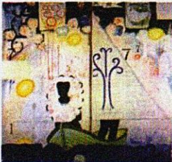
Voyager (voyageur), 1992. Kerry James Marchal Art et Aujour'hui

إنها من سجل السلوكات البشرية المتواترة التي سيرتكب الأمين على مهنة التفكير (المثقف) حماقة كبرى عندما يختار الاستهانة بها عوض تقديرها حق قدرها وإدراجها ضمن الساخر والمبتذل والتافه. لكن عندما يفعل ذلك يكون قد أقام الحججة بنفسه على نفسه على أنه مصاب، فعلا، بتبلد ذهني هو بمثابة العرض الجانبي لإدمان طويل على التفكير المتعالي بعيدا عن دم الحياة الفائر والناثر.