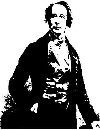
الروائي ديكنز (١٨٥٢)

وفي نيسان/ أبريل سنة ١٨٣٦ تزوجها. وكانت لها شقيقتان، ماري وجورجينا، ارتبطتا كلاكهما ارتباطاً غريباً بهذا الزواج، ونتيجة لذلك انتشرت ظنون وشائعات حول نوع من الحب الشهواني العاصف بينه وبينهما. عاشت ماري مع الزوجين الشابين منذ البداية الأولى للزواج وماتت فجأة في ريعان الصبا بين ذراعي تشارلز، تماماً كما ماتت «نيل ترينيت». والتحقت جورجينا بالأسرة بعد ذلك بوقت قصير، والذي يعث على الاستغراب حقاً أنها بقيت هناك حتى بعد أن حُرمت كاترين من صفتها كزوجة. كانت كاترين الابنة الكبرى