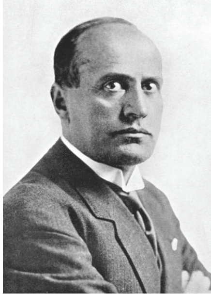
سنيور بنيتو موسوليني زعيم إيطاليا ومحرك الحرب الحبشية الإيطالية.

كانت إشارة من هذا الرجل تكفي لقلب الوزارة، وقد أوضح أحد الكُتَّاب مقدار تأثير ذلك الوزير في الكلمات الآتية: «إنا مدينون لموسيو فلان وحده بكوننا اشترينا التونكين بثلاثة أضعاف ما تساويه، وبكوننا لم نضع في مدغشقر إلا قدمًا متزعزعة، وبكوننا غلبنا في مملكة كاملة جنوب نهر النيجر، وبكوننا أضعنا ما كان لنا من النفوذ الخاص في الديار المصرية. ألا إن نظريات موسيو (فلان) قد كلَّفتنا من الخسائر أكثر من مصائب نابليون الأول!»