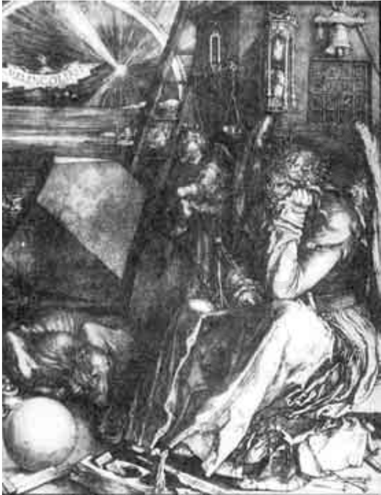
لوحة ا. ألبرشت ديرر، ميلانخوليا ا حفر 1514، جامعة جلاسجو، قاعة هانتريان للفن