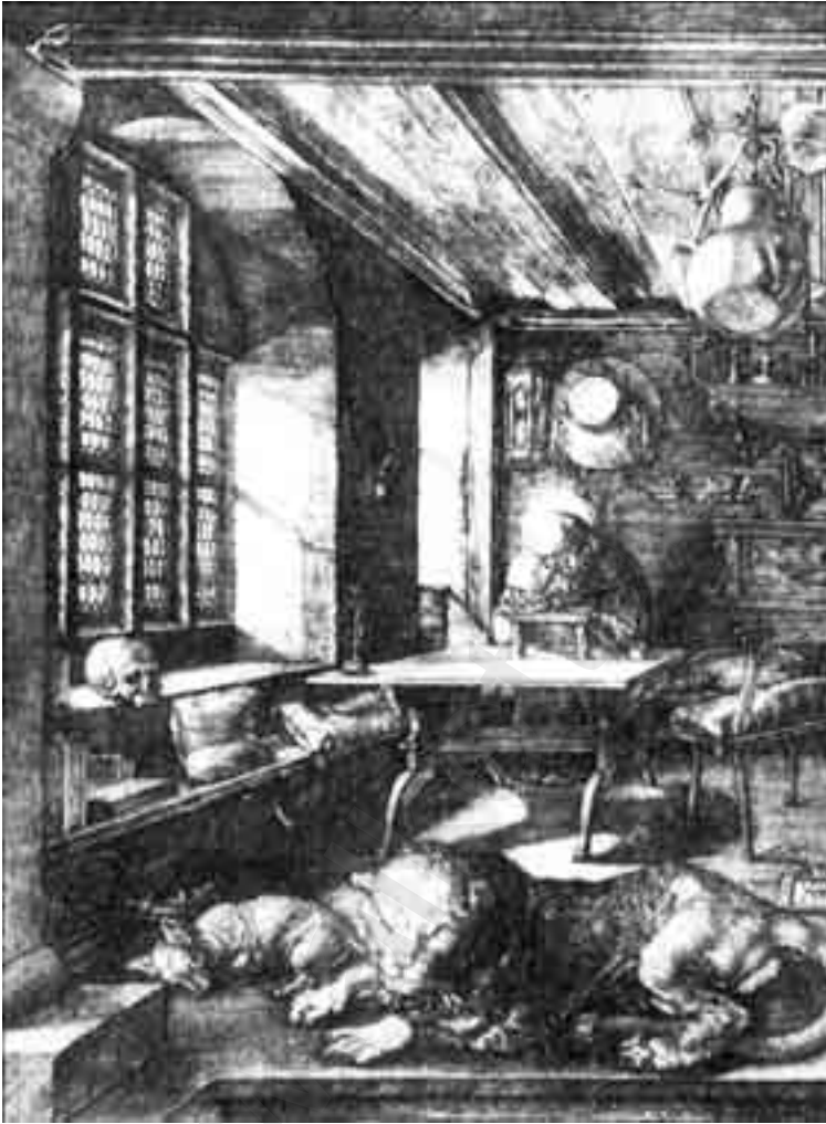
لوحة 2 ألبرت ديرر، القديس جيروم في مكتبته، حضر 1514، جامعة جلاسجو، قاعة هانتريان للفن