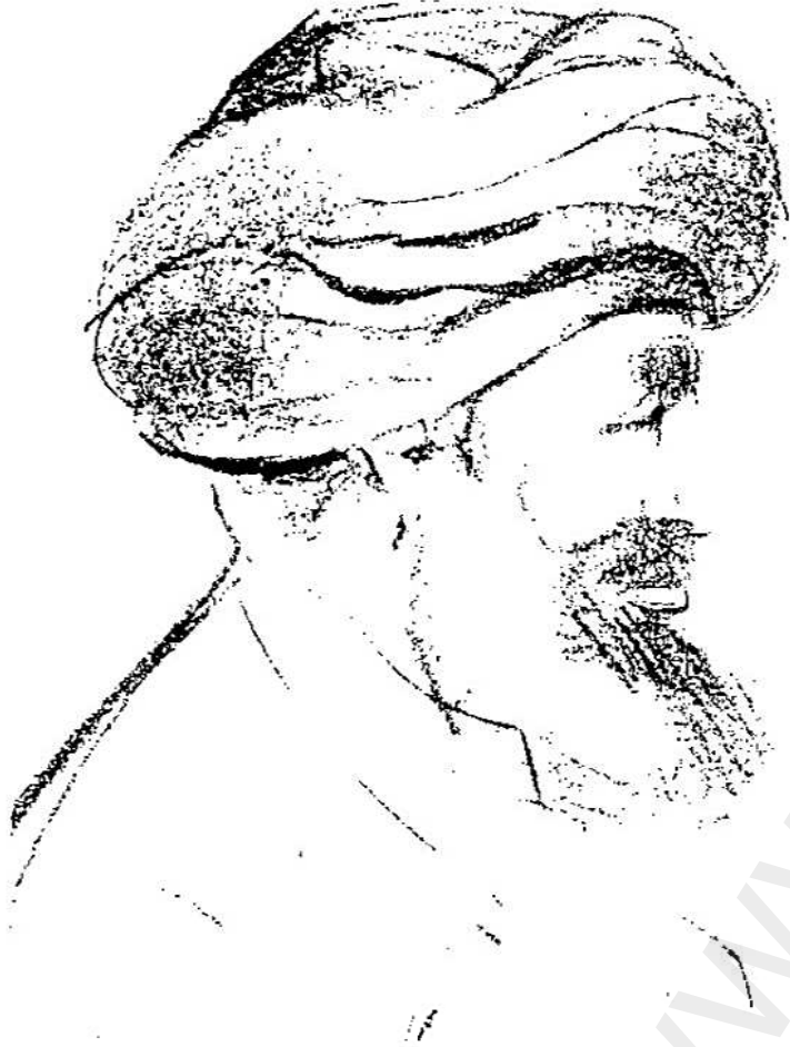
شكل رقم (١)

ديسيه . وقد هنأه القائد الفرنسي على حسن بلائه وقدم إليه سيفاً تذكاريًا نقشت عليه « معركة عين القوصية - ٢٤ ديسمبر ١٧٩٨ » . وفي هذا الوقت كانت حدة القتال في الصعيد قد هدأت ، وساعدت الطبيعة الجغرافية للصعيد من احتمي به من المماليك على أن يجدوا ملاذًا آمنًا في كفورهم ونجوعه القابعة في بطون الجبل ، كما عاق ضيق الوادي المطرد نحو الجنوب أي تقدم فعال للقوات الفرنسية الزاحفة التي اكتفت بإقامة نقاط عسكرية فيما احتلت من أقاليم . ومن ثم طالت حملة الصعيد أكثر مما كان متوقعًا .