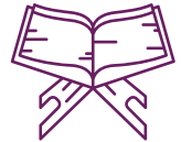
الإثثار من قراءة القرآن وفهم معانيه

وكل عمل خير يحبه الله سنقوم به في نلتهم رمضان