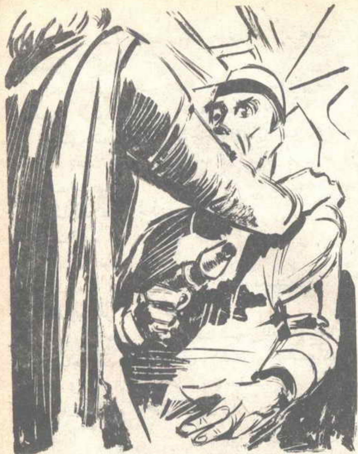
وفي هدوء ، وضع كَفِيهِ على كَتْفِي رجل الأمن ، الذي اختنقت صرخته في حلقه ..

— لقد حكمت على نفسك بالموت ، أيها الأدمى الأحمق . وفي هدوء ، وضع كَفِيهِ على كَتْفِي رجل الأمن ، الذي اختنقت صرخته في حلقه ، وسرّت صاعقة الشيطان في جسده حتى المَوْت ..