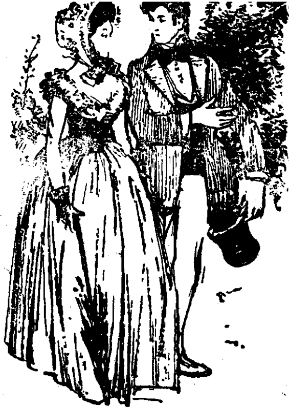
آجنس ودافید .