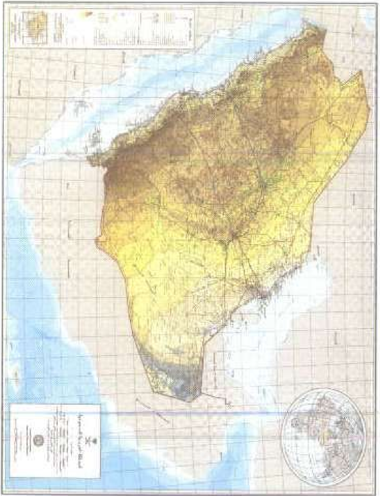
خريطة المملكة العربية السعودية صدرت هذه الخريطة من الهيئة العامة للمساحة بالمملكة العربية السعودية الطبعة الثالثة ١٤٣٠ هـ - ٢٠٠٩ م رقم الإيداع بمكتبة الملك فهد الوطنية ٣٨٣٦ / ١٤٣٠ هـ ردمك ، ٨٠١٥ - ٦٠٣ - ٩٧٨