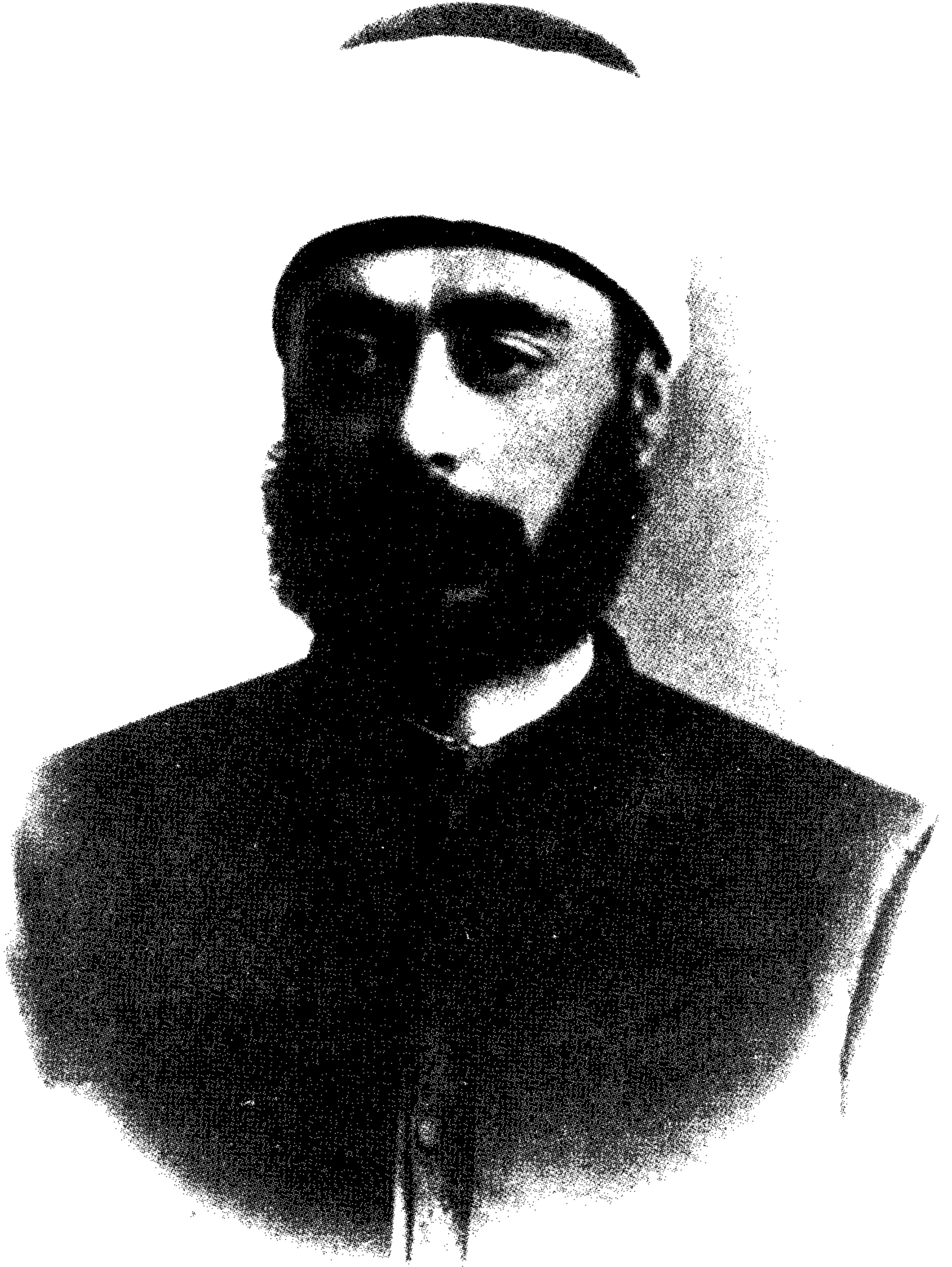
عبد الرحمن الكواكبي

٢٣ شوال ١٢٧١هـ - ٩ تموز/يوليه ١٨٥٥م - ٦ ربيع الأول ١٣٢٠هـ - ١٣ حزيران/يونيه ١٩٠٢م