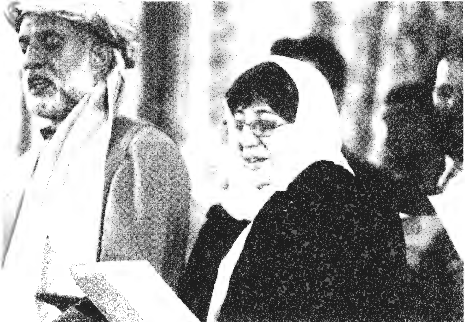
الدكتور سيما سامار تقسم اليمين بصفتها أول وزيرة أفغانية لشؤون المرأة. وتعرضت في الحال للمضايقات لتترك المنصب وهي اليوم تخاف على حياتها 2001