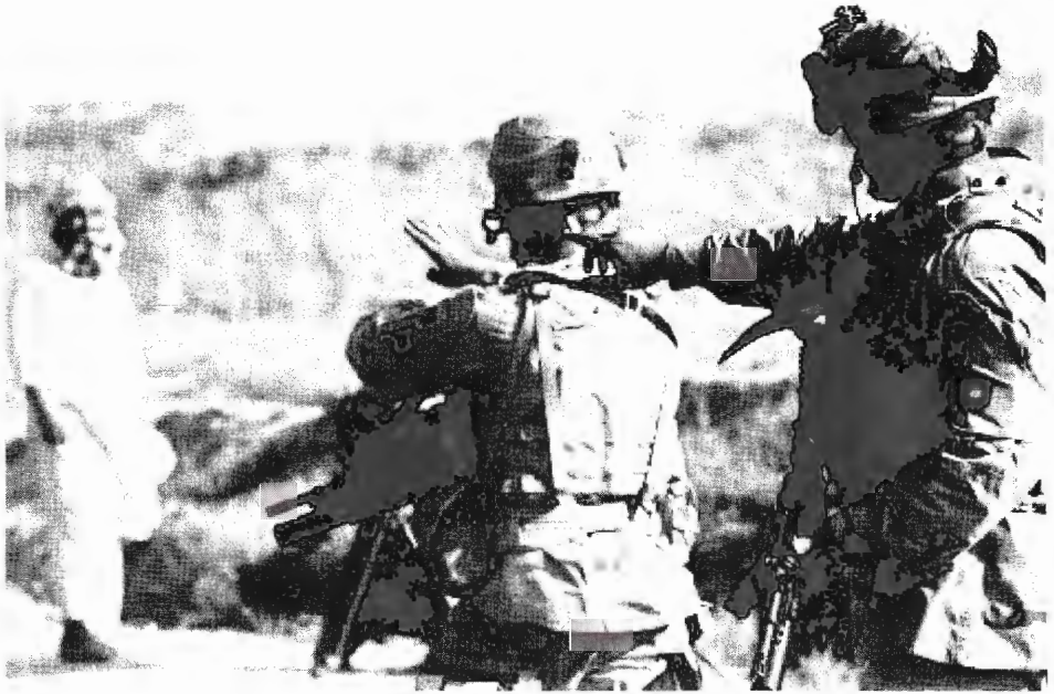
جنود أمريكيون يلقون الأوامر على الأفغان خارج قاعدة باغرام، بالقرب من كابول 2005