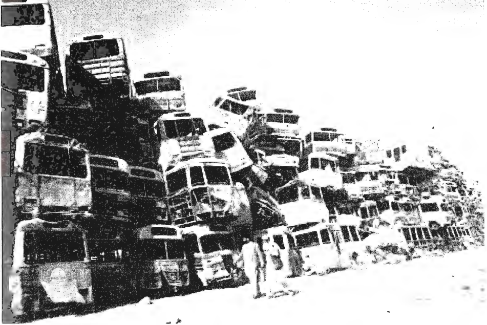
سيارات ركاب كابول، تحولت إلى نفايات على يد أمراء الحرب الذين دعمهم الغرب 2005