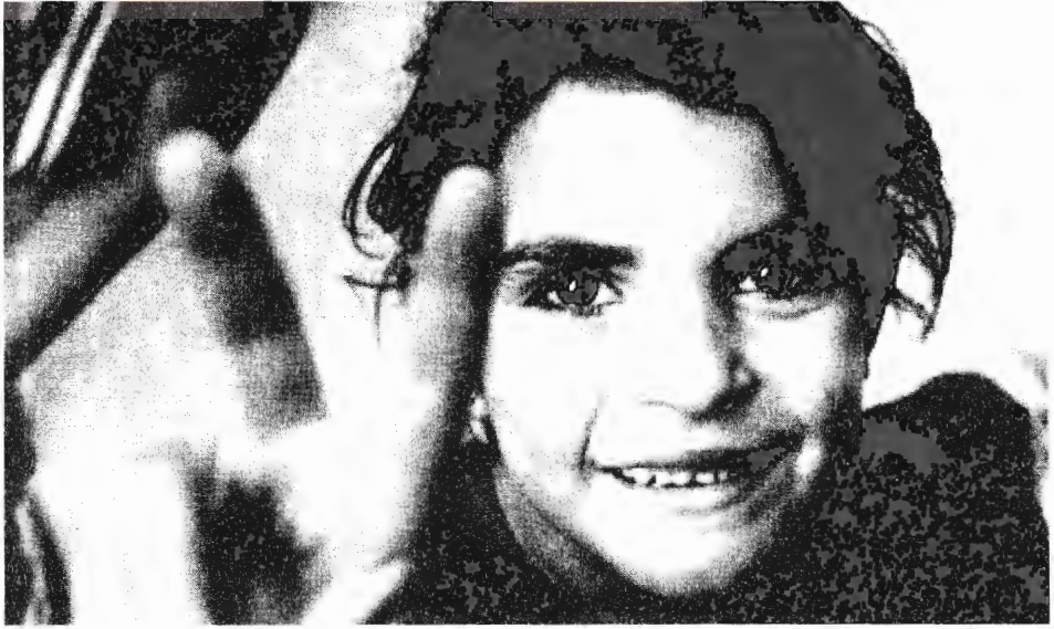
فتاة فلسطينية صغيرة، من غزة 2002