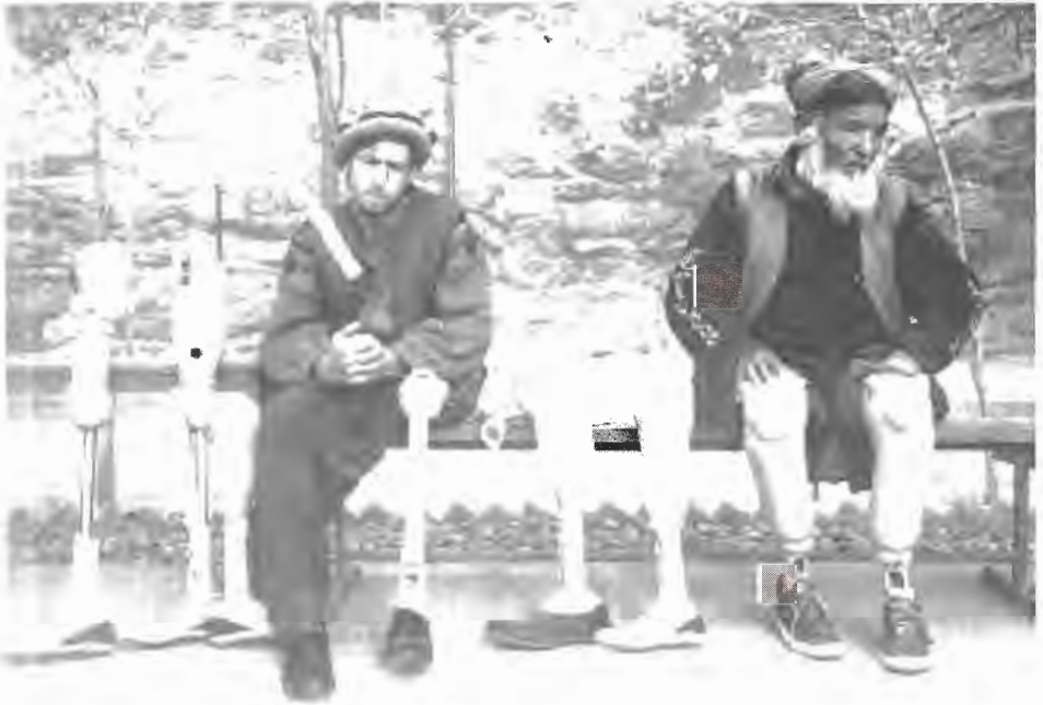
يوجد في أفغانستان ألغام أرضية غير مزالة أكثر من أي بلد آخر في العام 2001