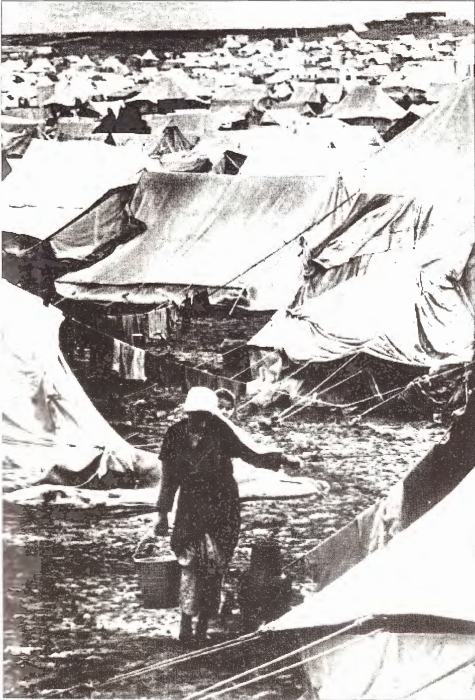
مخيم لاجئين فلسطينيين بإشراف الأمم المتحدة بعد ولادة إسرائيل 1948