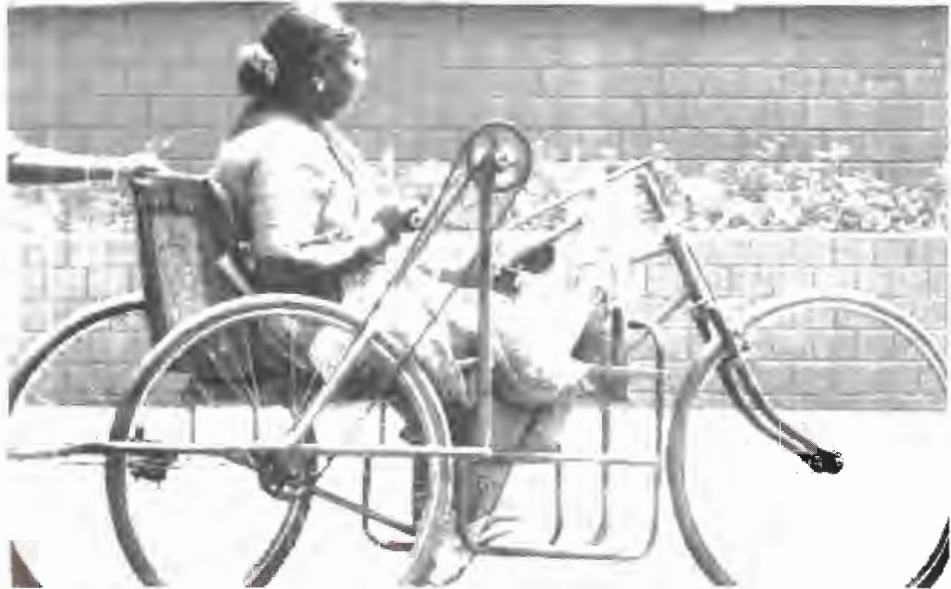
الهند "الجديدة" 2004