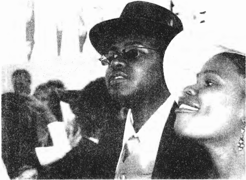
الأغنياء السود الجدد في جنوب إفريقيا، ديربان، ديربي 2005