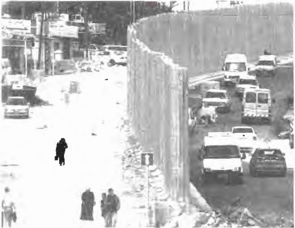
جدار إسرائيل للتمييز العنصري يفصل البلدة الفلسطينية الرام عن طريق إسرائيلي 2006