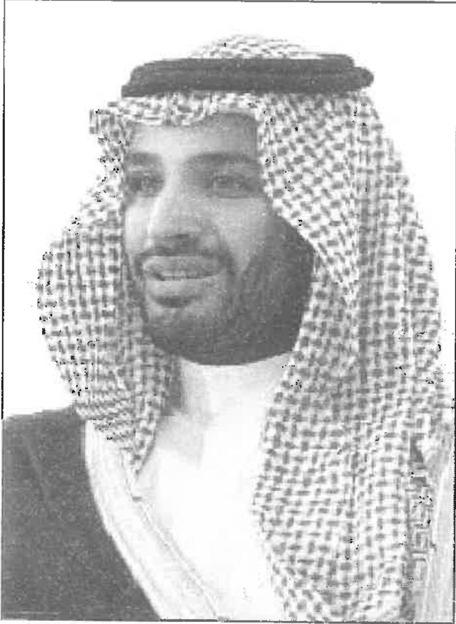
صاحب السمو الملكي ولي ولي العهد الأمير محمد بن سلمان بن عبد العزيز آل سعود (حفظه الله)