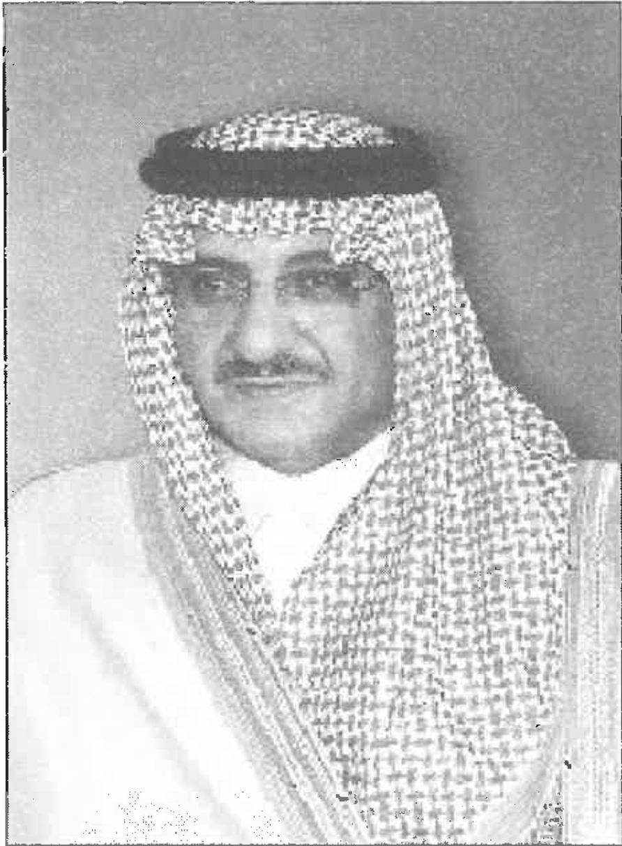
صاحب السمو الملكي ولي العهد الأمير محمد بن نايف بن عبد العزيز آل سعود (حفظه الله)