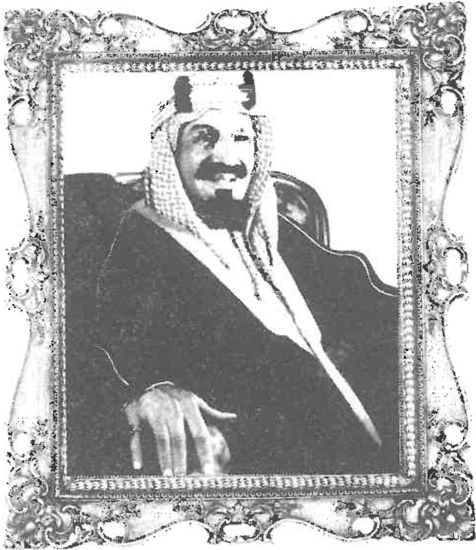
صقر الجزيرة العربية الملك عبدالعزيز آل سعود (طيب الله ثراه) مُوَحِّد ومؤسس المملكة العربية السعودية وباني مجدها الحديث