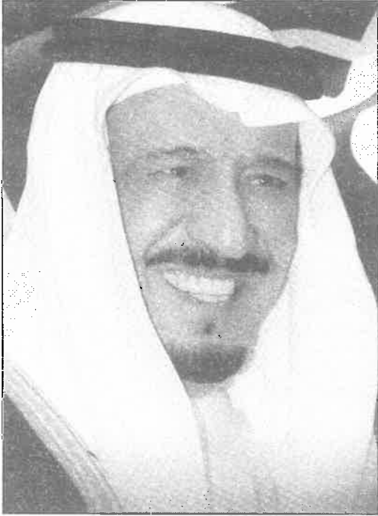
خادم الحرمين الشريفين الملك سلمان بن عبدالعزيز آل سعود (حفظه الله)