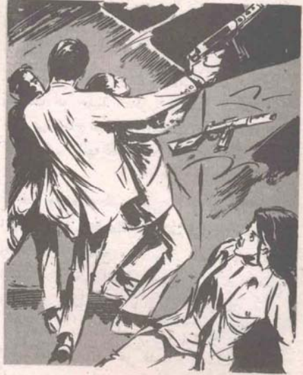
كانت سرعة استجابة (أدهم) مذهلة حقاً هذه المرة ..

لم يجبها (أدهم) ؛ إذ توقّف مشدوها ، وعيناه تحمقلان فى الجدار المقابل ، وسمعه (منى) يتمم بذهول لم تألفه منه مطلقا .