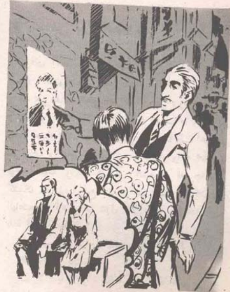
فوجد أمامه رجلاً كستاني الشعر ، له حاجبان كفيفان ، وشارب رفيع ، يعلوه أنف ضخمة ..

قلّبت ( منى ) كفيها ، وقالت في حيرة : — وأين يمكننا العثور عليه ؟ .. لقد اختفى من منزله