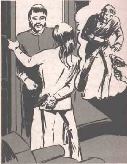
أخفت (منى) مسدسها خلف ظهرها ، وفتحت الباب بهدوء ، فوجدت أمامها رجلاً مفقول العضلات ..

كانت (منى) تسير فى غرفتها بقلق ، وهى تفكّر فيما يفعله (أدهم) فى هذه اللحظة .. كانت تعلم أن إقصاءه لها يعبر عن عواطفه نحوها ، وعن رغبته فى العمل بحرية ، ولكن مجرد تفكيرها فى المخاطر التى قد تواجهه ، يجعل قلبها ينبض بخوف وجزع .. إنها تعلم أن (أدهم) لن يتوانى فى عمله ، ولن يقبل الفشل ، بل سيقااتل حتى النهاية ، وإن