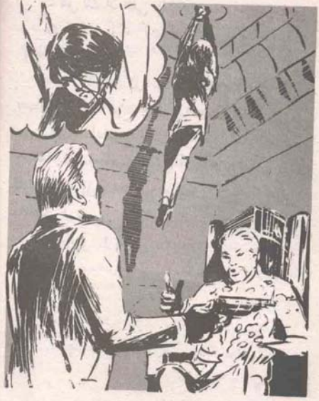
أعقبها جسم امرأة مقيدة من معصمها ومعلقة بسلسلة معدنية ..

السلسلة فتسقط ريفقتك مباشرة في الفجوة ، ويلتجمها الحامض القوي في ثانية واحدة ؟