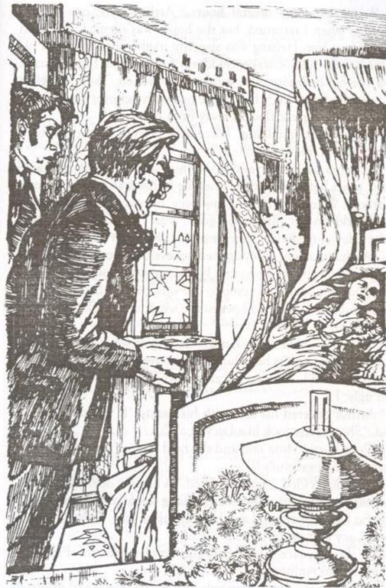
"عزيزتي لوسي بسلام الان"