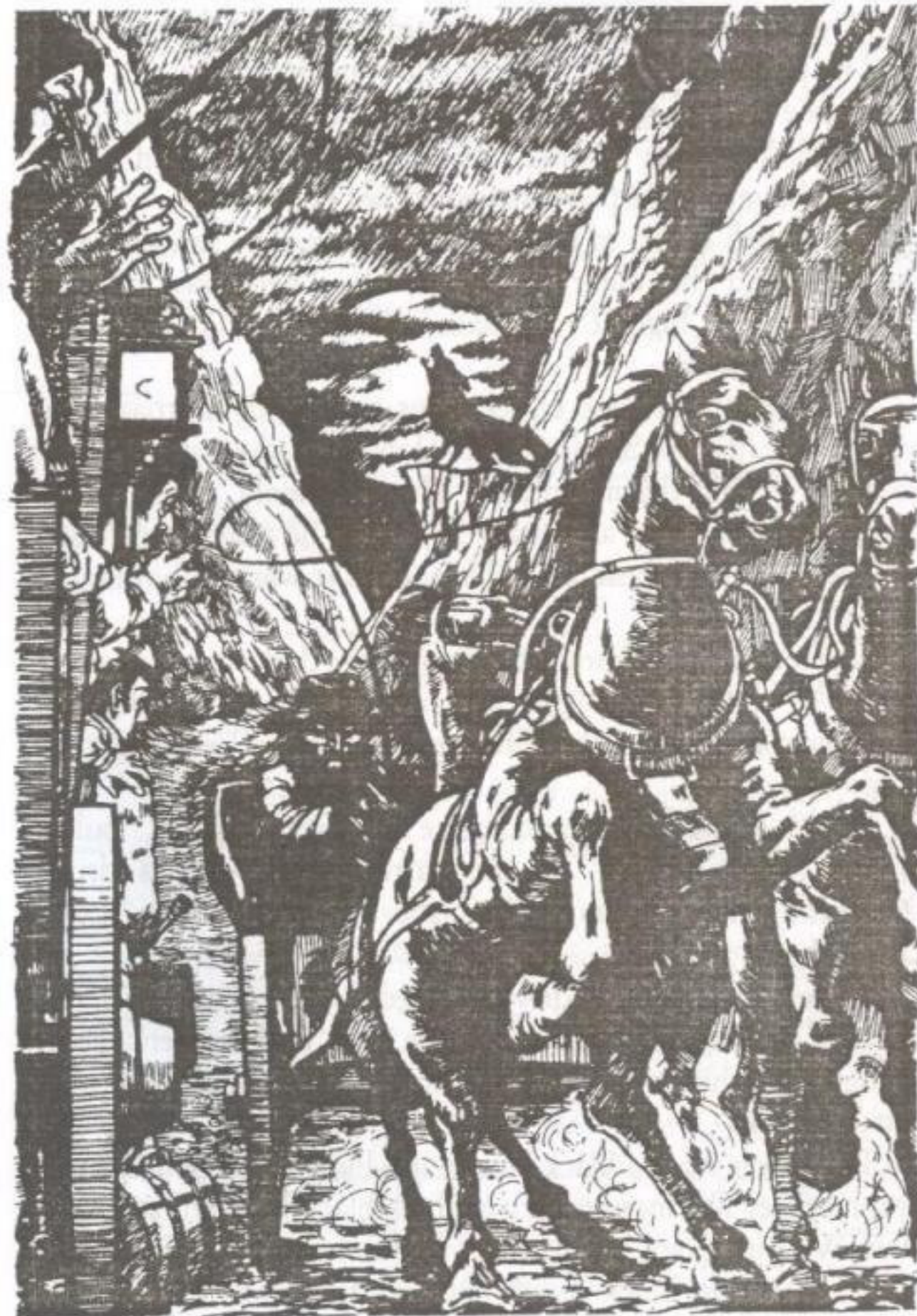
و من أسفل الطريق أقبلت عربة تجرها أربعة خيول سوداء