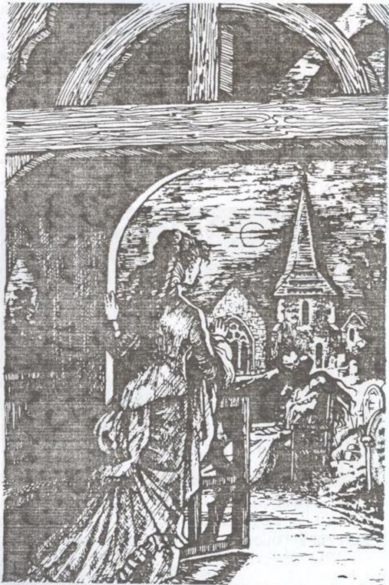
Mina thought she saw a white face and two red eyes.