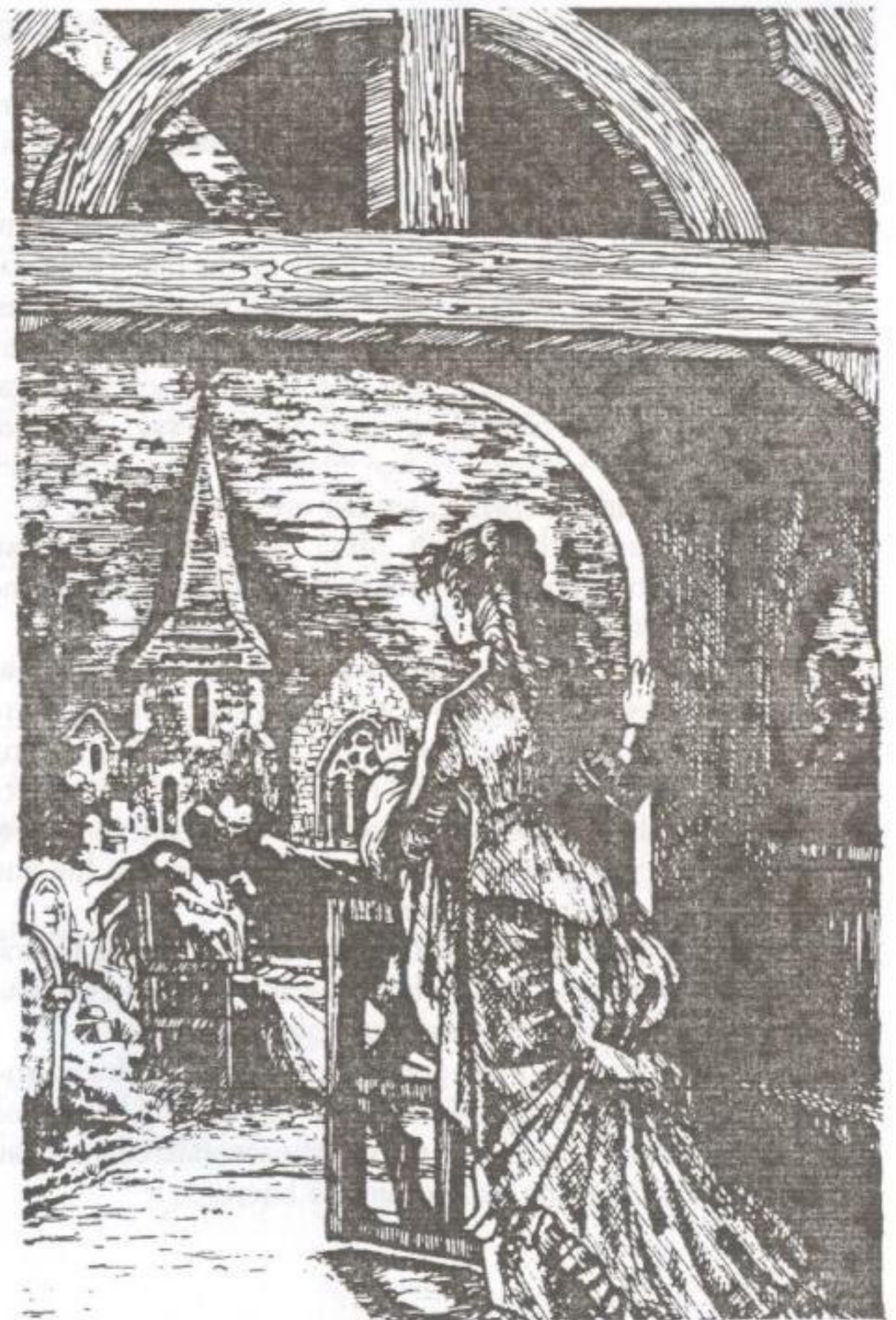
اعتقدت مينا بانها رات وجهاً ابيضاً و عينين حمراوين.