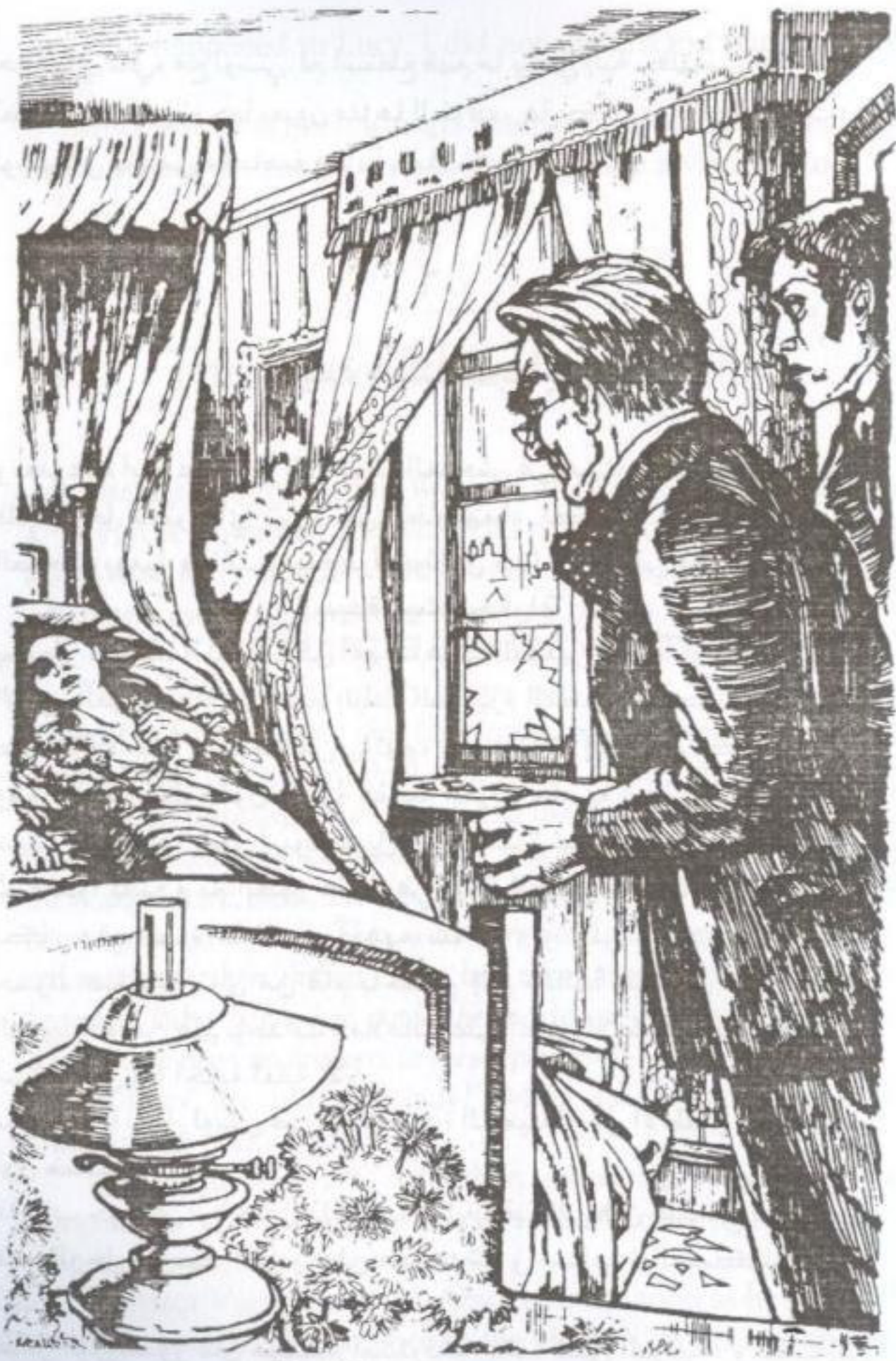
'Dear Lucy is at peace now.'