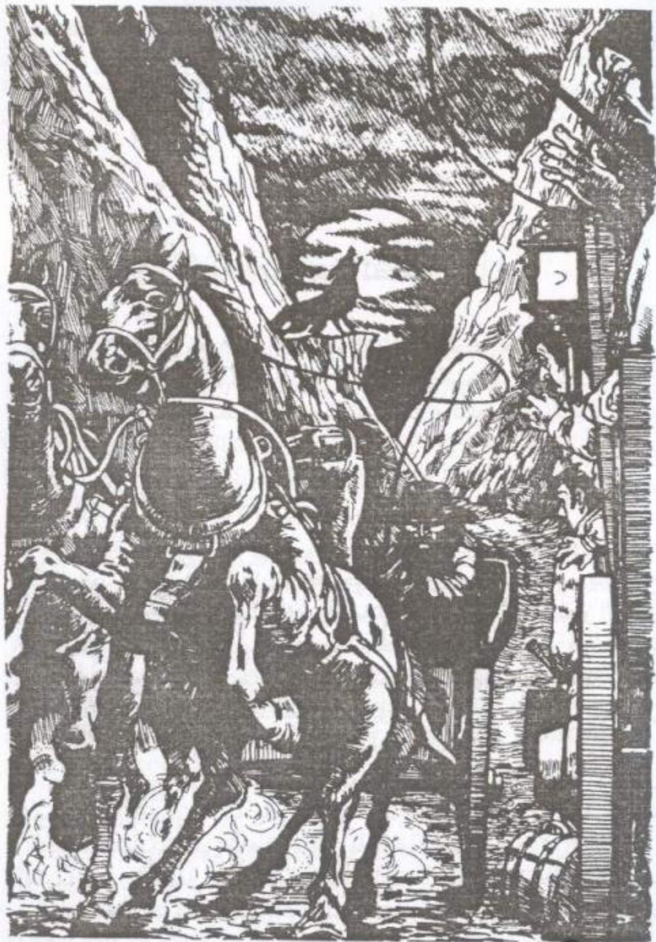
Down the narrow road came a small carriage, pulled by four black horses.