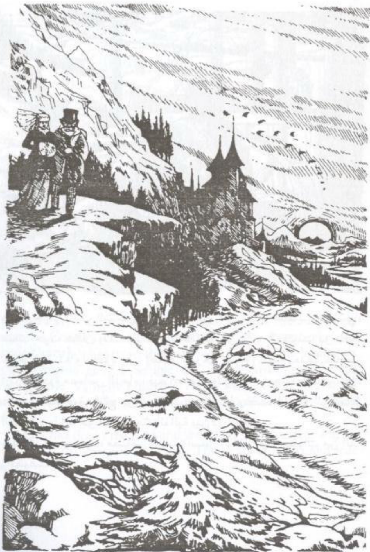
They could see a narrow, winding road which went up the side of the mountain.