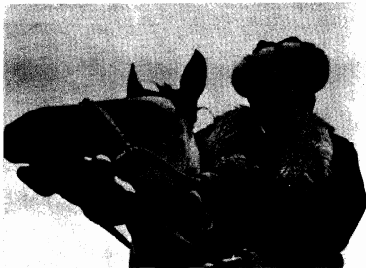
جنکيز ايتمانوف مع شغيلة الريف القرغيزين