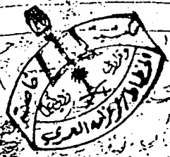
الصفحة الأولى من النسخة الثالثة