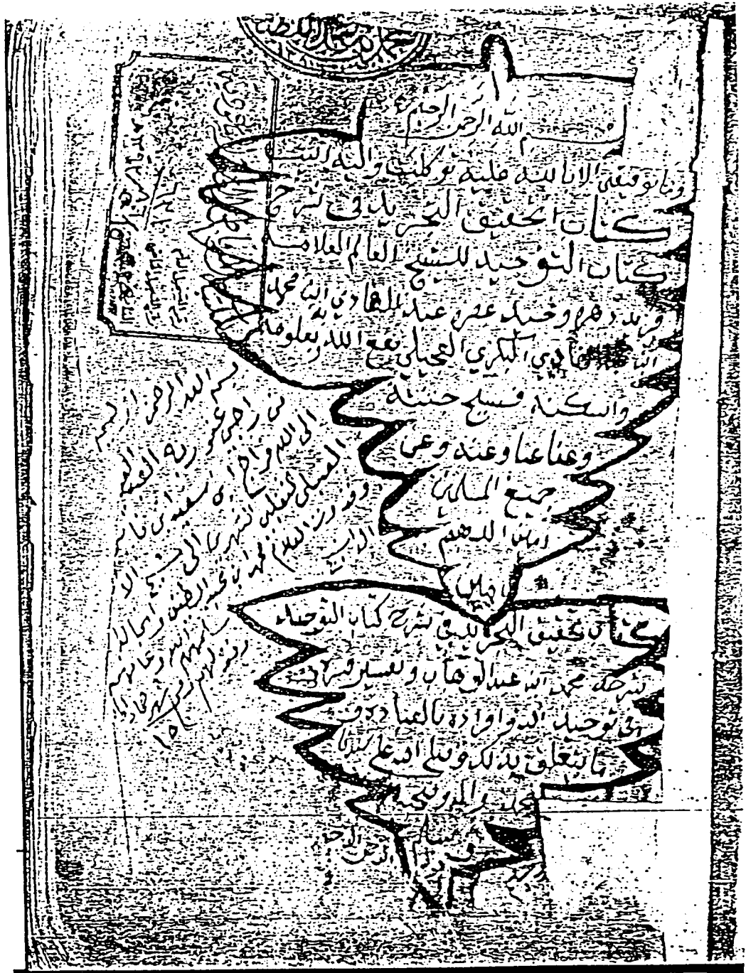
الصفحة الأولى من النسخة الثانية