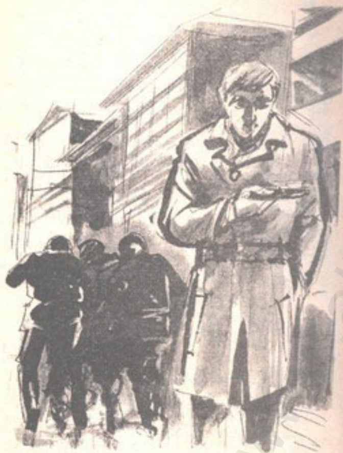
كان يعرف الآن تفاصيل شراء هذه المطواة ..