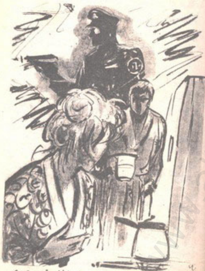
« تصوورى هذا .. منذ كنت فى الخامسة من عمري وأنا أنتظر لقاء هذا الرجل .. »