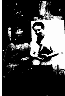
سارتر ودوبوفوار أمام تمثال بلزاك في باريس

سيمون دو بوفوار ، التي استمرت منذ شبابهما وحتى سنة ١٩٦٠ ، إلى أنهما كانا يتبادلان حباً قوياً طوال حياتيهما . وكانت سيمون تبكي عندما تتأخر عليها رسائل سارتر طويلاً ، خصوصاً بعد غيابه مجدداً في شرقي فرنسا ، أو بعد ذلك عند سفره إلى أميركا . كتبت إليها ، في بداية رفاقتهما ، وهو مجند في الحرب : «أنا لي ذاكرة قوية للأشياء التي شاركنا فيها ، وعندما تحيء ذكراك وأنا في الحرب أتألم بحبك ، فأنت لست شيئاً عابراً في حياتي .