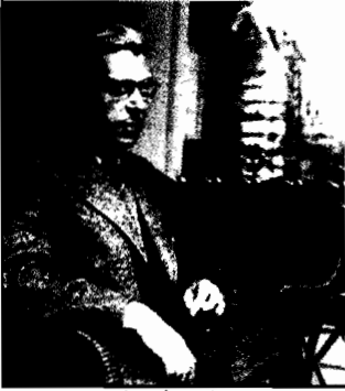
جان پول سارتر

في الحىّ السادس عشر من أحياء باريس ، وفي الواحد والعشرين من حزيران/ يونيو سنة ١٩٠٥ ، ولد جان پول سارتر . كان والده جان -