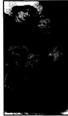
في حضن أمه

وتجدد الإشارة إلى أن سارتر فقد بصر عينه اليمنى تماماً وهو في الثالثة من عمره ، ولكن هذا لم يمنعه من التعلّق بالقراءة