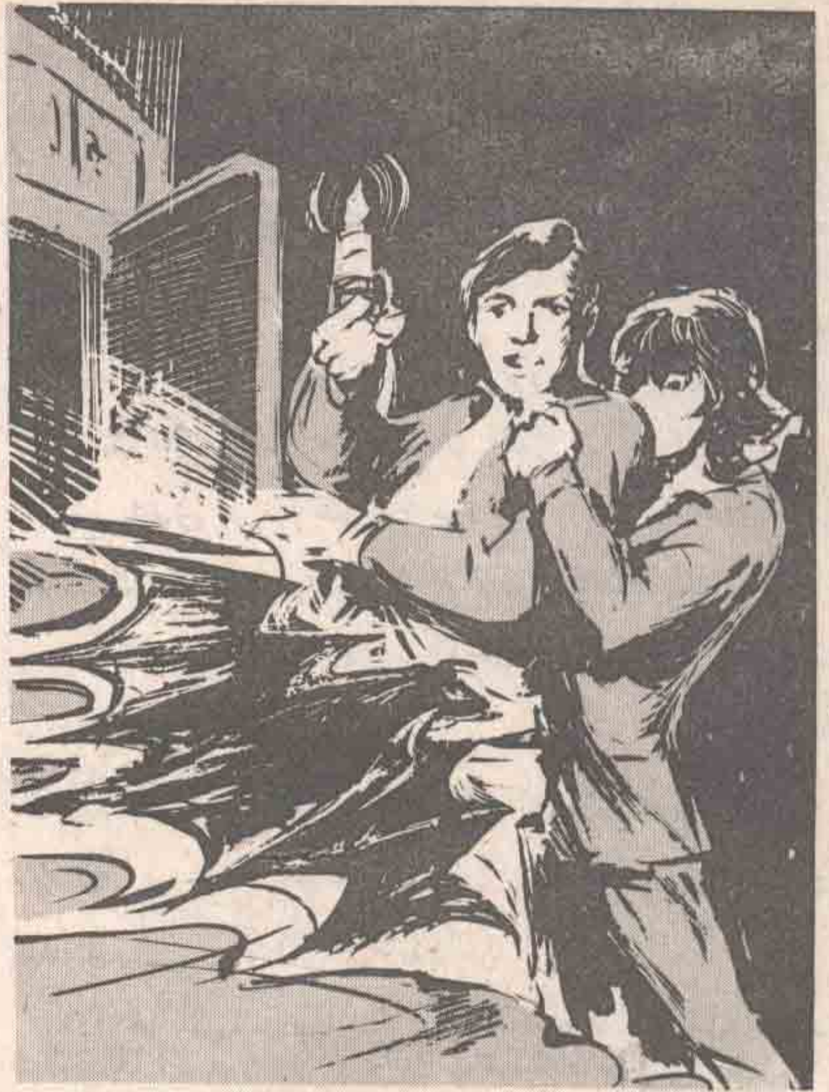
على حين تراجع هو في حدة ، عندما اندفع من داخل الصوان شبح أسود مخيف نحو وجهيهما ..

قفز ( نور ) درجات السلم ، وتبعته ( سلوى ) في ذعر إلى ردهة القصر .. وما أن أصبحت بداخلها حتى