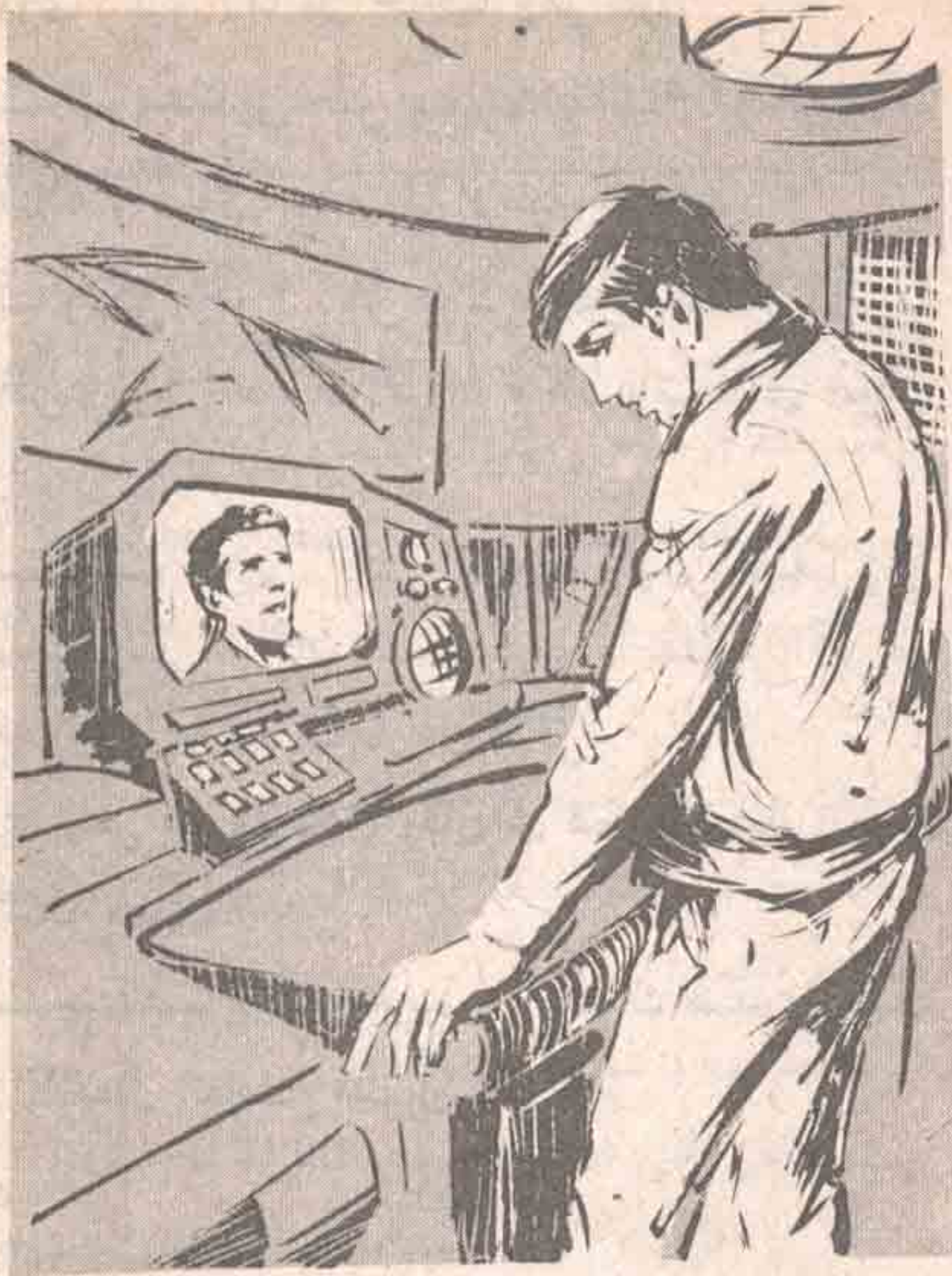
وللمرة الثانية بدا وكأن ( رمزي ) لم يسمع عبارة ( نور ) ، إذ استطرد بلا توقف ..

وللمرة الثانية بدا وكأن ( رمزي ) لم يسمع عبارة ( نور ) ، إذ استطرد بلا توقف : — ولقد فكّرت أنه من الطريف دعوتك أنت و ( سلوى ) ، لحفل صغير أقيمه في القصر مساء اليوم . سأله ( نور ) في تعجب : — إنك لم تجب عن سؤالى بعد يا ( رمزي ) .. لم تبدو قلقاً إلى هذا الحد ؟