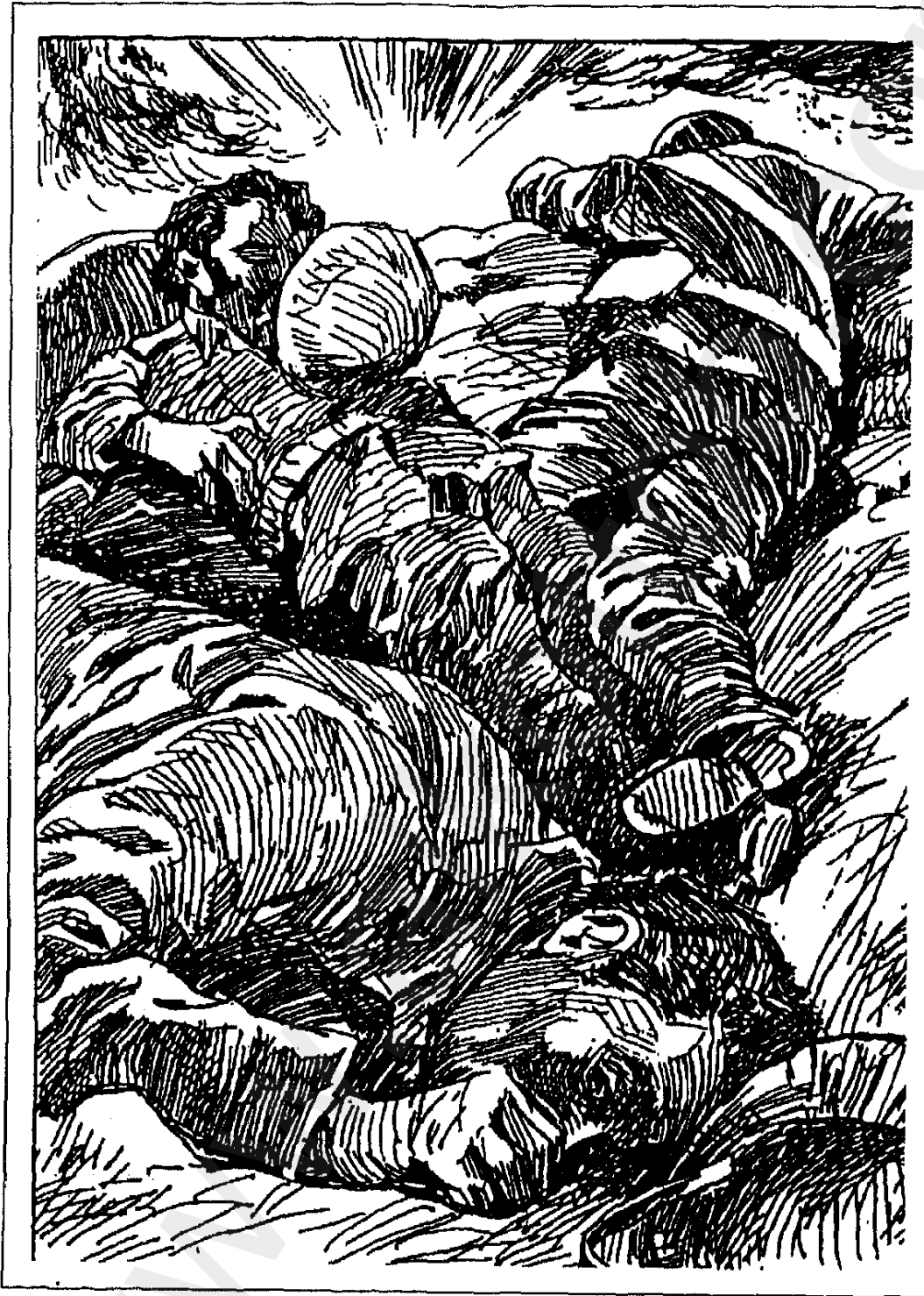
■ الرصاصة لا تزال في جيبي ■ ٢٣ ■