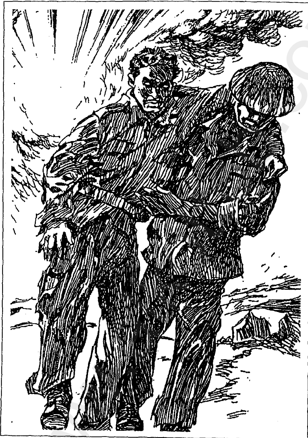
■ الرماصة لا تزال في جيبي ■ ١٠١ ■