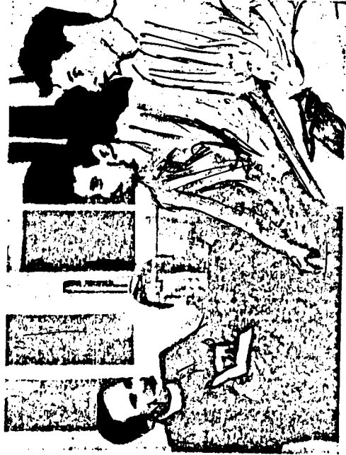
القس يعقد قرانها!

ولقد عقد القس زواج المشروطين من الرجال على الرجل وقدم موعودات كبيرة من اراد ان يتحول إلى امرأة او تتحول إلى رجل فيقول عن الماوسة والرعية التي يعظها لمرض الإنزيم منهم .