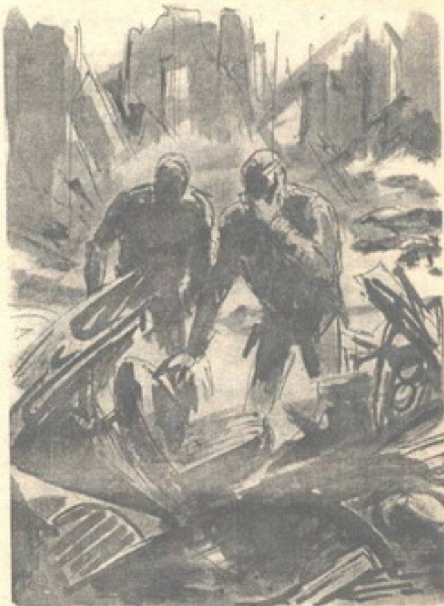
وراحا يفحصان حطام المقاتلة الفضائية فى اهتمام بالغ ..

قبل أن يلوّح بإشارة خاصة ، جعلت ( أكرم ) يضغط