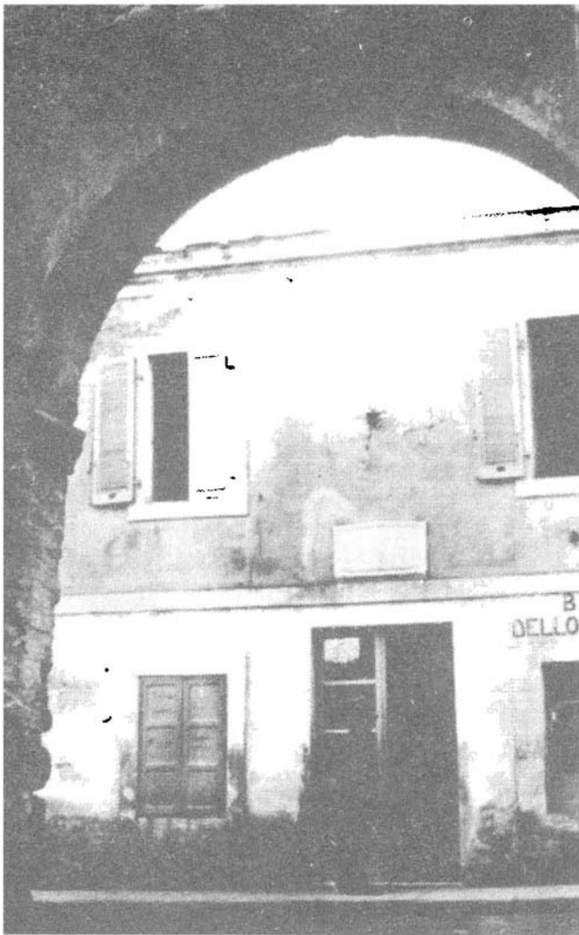
البيت الذي وُلِد فيه غرامشي، في أليس