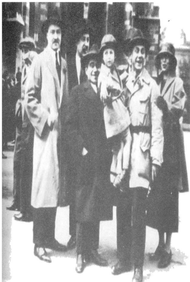
غرامشي في فيينا 1924