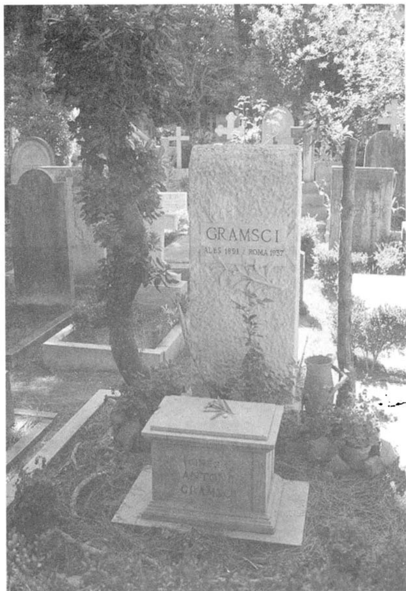
قبر غرامشي في روما