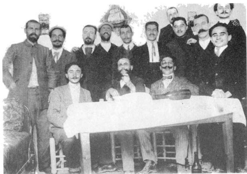
غرامشي في غيلارزا 1924