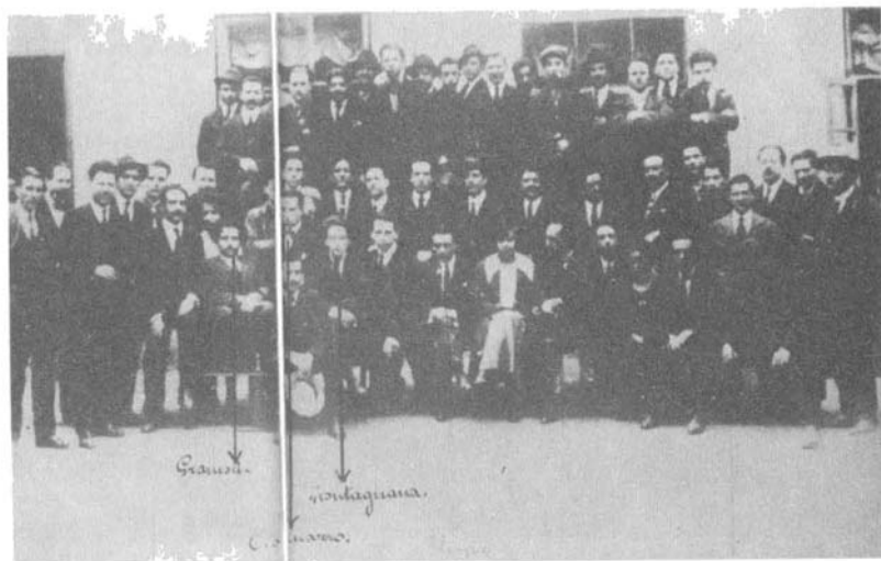
غرامشي مع أسرة تحرير "النظام الجديد"