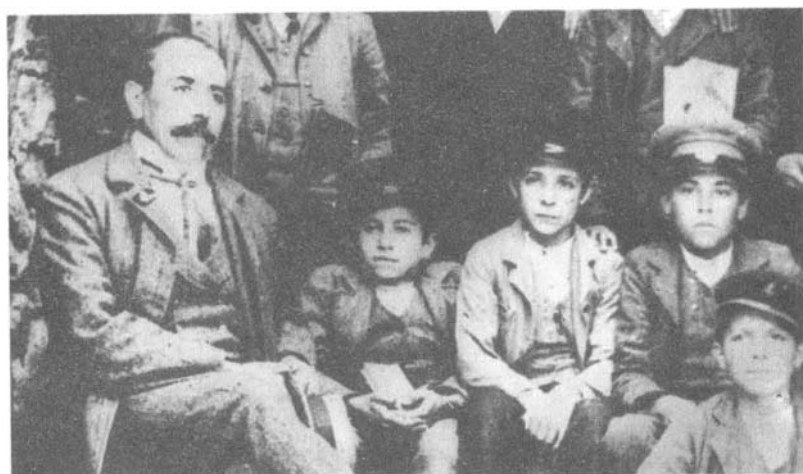
غرامشي في المرحلة الإعدادية