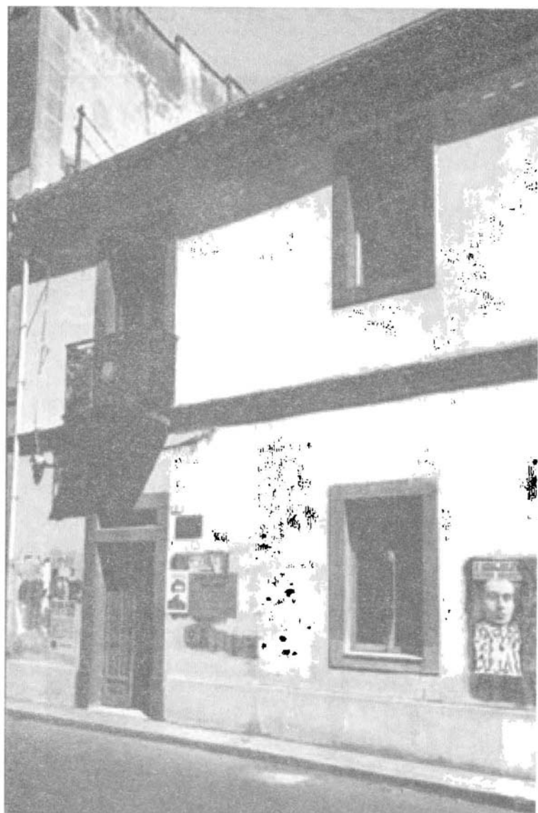
منزل غرامشي في غيلارزا