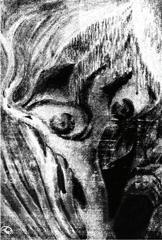
طعبروس إله الغلو والادعاء.