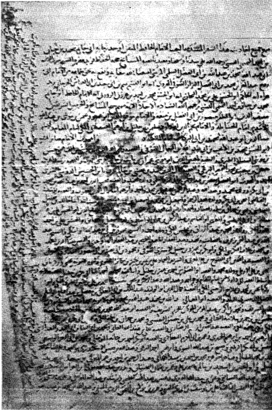
٤ - ثبت سماع المجلد الثالث من النسخة (س) على العلامة شرف الدين السلمي المرسي سنة ٦٤٤ هـ . بقراءة الحافظ قطب الدين القسطلاني الكبير . انظر (ص ٣٤ - ٤٠) . وترجمة القطب القسطلاني (ص ٢٧) .