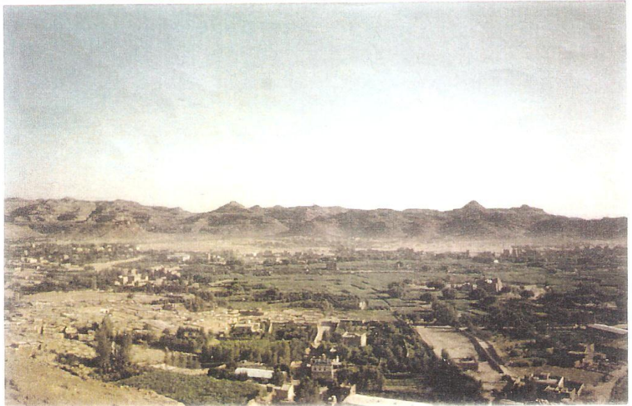
صور من دماج