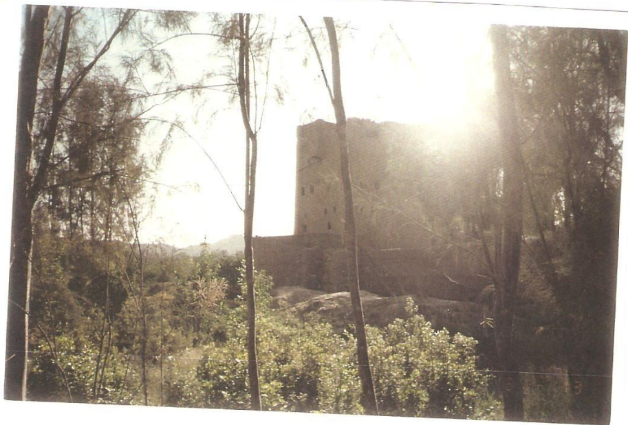
صور لبعض بيوت دماج