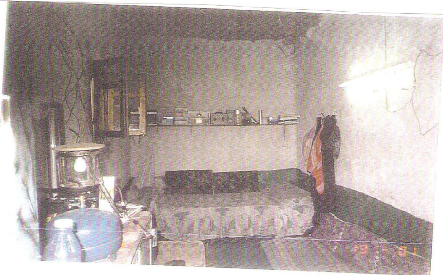
غرفة الشيخ مقبل رحمه الله وقد هدم بيته كاملا وادخل في المسجد