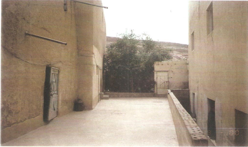
على يمين الصورة مكتبة النساء وعلى يسار الصورة منزل الشيخ مقبل رحمه الله