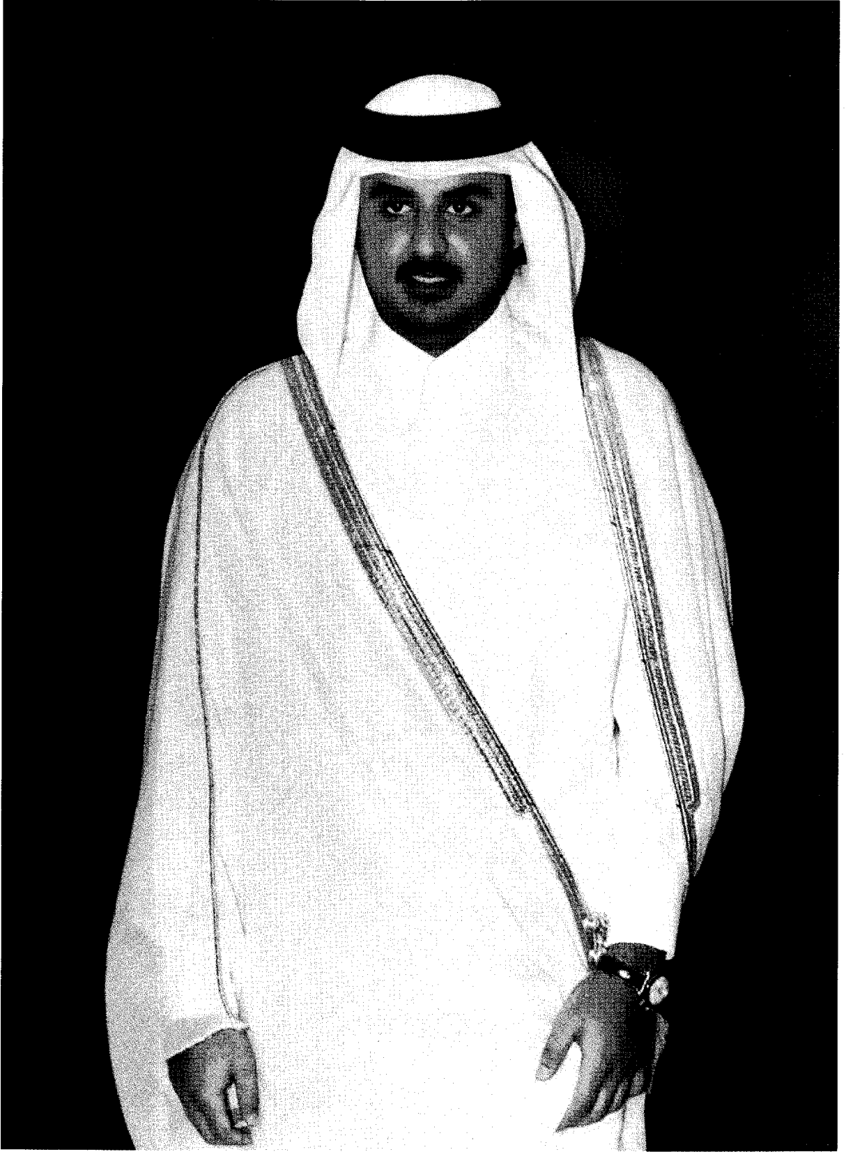
سمو الشيخ تميم بن حمد آل ثاني ولي العهد