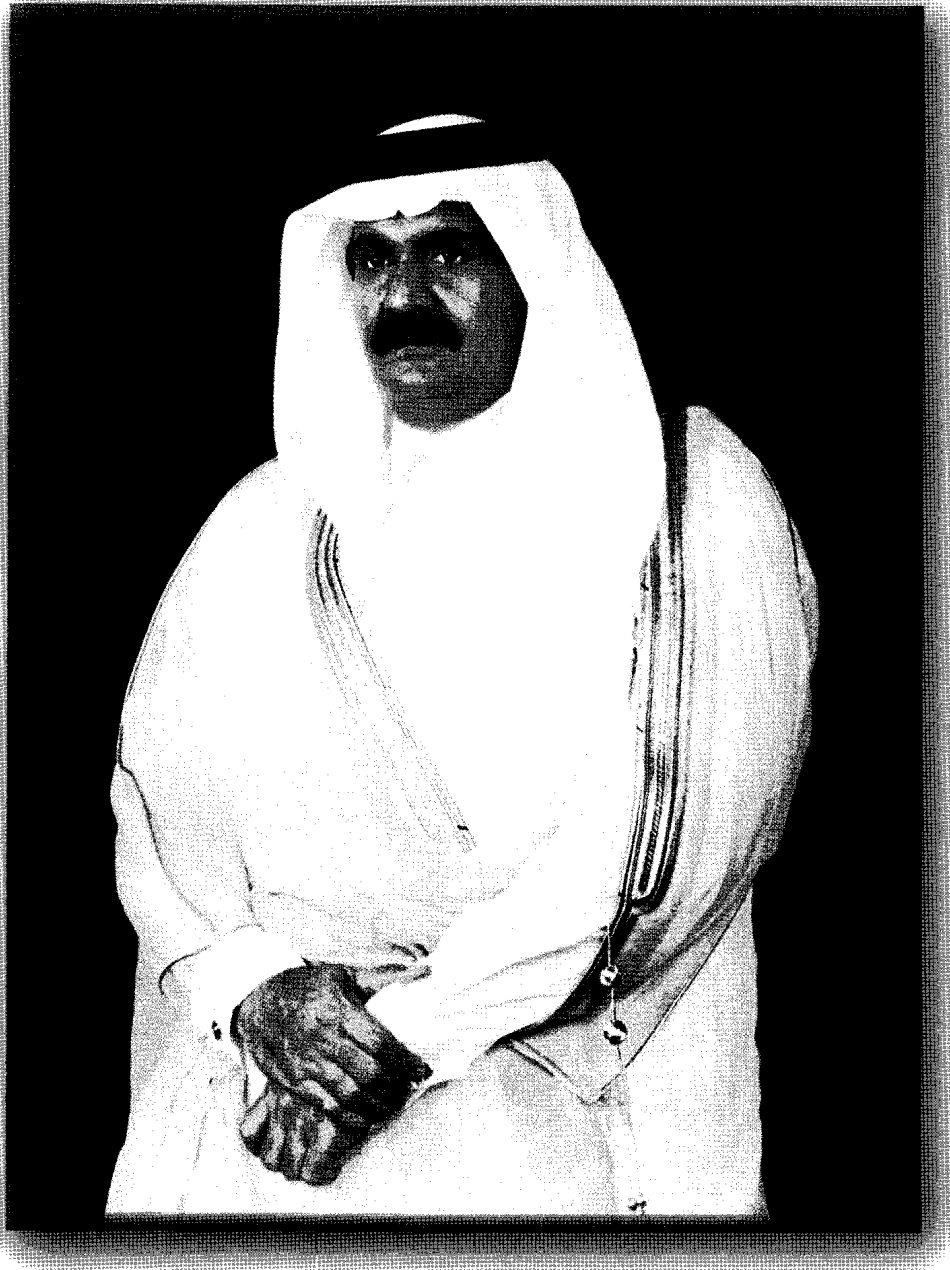
حَضْرَةُ صَاحِبِ السَّمَوِّ السَّيِّدِ مُحَمَّدِ بْنِ خَالِدِ بْنِ تَائِبِ بْنِ أَمِيرِ دَوْلَةِ قَطْرٍ