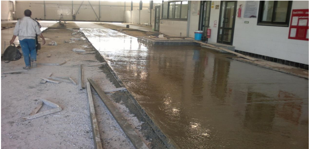
بعد صب الشريحة كما بالشكل

تترك حوالي ربع ساعة ثم يتم البدء فى رش البلاطة بالهارد فلور ثم يتم دخول الهليكوبتر مع عامل اخر بمسطرين يساوى ويعالج اماكن لا يستطيع الهليكوبتر الوصول اليها ... نتابع الصور ونفهم اكثر باذن الله