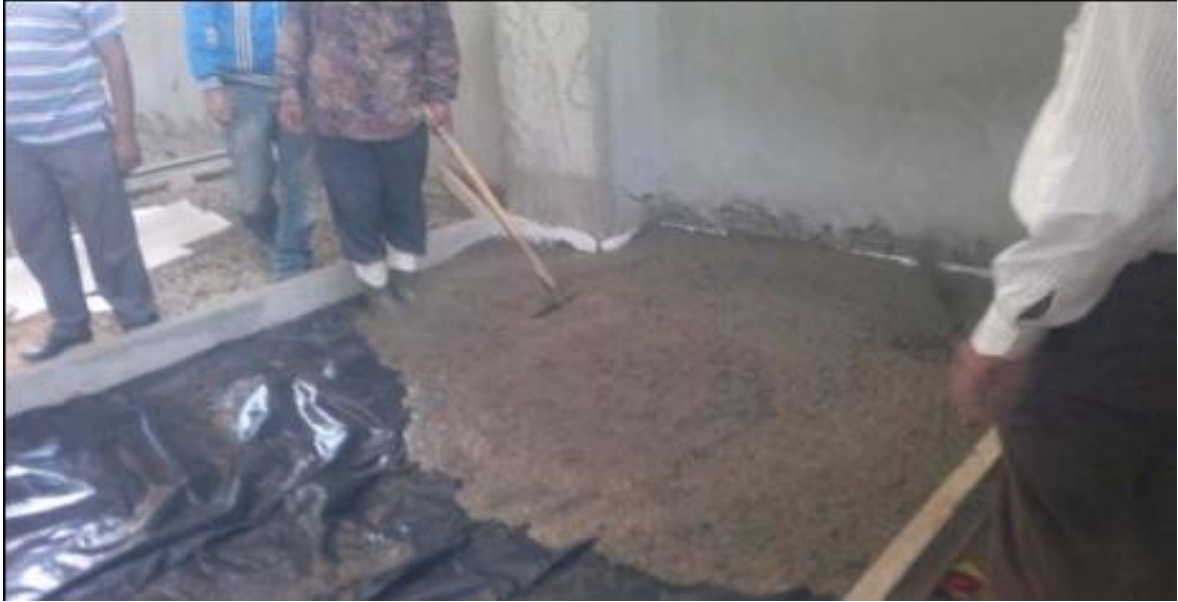
يلاحظ الفوم الى على الحوائط وعند العمدان