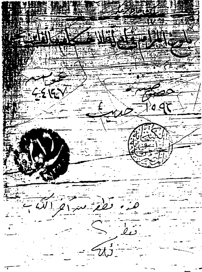
طرة النسخة «خ»