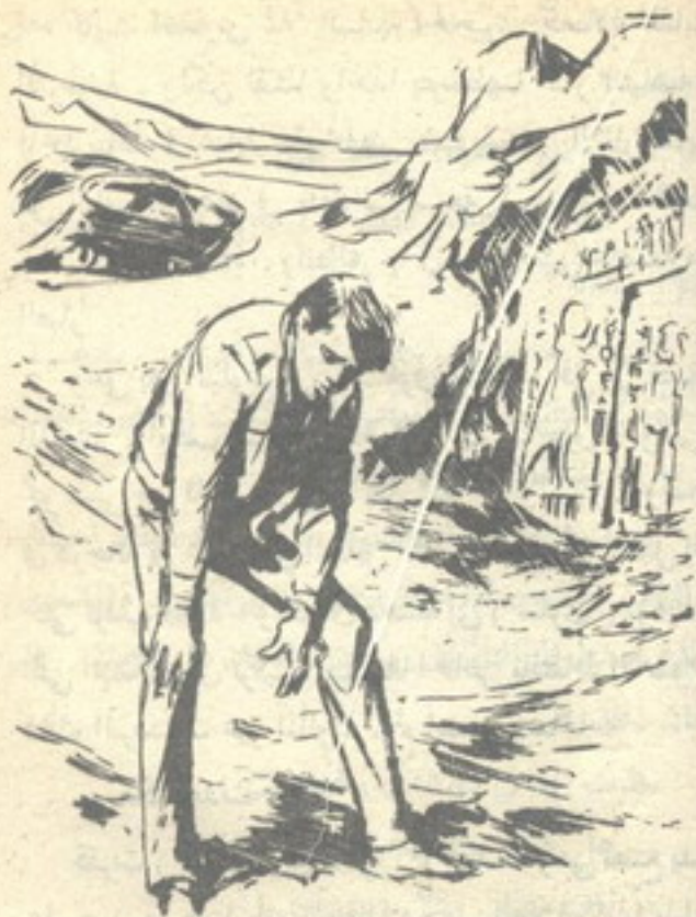
وانحنى يفحص الآثار المرسومة على الرمال في عناية ..

هزّ الدكتور ( حجازى ) رأسه في بظء علامة التفى ، وقال فى لهجة تحمل العتاب :