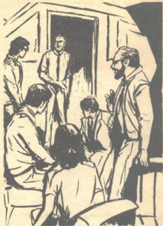
الفت الجميع إلى مصدر الصوت ، فطالعهم شاب في أوائل الثلاثينات ..

— معذرة يا سيّدى .. لقد اتخذ قدماء المصريين سنبله القمح رمزاً للموت ، مادامت منتزعة من الحقل ،