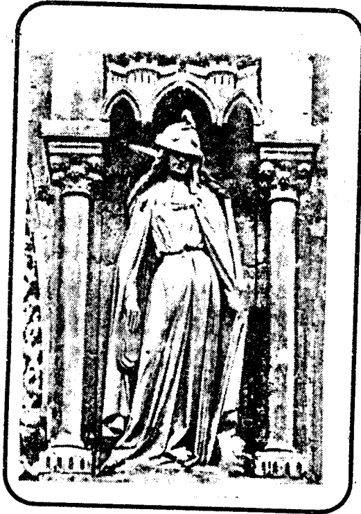
" مجمع إسرائيل " تمثال علي واجهة كنيسة نوتردام بباريس

نماذج من تصوير "لوحا العهد" فى صورة مستديرة من أعلى وعلي شكل مستطيل أو علي صورة "الديفتيخون" المسيحى