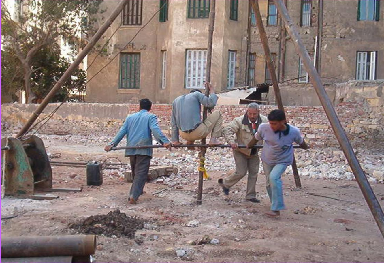
النزول بالبريمة مع الضغط و التحميل