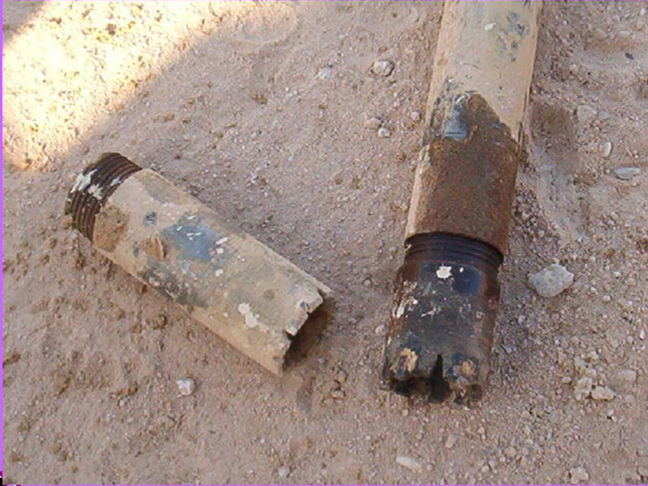
ربط السكنينة بالكور