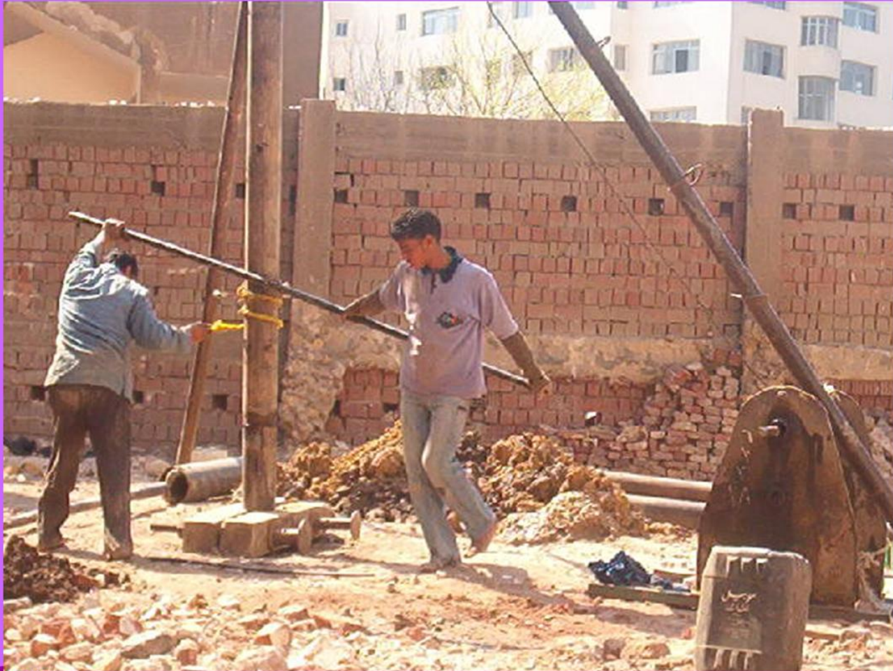
ربط وصلات المواسير