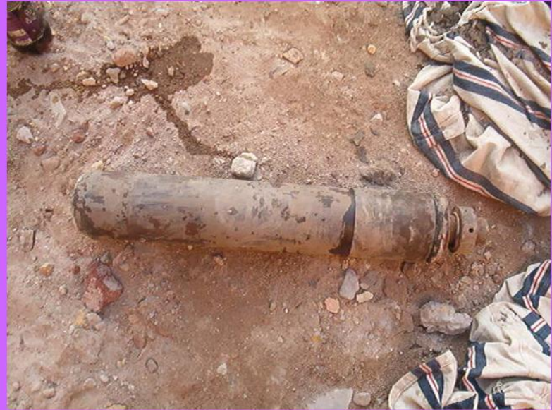
جهاز اخذ عينات الطينه ( شلبي )