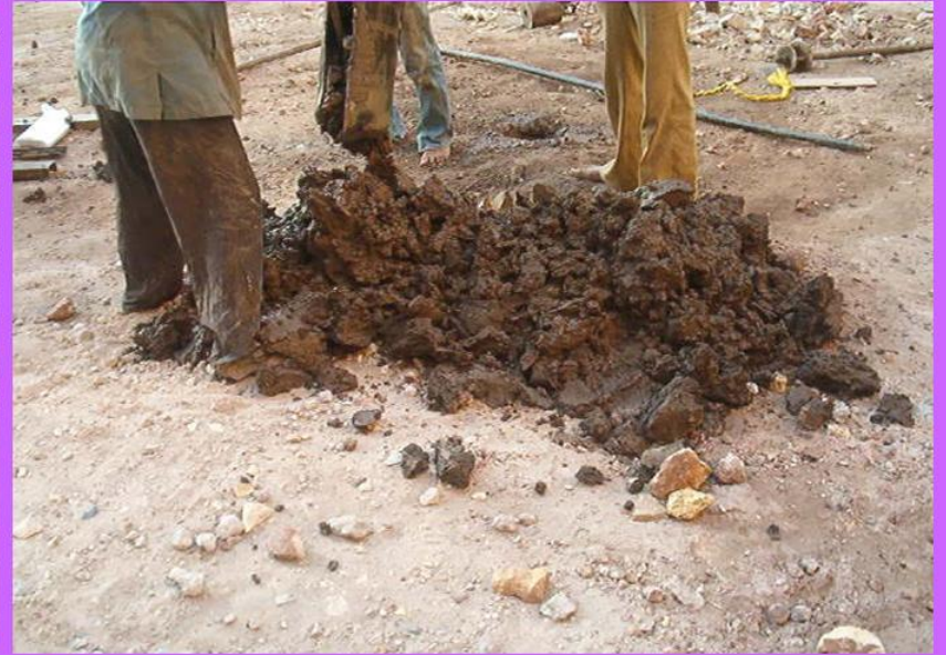
عينات مشمعة ونتاج حفر