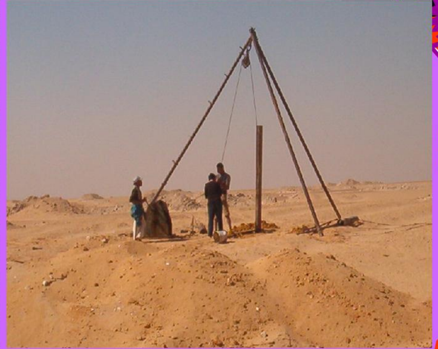
المقص (السبية) 3 ارجل من المواسير