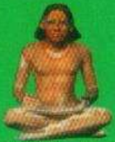
الهبة المصرية العامة للكتاب