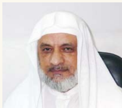
الإمام والخطيب في وزارة الأوقاف فضيلة الشيخ أمين عامر

يتعلم المهتدي الجديد في مدرسة الحج النظام، وكيف أن لكل نسك ميعاد وميقات، فلا شيء يسبق الآخر، بل كل شيء بترتيب ابتداء من وقت خروجه من بلده إلى أن يتم المناسك في أماكنها وأزمانها طاعة لله الذي هدانا وأكرمنا والرسول الذي علمنا حيث قال خذوا عني مناسككم.. في تجرد تام وخشوع وضراعة ورقة وتواضع