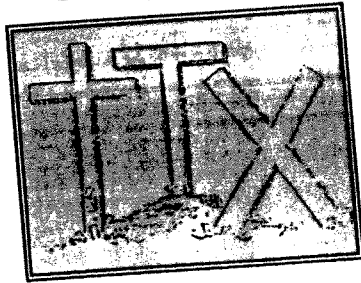
أشكال من صليبان متنوعة (٢)

جاء في قاموس الكتاب المقدس: «وللصليب نماذج رئيسة ثلاثة: أحدها المدعو صليب القديس اندراوس، وهو على شكل (X) وثانيها بشكل (+) وثالثها بشكل السيف، وهو المعروف بالصليب اللاتيني، ولعل صليب المسيح كان على الشكل الأخير، كما يعتقد الفنانون، الأمر الذي كان يسهل وضع اسم الضحية وعنوان علتها على القسم الأعلى منه» (١) .