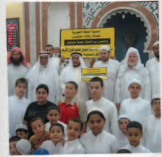
مراكز القرآن الكريم