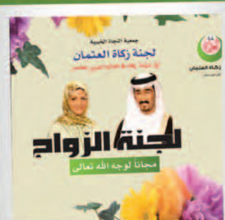
الزواج ومكافحة العنوسة