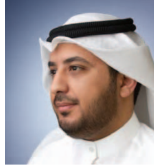
مشاري ناصر العرادة مُنشد وإعلامي