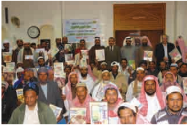
جانب من الفائزين في المسابقة