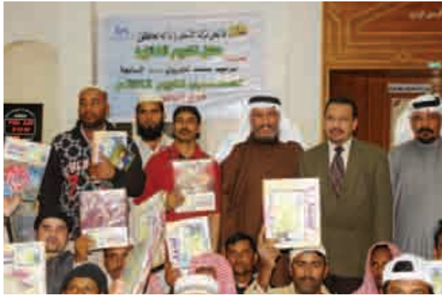
جانب آخر من التكريم

حُبًّا في القرآن الكريم ، داعيًا الله عز وجل أن يزيدهم من فضله وأن يجعلهم سفراء يبلغون الإسلام ويحرصون على تفعيل رسالته من خلال أفعالهم وأمانتهم وإخلاصهم .