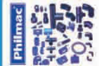
Plant Caring Products

شركة بن نصف للتجارة العامة والمقاولات BIN NISF Gen. Trad. & Cont.Co.