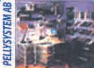
Shelving... Power Tools