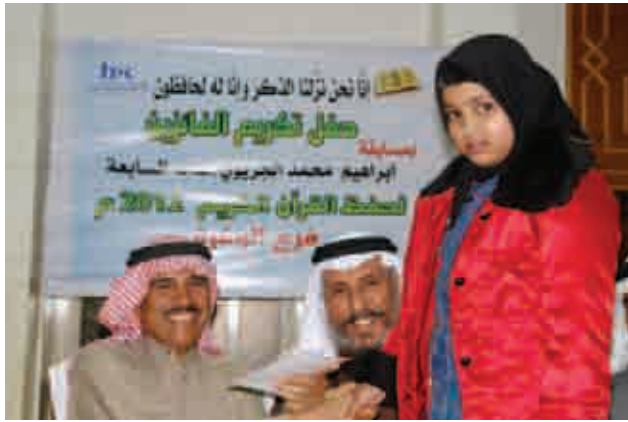
"عائشة" أصغر حافظة تُكْرَم من قبل المسؤولين