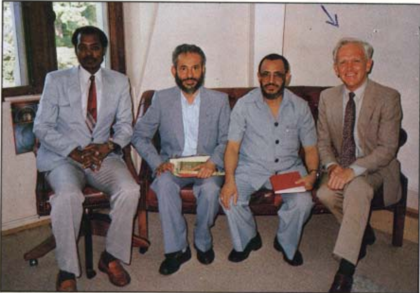
[٤] الدكتور جون تيلر (الأول من اليمين) مستشرق متخصص في دراسة اللغات اللاتينية واليونانية. جنيف - سويسرا: ١٤٠٧ / ١١ / ٤ هـ.