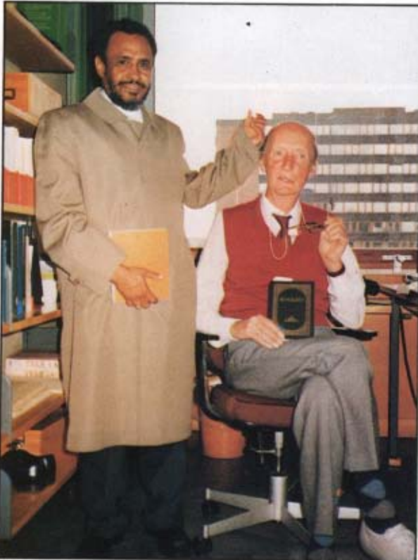
[١٢] المستشرق النرويجي الدكتور آينبرغ في مقر عمله في جامعة أسلو، حاملاً كتاب «أصول الإيمان» للشيخ محمد بن عبد الوهاب. برج - النرويج: ١٤٠٧ / ١٢ / ٣٠ هـ.