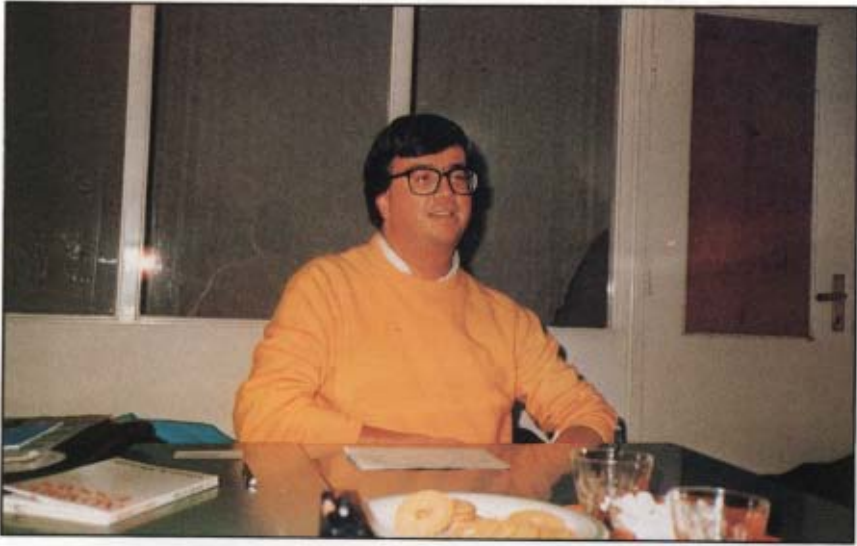
[١١] المستشرق السويدي كنت رتزن في مقر الرابطة الإسلامية. ستوكهولم - السويد: ١٤٠٧ / ١٢ / ٢١ هـ.