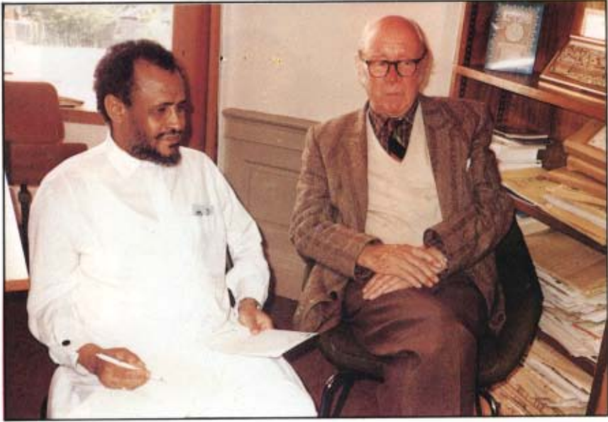
[١٣] المستشرق البريطاني الشهير وليم مونتجمري واط. أدنبرا - بريطانيا: ١٤٠٨ / ١ / ١٤ هـ.