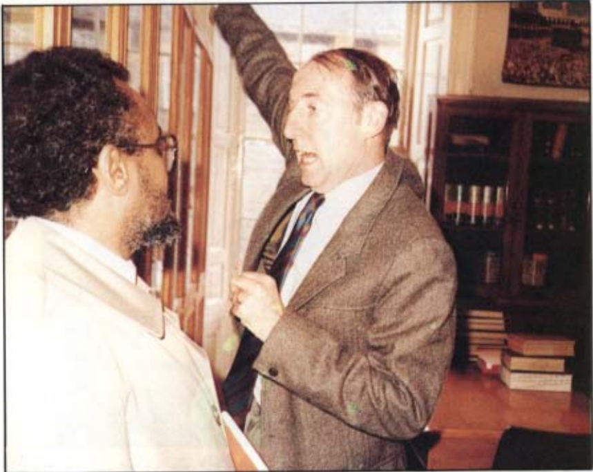
[١٤] مع المستشرق إيان هاورد في جامعة أدنبرا: ١٤٠٨ / ١ / ١٥ هـ.