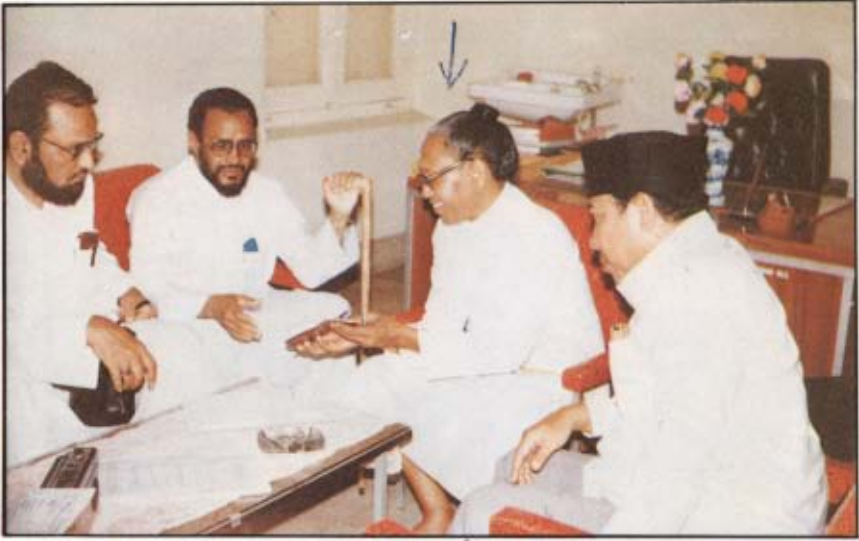
[١] زعيم الهندوكيين (الثاني من اليمين) مبدئياً سروره بما سمع وتواضعه. ستجاراجا - أندونيسا: ١٦ / ٩ / ١٤٠٠ هـ.